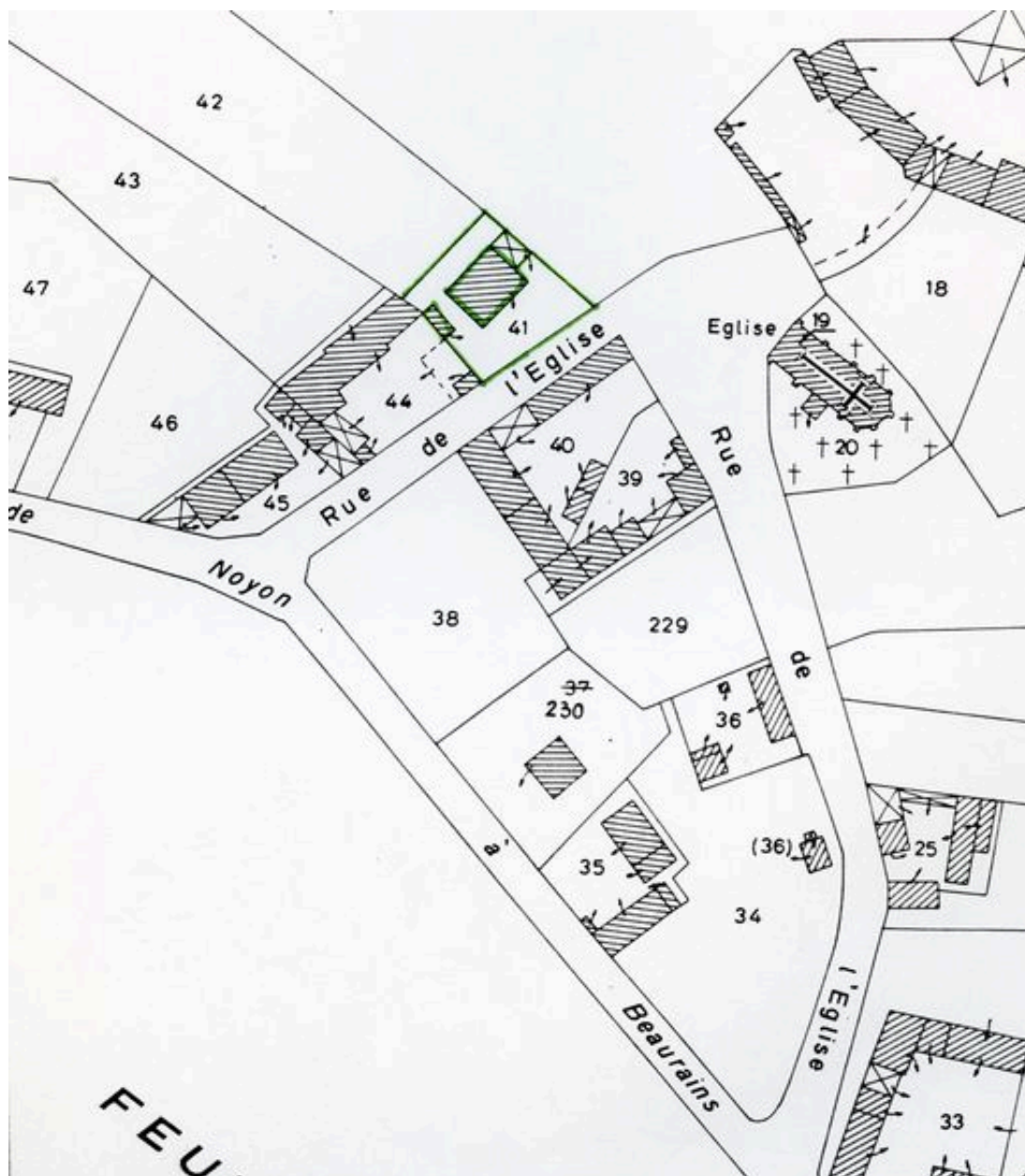
Plan de situation. Extrait du plan cadastral de 1982, section A1 41.