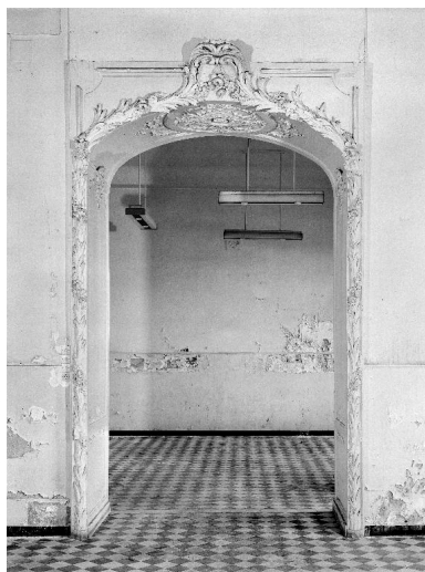
Vue de l'encadrement de la première porte.