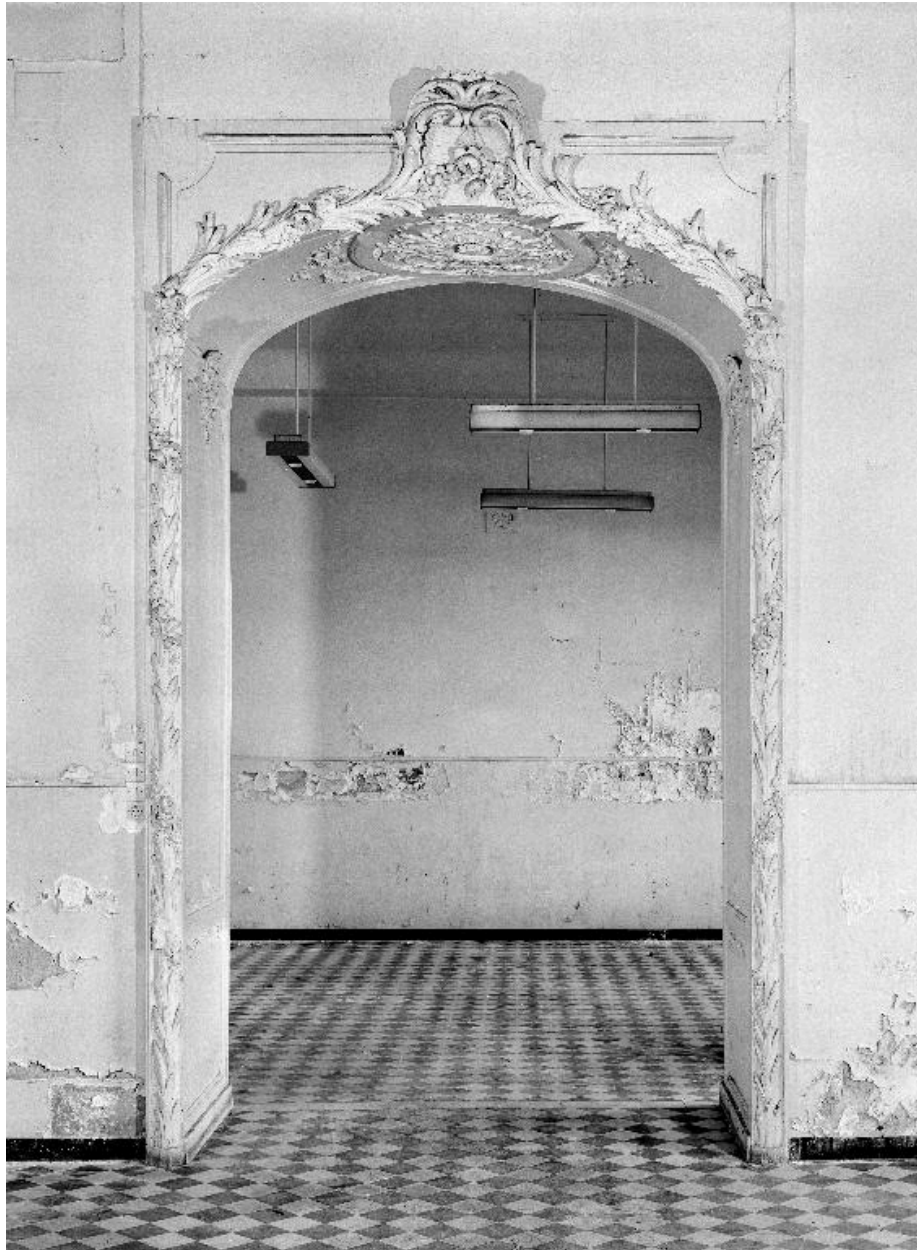
Vue de l'encadrement de la première porte.