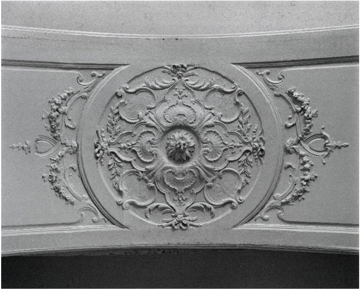
Décor de la partie centrale de l'intrados de l'embrasure intérieure de la seconde porte.