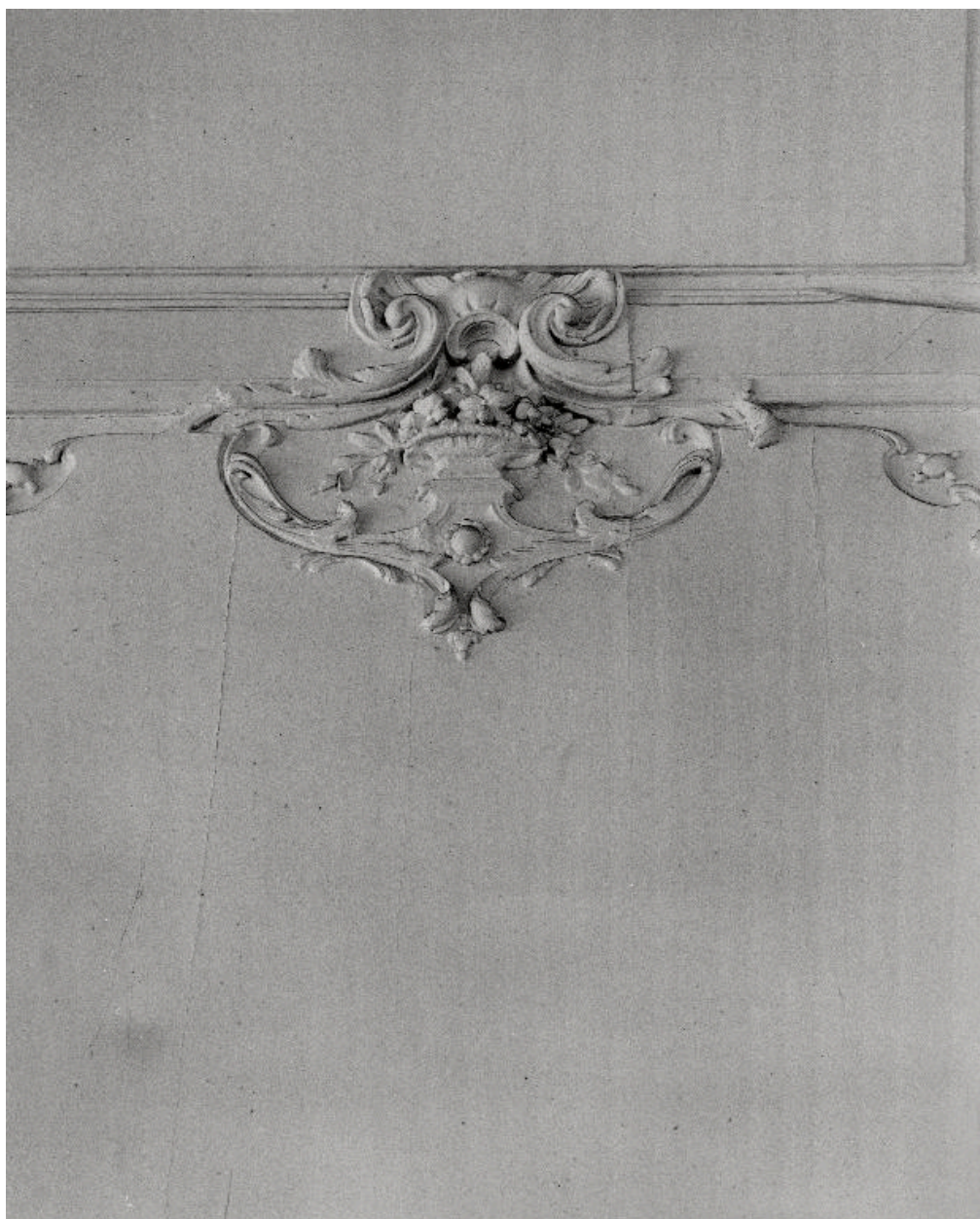
Détail du décor d'un tableau de l'embrasure intérieure de la seconde porte.