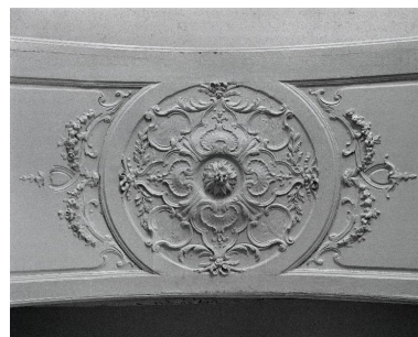
Décor de la partie centrale de l'intrados de l'embrasure intérieure de la seconde porte.