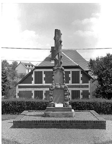
Vue générale. IVR22_19990203038X