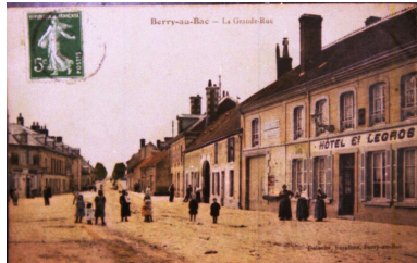
Berry-au-Bac. La Grande rue. L'ancien hôtel Legros. Carte postale, début 20e siècle (coll. part.). IVR22_20030202625NUCAB