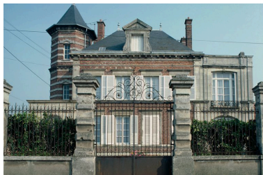
Elévation antérieure. IVR22_19856001323ZA