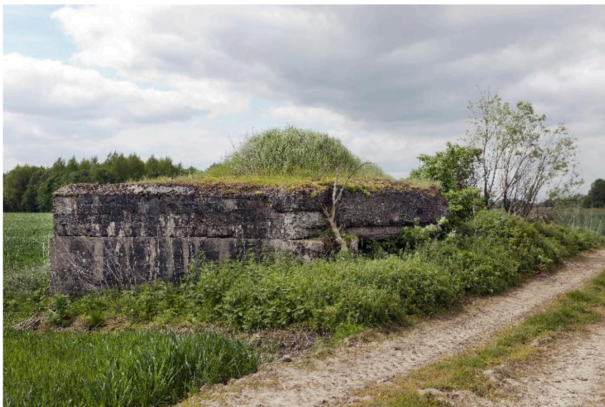
Vue latérale, vers sud-ouest