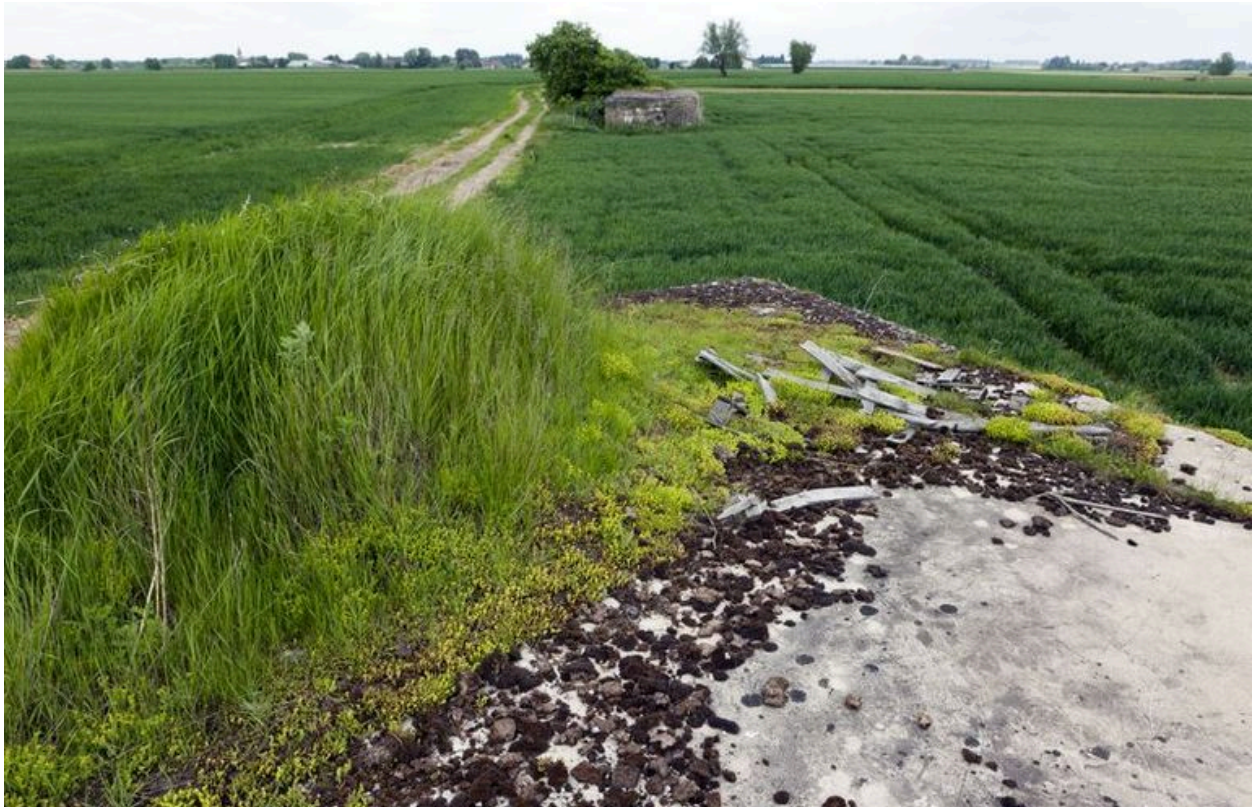
Depuis le couvrement, vue vers le blockhaus 205