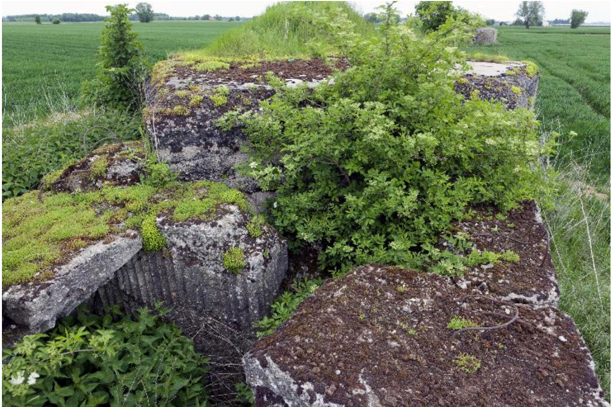
La soute à munitions explosée