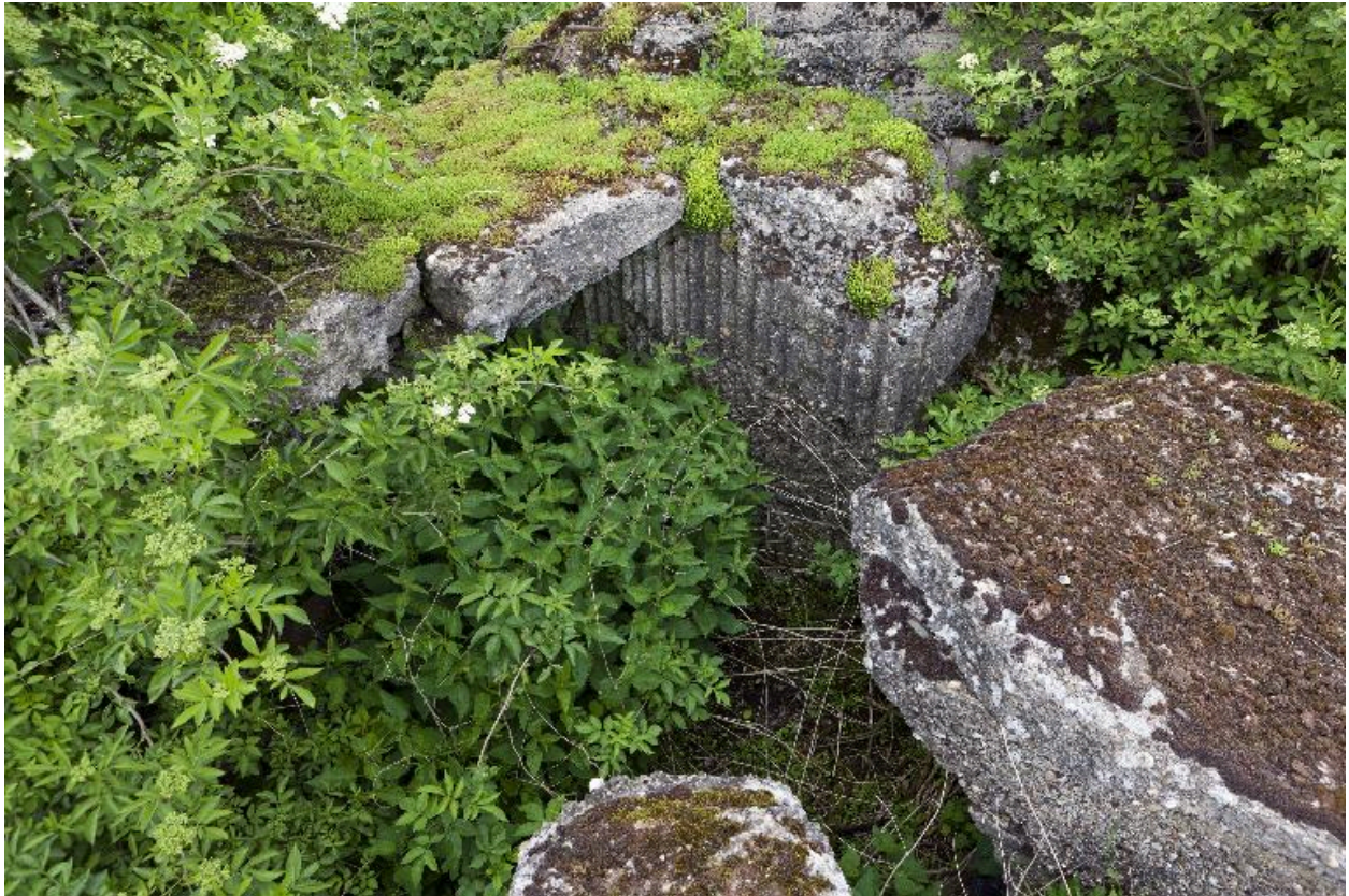
Depuis le vouvrement de la chambre de tir : La soute à munitions explosée