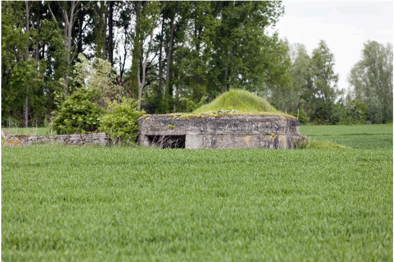
Vue générale vers le nord-ouest