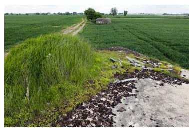
Depuis le couverture, vue vers le blockhaus 205 IVR31_20145904340NUCA