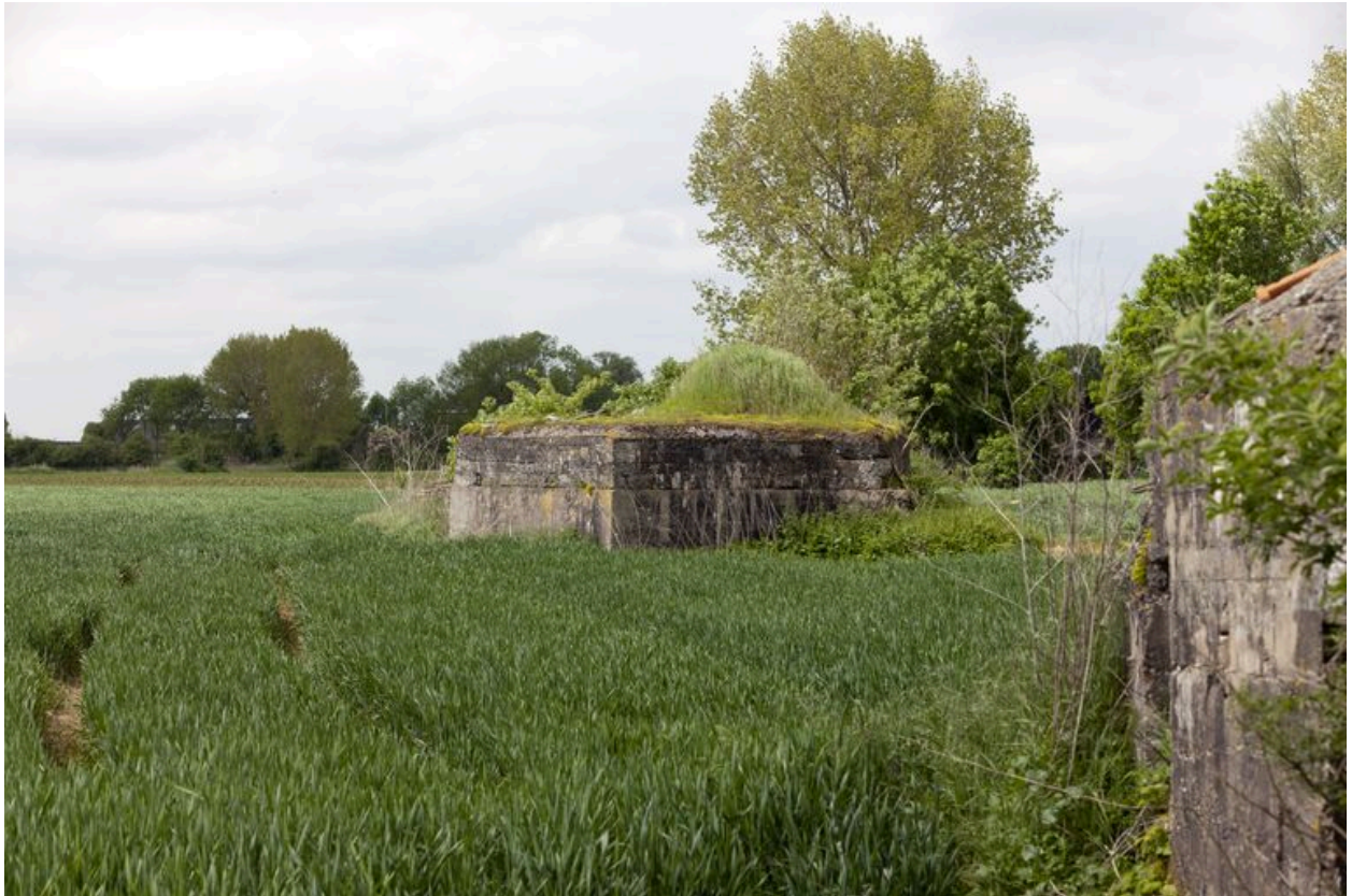
Vue latérale, vers le sud-ouest depuis le blockhaus 205