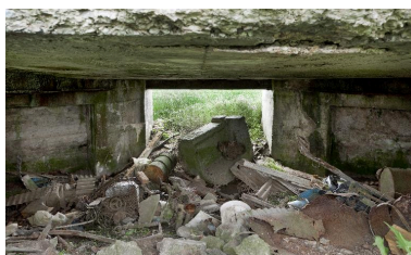
Chambre de tir, vers le front