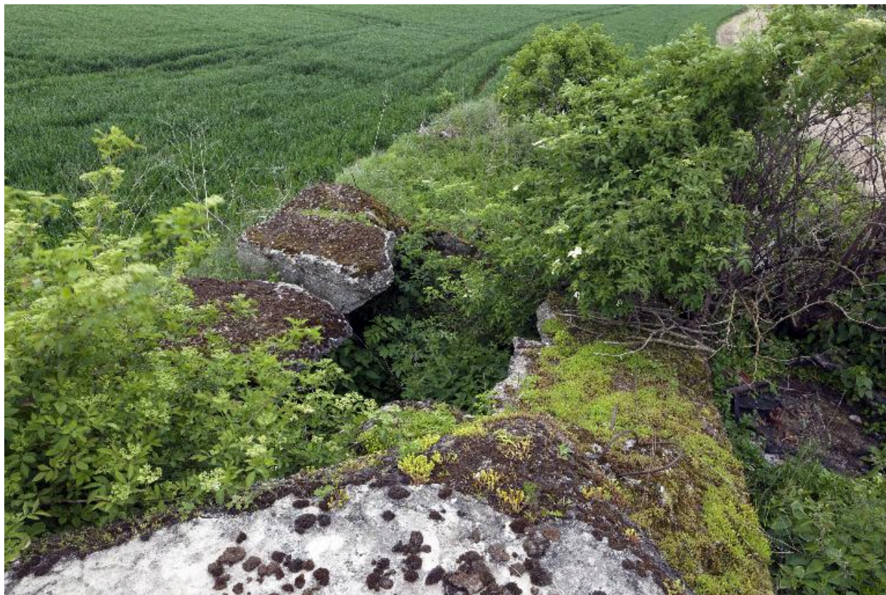
La soute à munition explosée