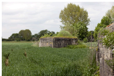
Vue latérale, vers le sud-ouest depuis le blockhaus 205