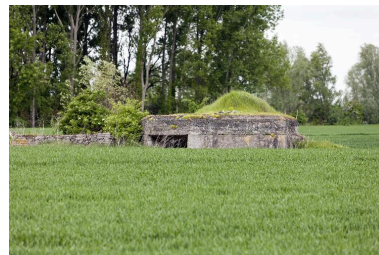
Vue générale vers le nord-ouest