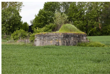
Vue latérale, vers l'ouest