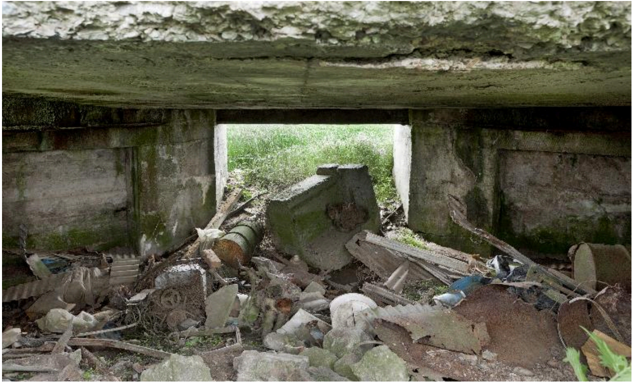
Chambre de tir, vers le front