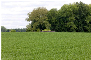
Vue générale vers le nord-ouest IVR31_20145904326NUCA