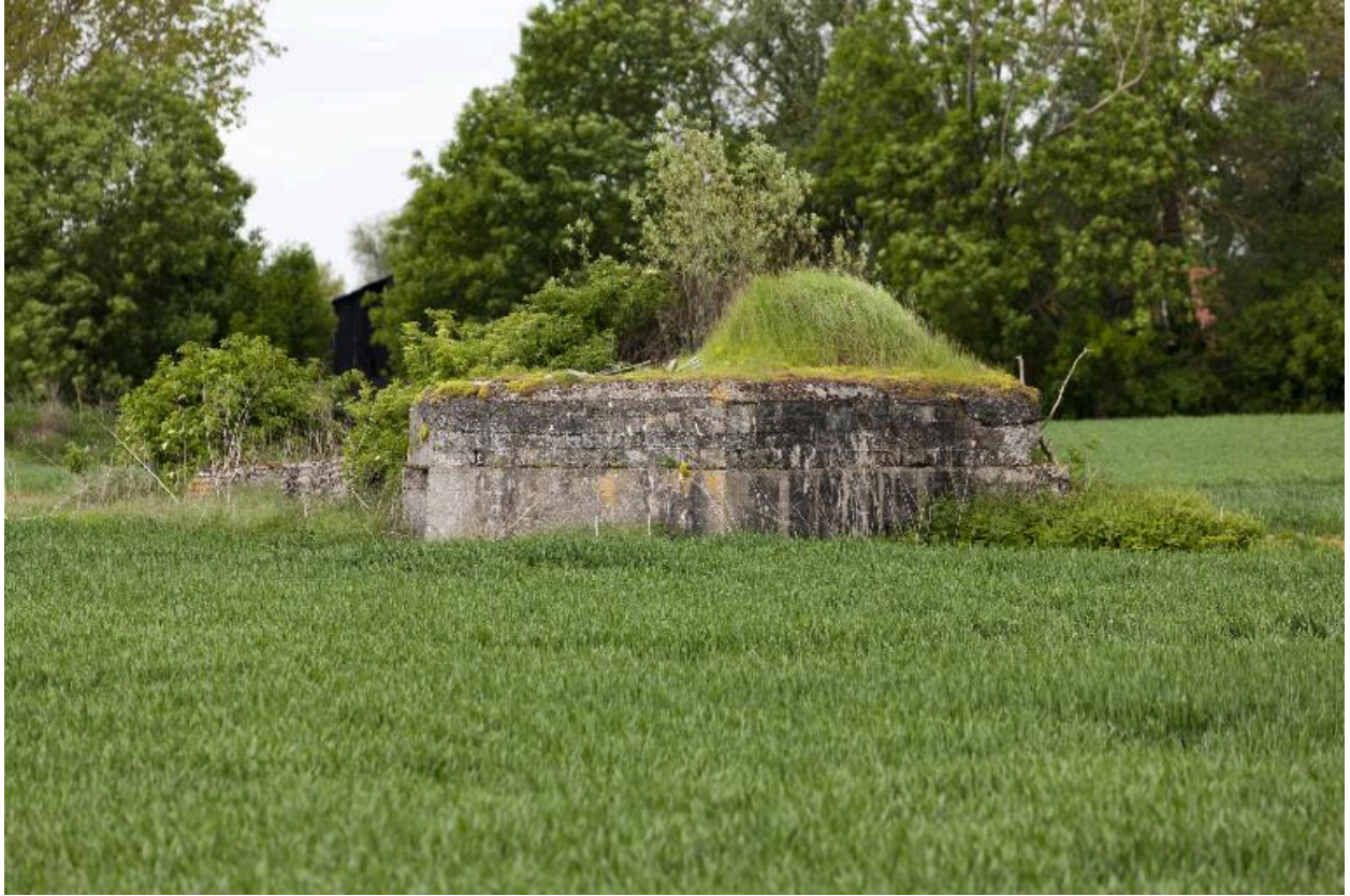
Vue latérale, vers l'ouest