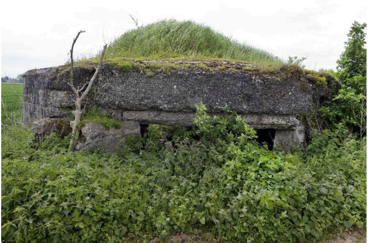
Vue vers le sud-est : sortie de chambre de tir