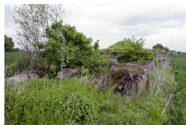
Vue latérale vers l'est. Soute à munitions