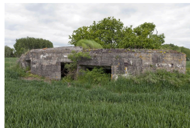
Entrées postérieures