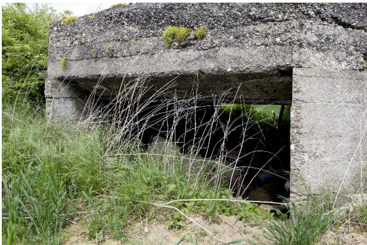
Entrée de la chambre de tir