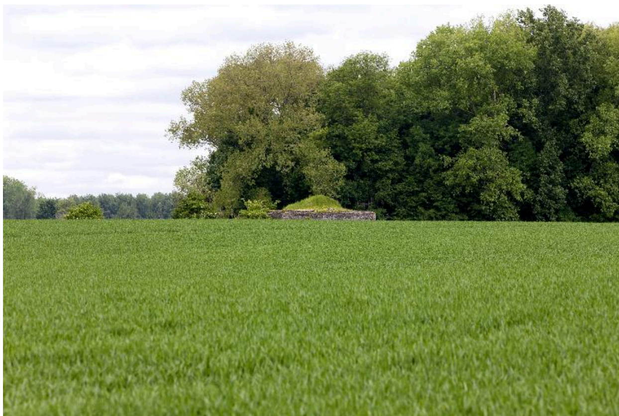
Vue générale vers le nord-ouest