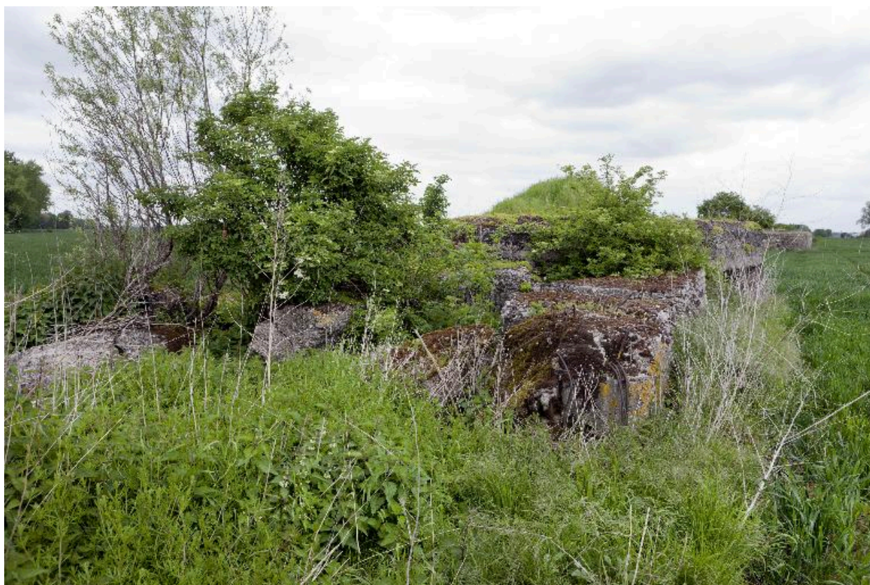
Vue latérale vers l'est. Soute à munitions