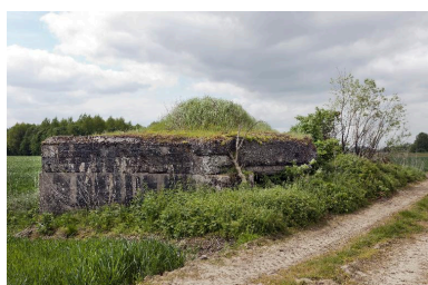
Vue latérale, vers sud-ouest