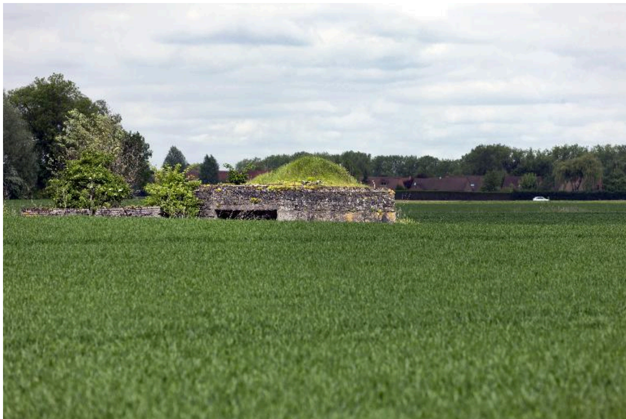
Vue vers le nord-ouest