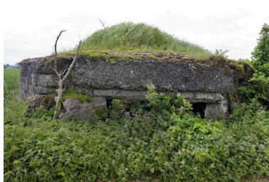
La soute à munition explosée