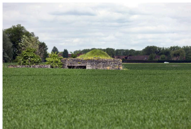
Vue vers le nord-ouest IVR31_20145904327NUCA