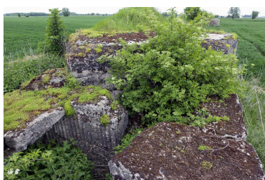
La soute à munitions explosée IVR31_20145904338NUCA