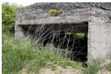
Entrée de la chambre de tir IVR31_20145904335NUCA