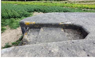
Cuve à mitrailleuse. Vue latérale