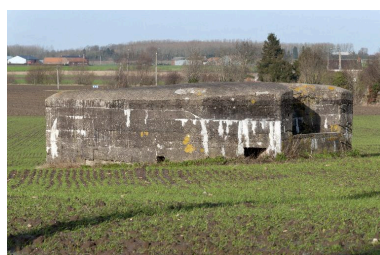
Vue de trois-quarts vers le nord. L'accès sur le pan coupé ainsi que le créneau de fusillade, à gauche, sont partiellement enterrés.