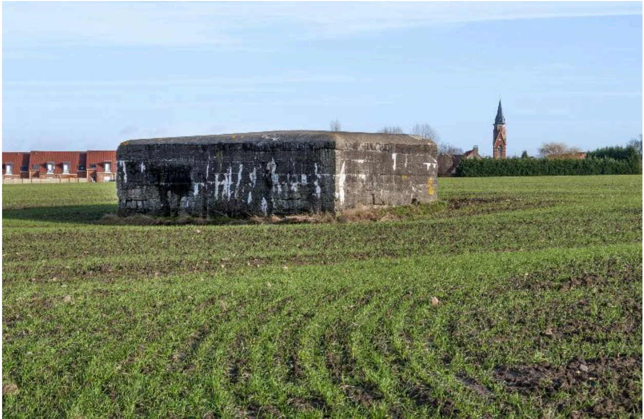
Vue de trois-quarts arrière, vers l'est