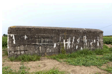
Elévation ouest IVR31_20145904965NUCA