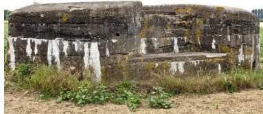
Vue de trois-quarts, vers le nord-ouest. Des échelons métalliques facilitent l'accès à la banquette de tir et à la mitrailleuse logée dans une cuvette polygonale, sur le couverture