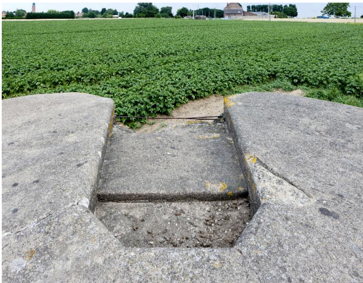
Cuve à mitrailleuse. Vue longitudinale, vers l'est