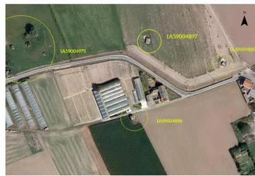
Situation de l'édifice (en bas et au centre) sur une photographie britannique de 2009 IVR32_20175900718NUCA