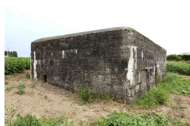
Vue de trois-quarts, vers le sud. En bas, à gauche, un créneau de fusillade IVR31_20145904966NUCA