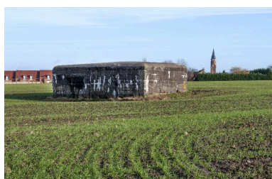
Vue de trois-quarts arrière, vers l'est IVR31_20145904972NUCA