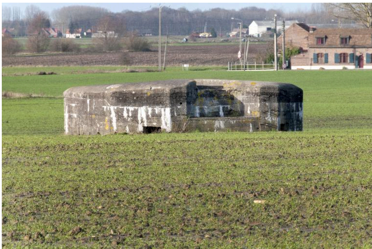
Vue générale vers le nord-ouest