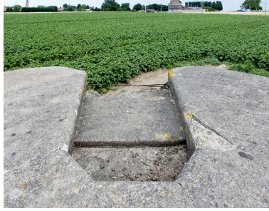
Cuve à mitrailleuse. Vue longitudinale, vers l'est IVR31_20145904968NUCA