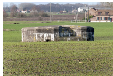
Vue générale vers le nord-ouest IVR31_20145904969NUCA