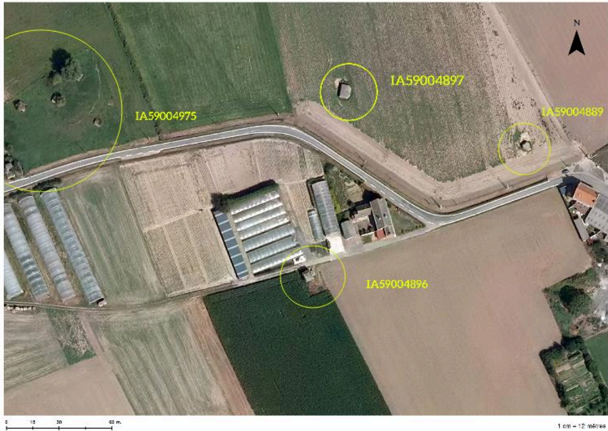
Situation de l'édifice (en bas et au centre) sur une photographie britannique de 2009