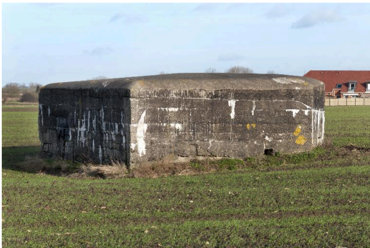
Vue de trois-quarts arrière, vers le nord-est. On distingue la partie haute du créneau de fusillade