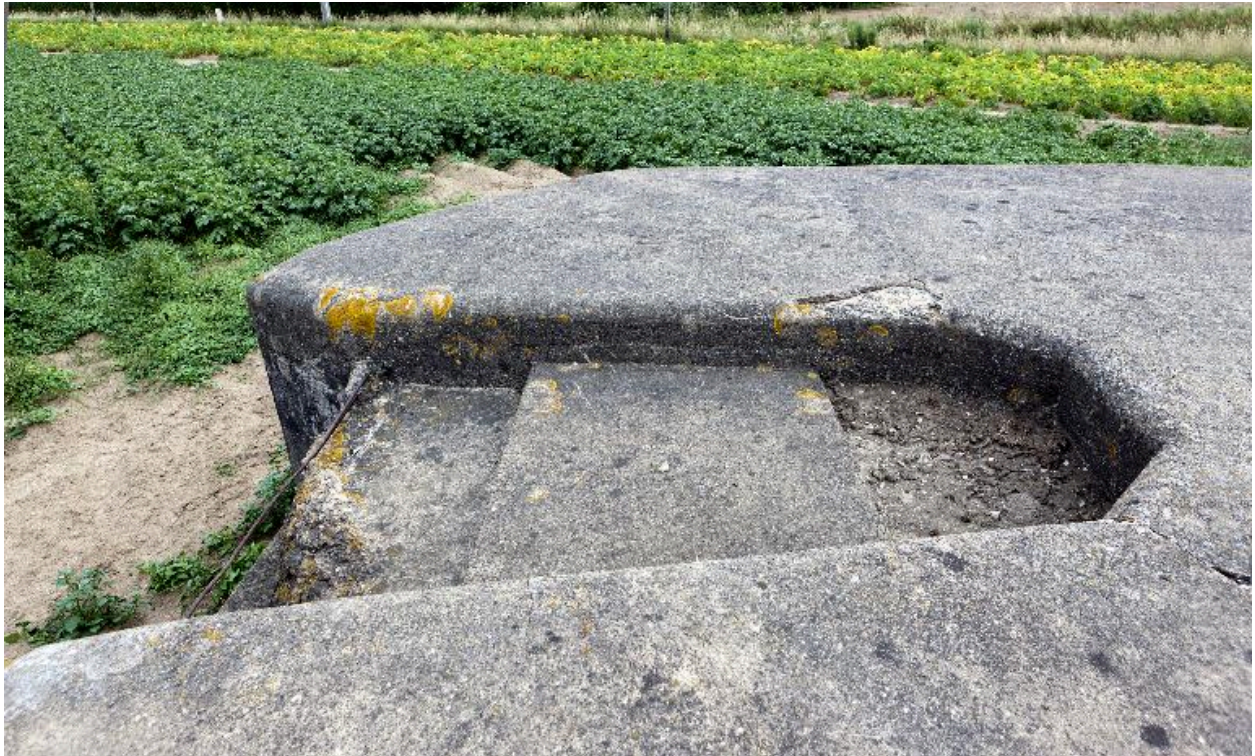
Cuve à mitrailleuse. Vue latérale