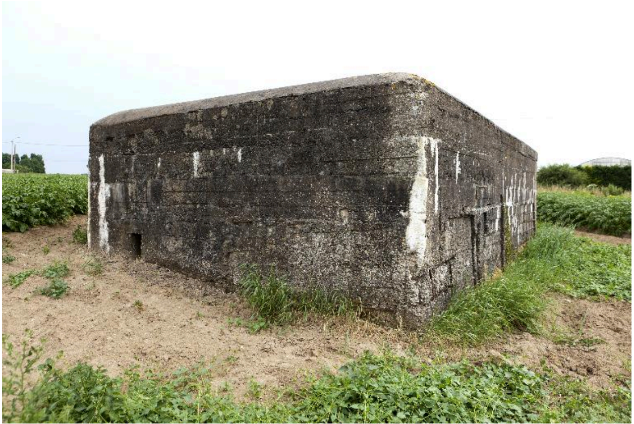
Vue de trois-quarts, vers le sud. En bas, à gauche, un créneau de fusillade