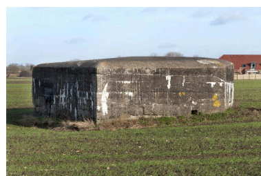
Vue de trois-quarts arrière, vers le nord-est. On distingue la partie haute du créneau de fusillade