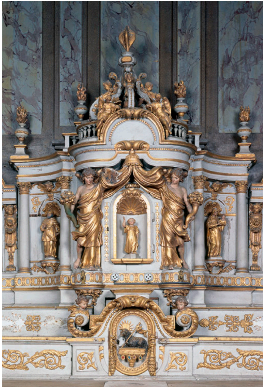
Vue de la partie centrale.