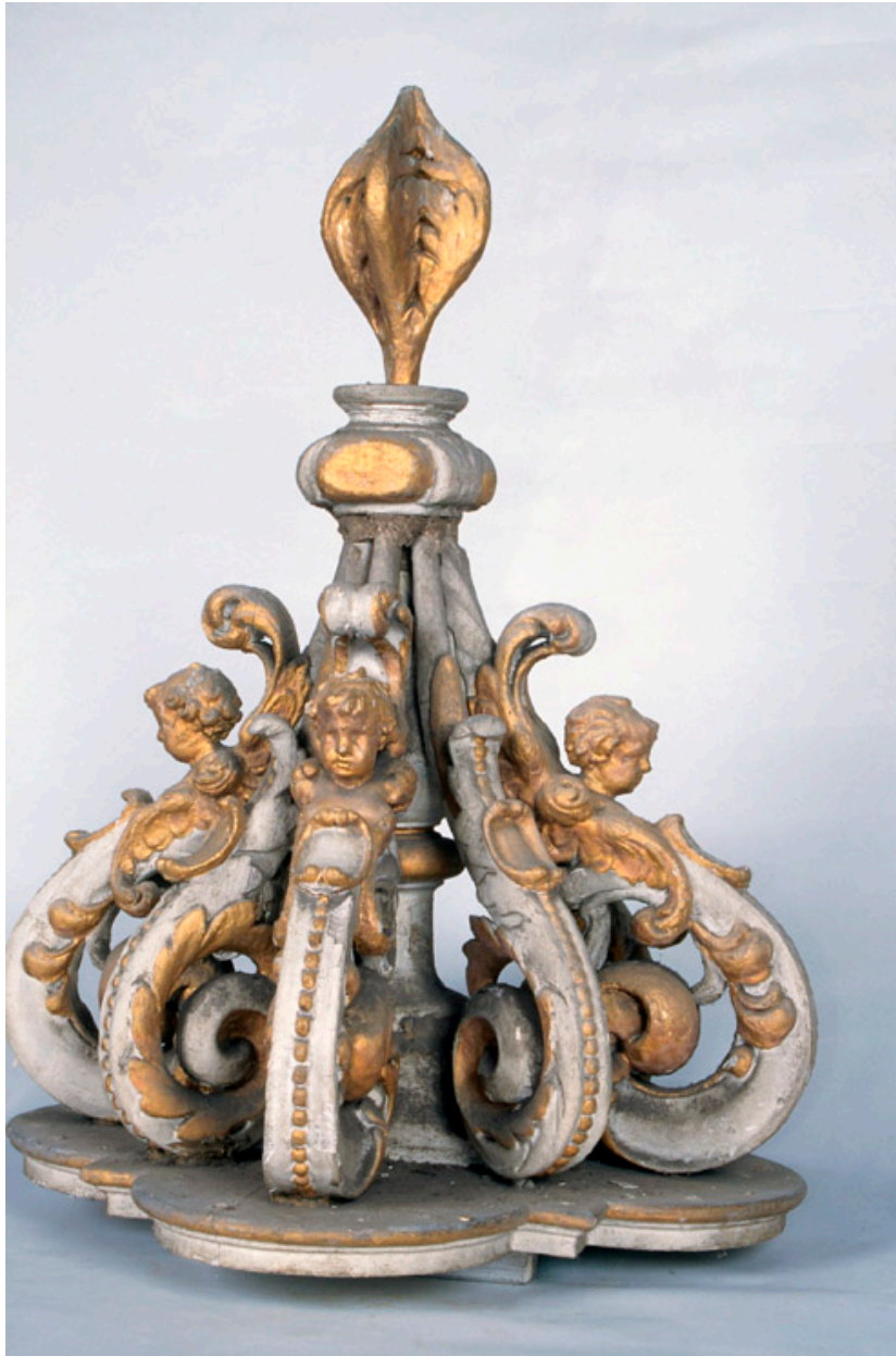
Couronnement du tabernacle.