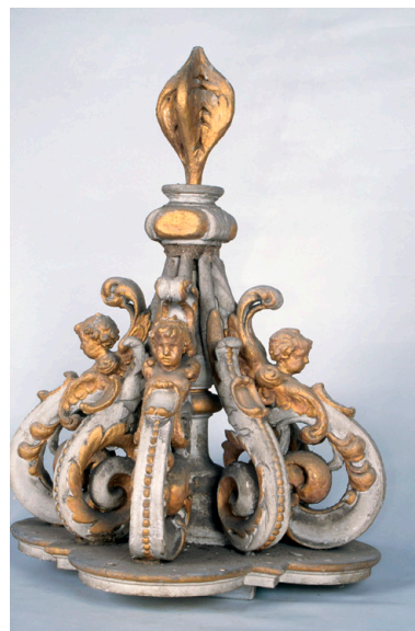
Couronnement du tabernacle.