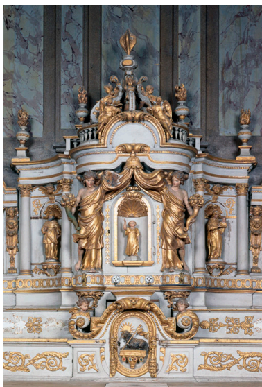
Vue de la partie centrale.