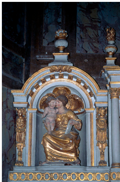
Aile gauche : niche avec la statue de la Vierge à l'Enfant.

IVR22_19988000306ZA