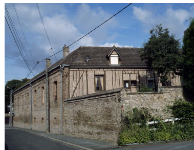
Vue arrière du logis.

Phot. Marie-Laure Monnehay-Vulliet IVR22_20098000355XA