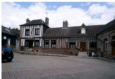
Logis et logement.

IVR22_20098005047NUCA