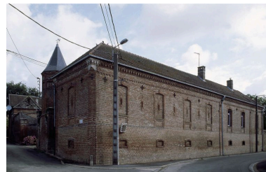
Vue générale depuis la rue de la Ville. IVR22_20098000258XA