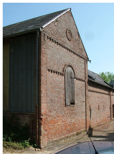
Mur-pignon de la grange. IVR22_20098005049NUCA