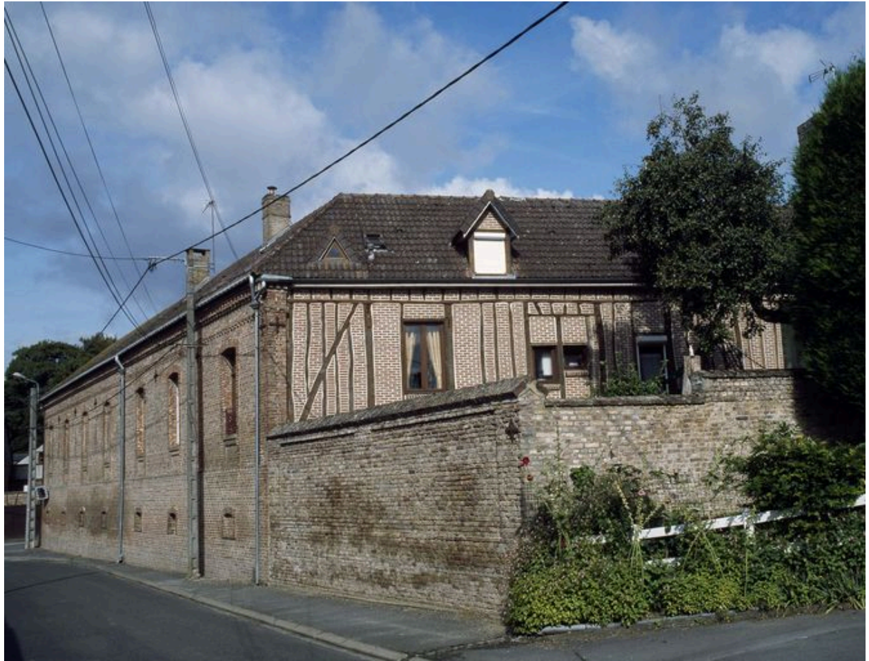
Vue arrière du logis.