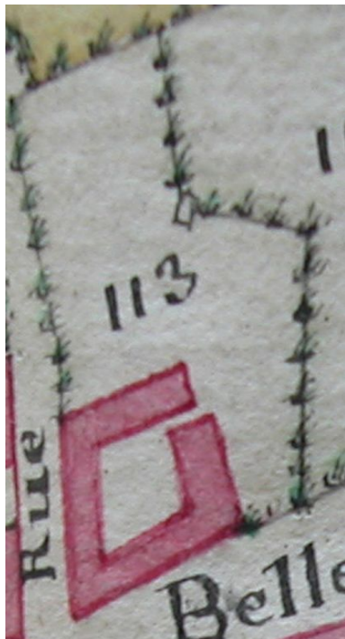
Détail de l'atlas terrier, première carte, 4e quart du 18e siècle (AD Somme ; 3G 79).