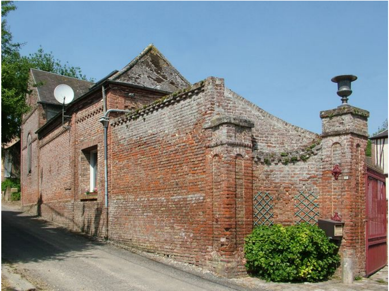
Bâtiments sur la rue Mulot.