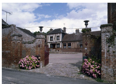
Portail, logis et logement en fond de cour. IVR22_20098000262XA