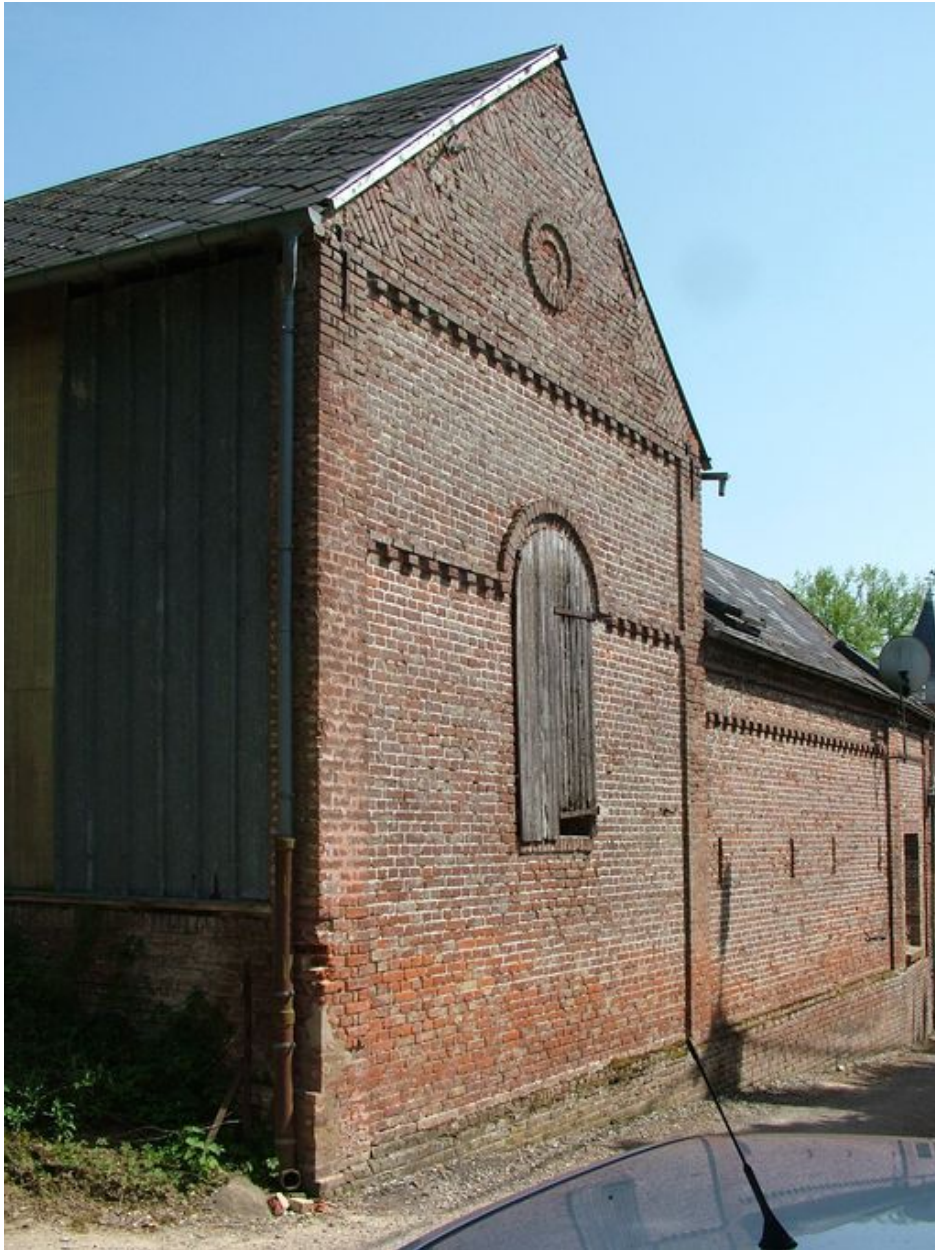
Mur-pignon de la grange.