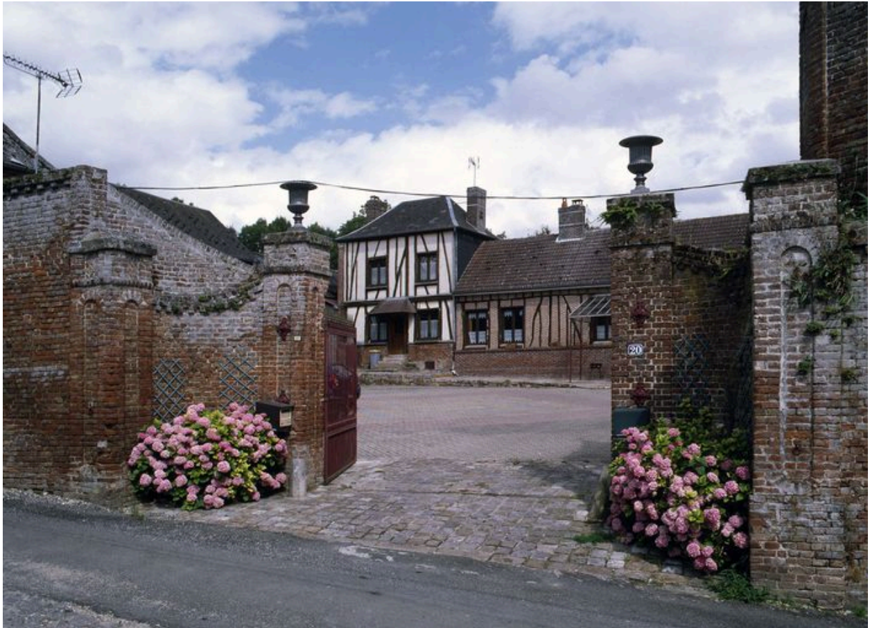
Portail, logis et logement en fond de cour.