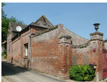
Bâtiments sur la rue Mulot. IVR22_20098005048NUCA