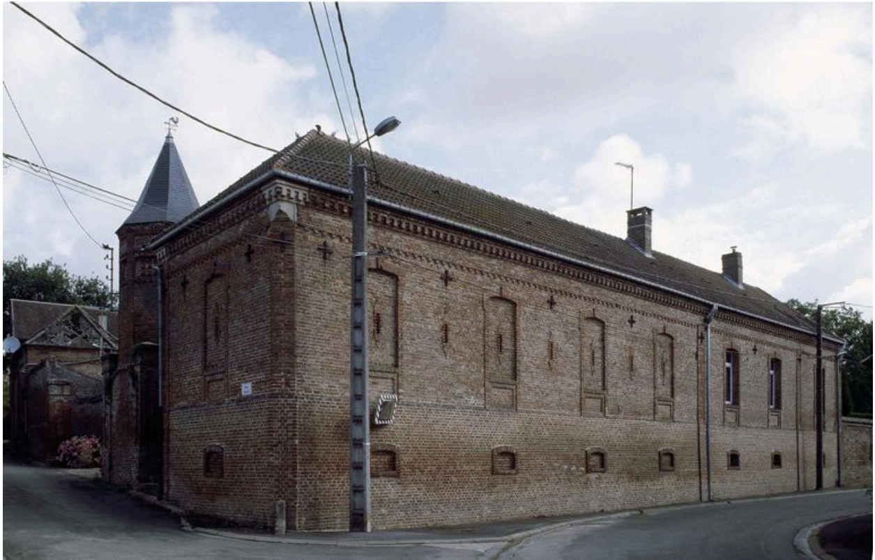
Vue générale depuis la rue de la Ville.