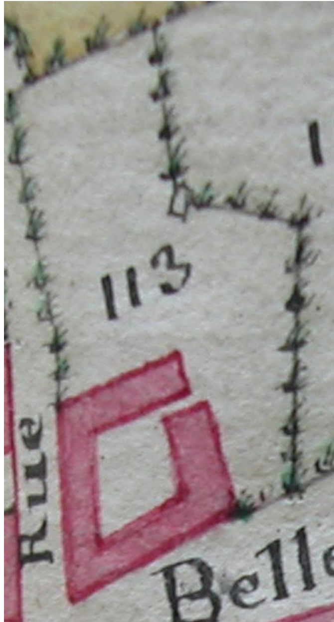
Détail de l'atlas terrier, première carte, 4e quart du 18e siècle (AD Somme ; 3G 79).