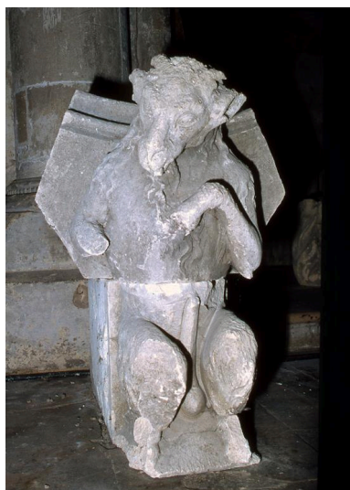
Vue du bélier musicien.