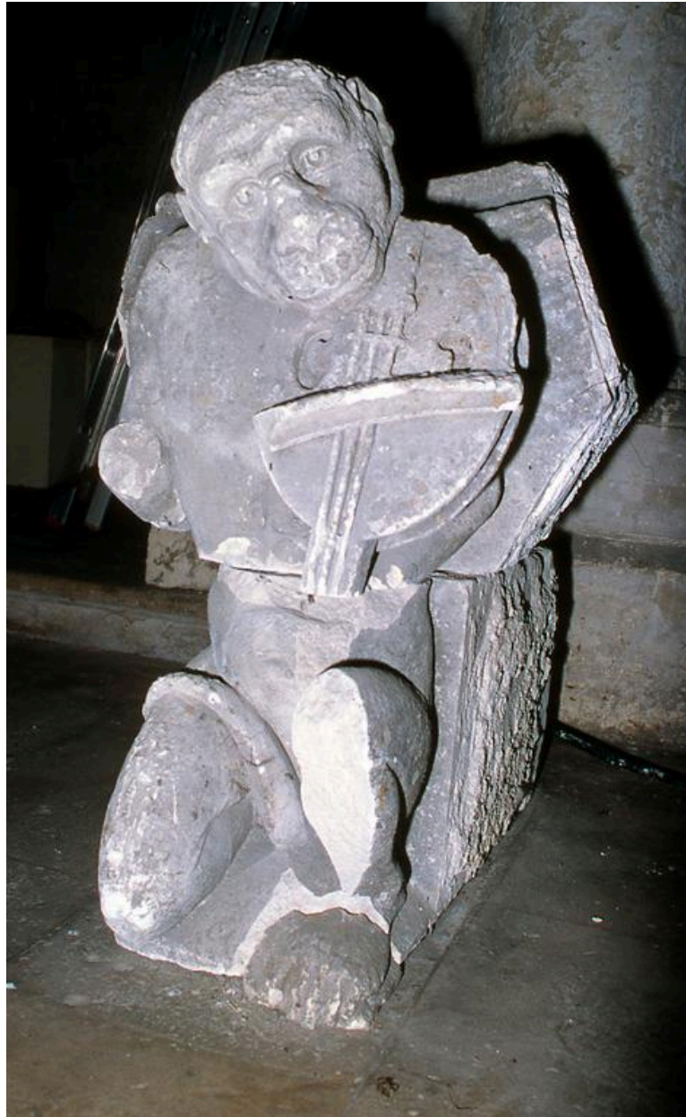
Vue du singe musicien.