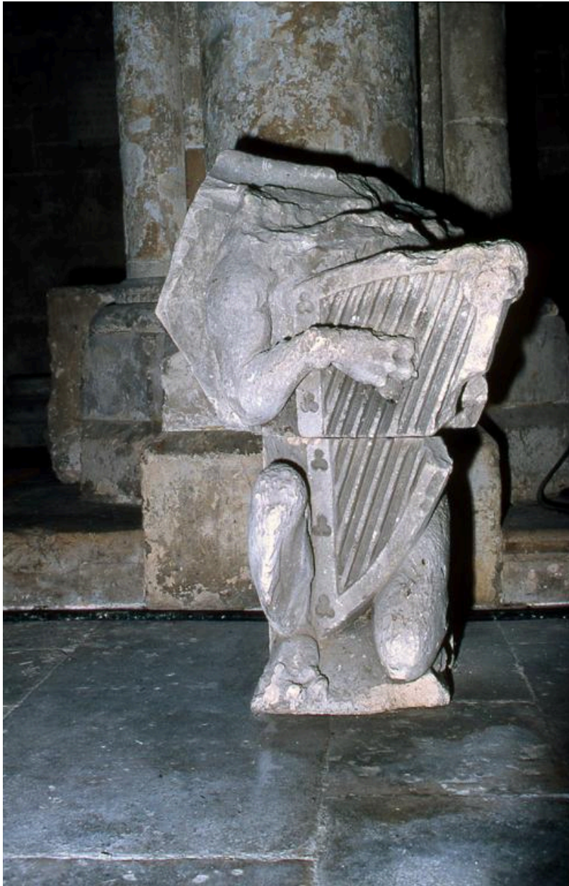
Vue du lion musicien.