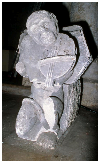
Vue du singe musicien.