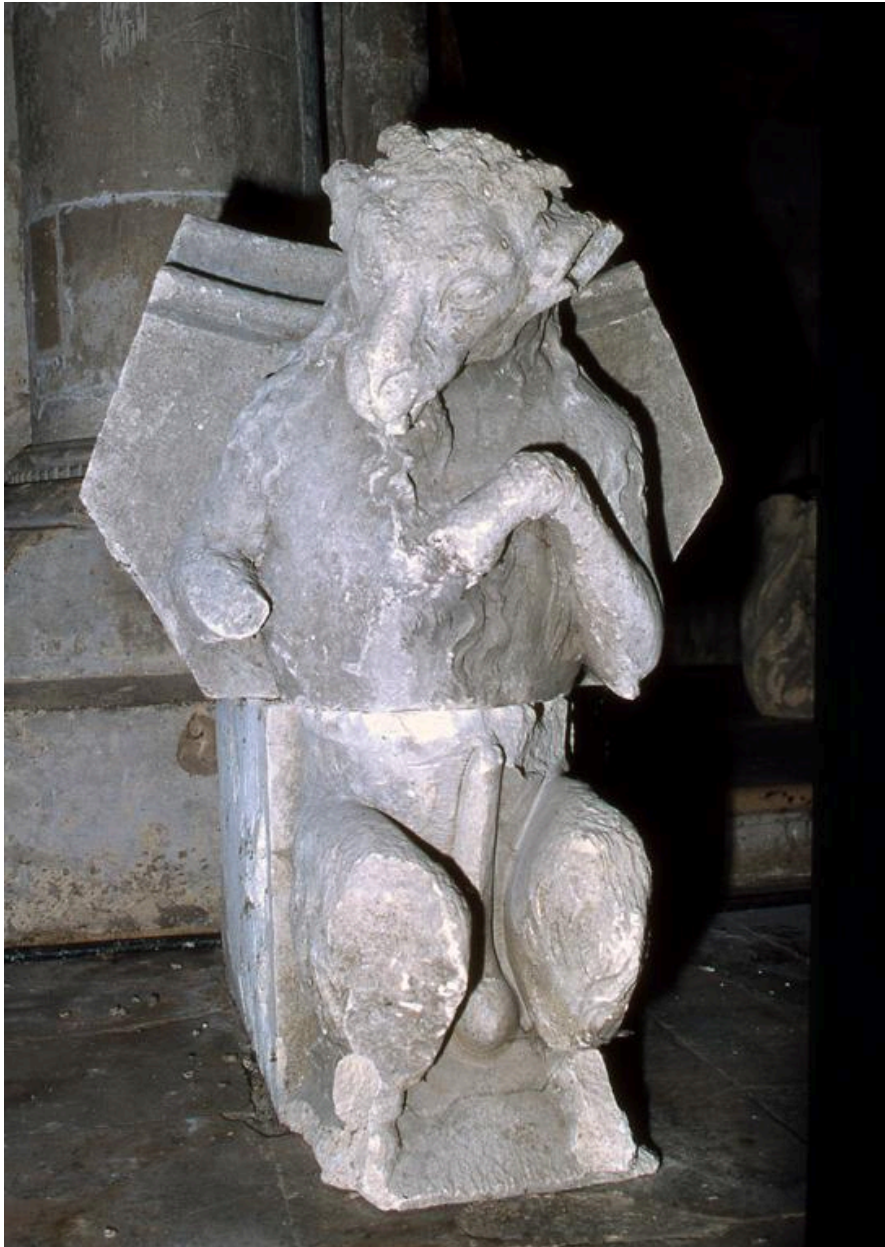
Vue du béliet musicien.