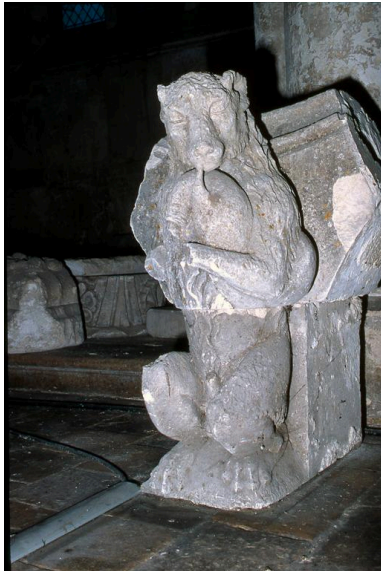
Vue du loup musicien. IVR22_19990207581ZA