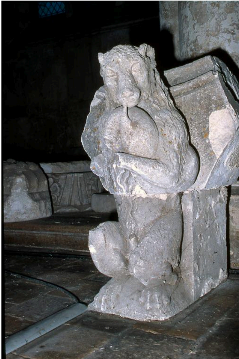
Vue du loup musicien.