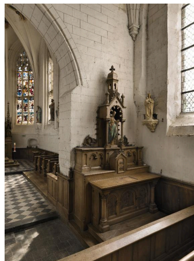
Autel secondaire de saint Joseph. IVR22_20148000242NUC2A