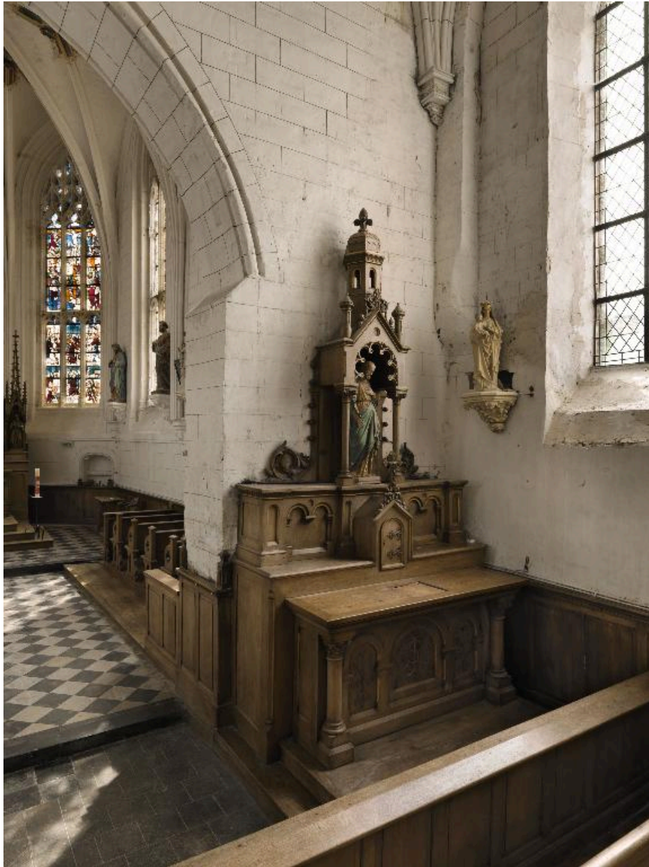
Autel secondaire de saint Joseph.