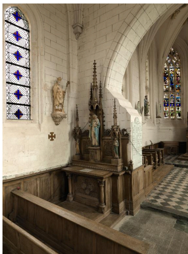
Autel secondaire de la Vierge. IVR22_20148000243NUC2A