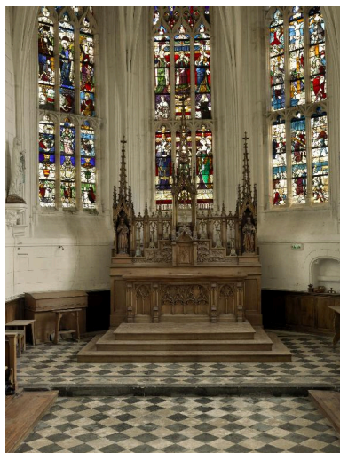
Maître-autel. IVR22_20148000241NUC2A