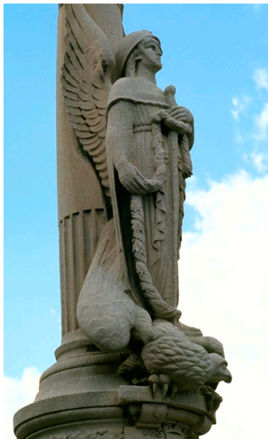
Vue de trois-quart. IVR22_19948000424ZA