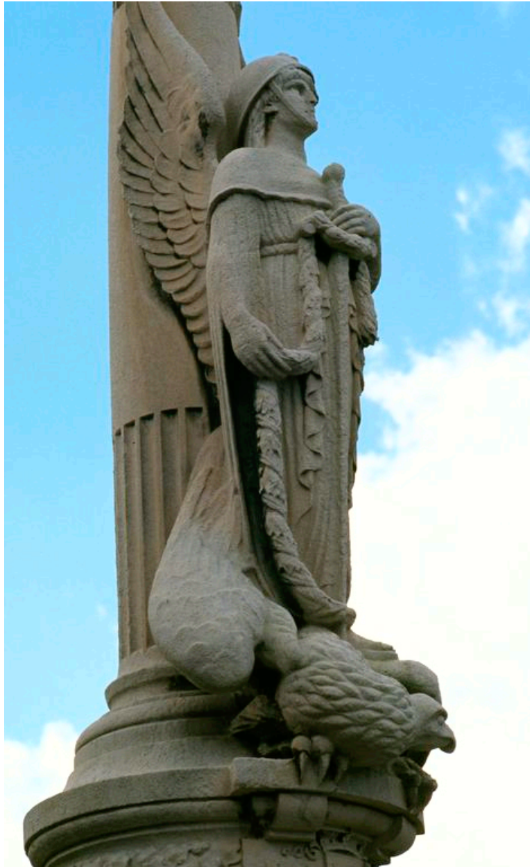
Vue de trois-quart.