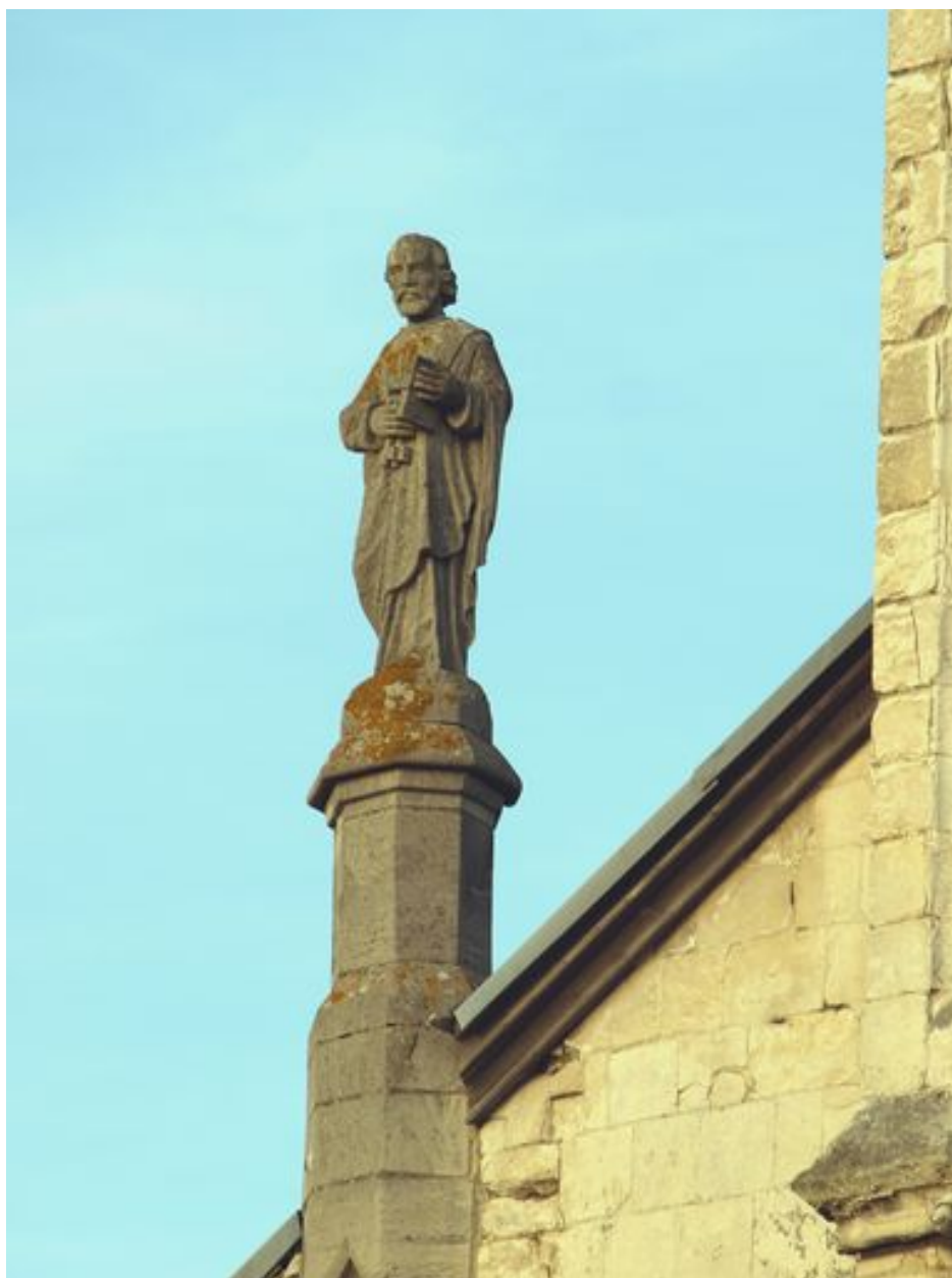
Saint Pierre : vue d'ensemble de trois-quarts