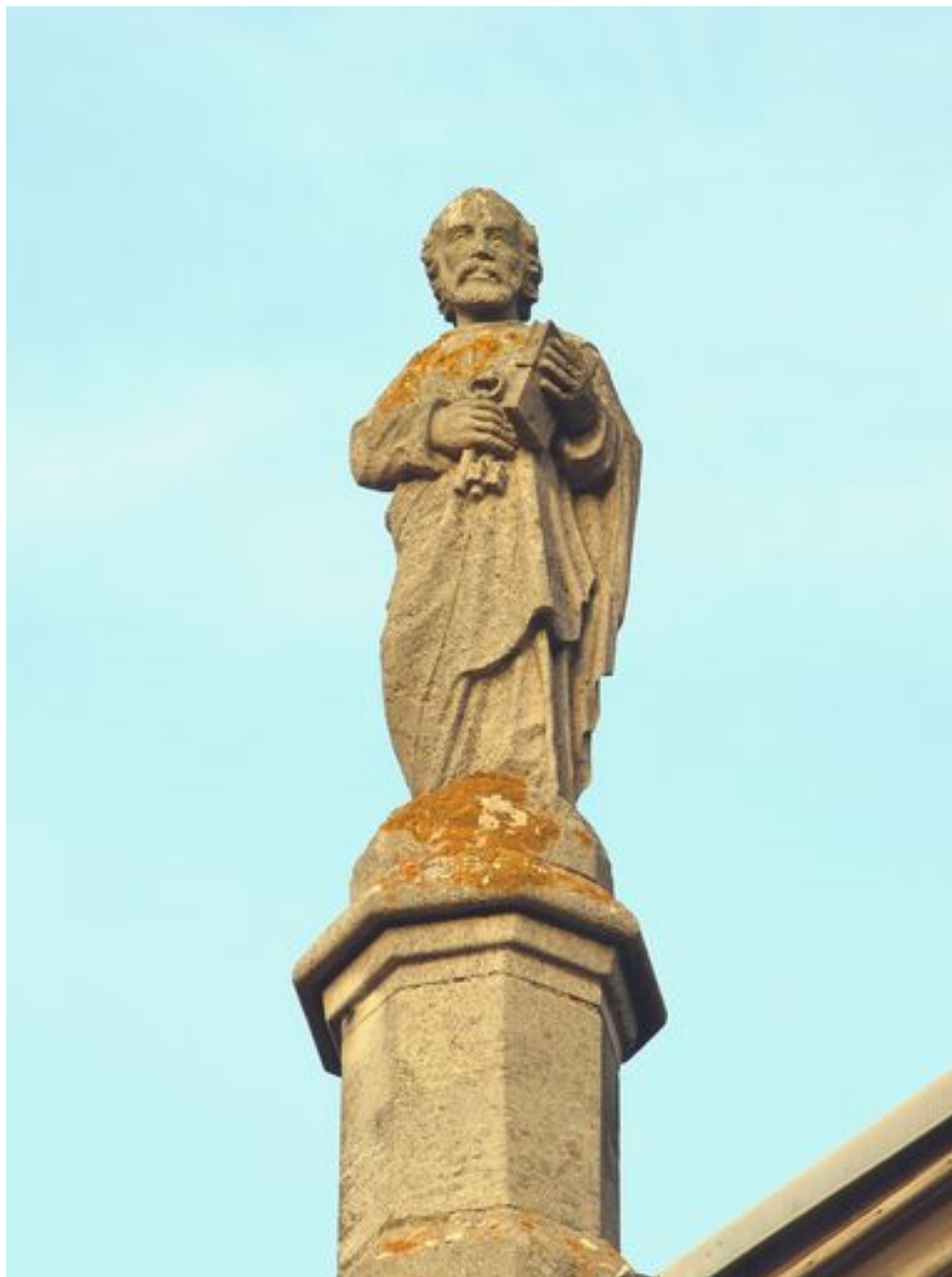
Saint Pierre : vue d'ensemble de face