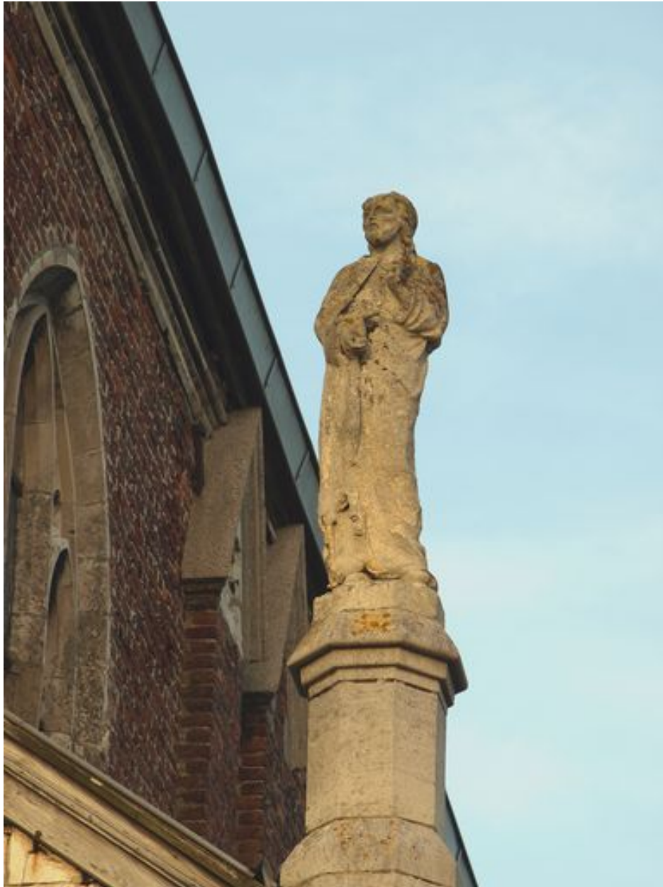
Saint Paul : vue d'ensemble de face