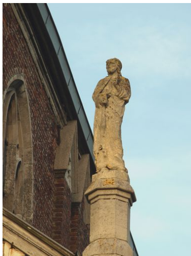
Saint Paul : vue d'ensemble de face