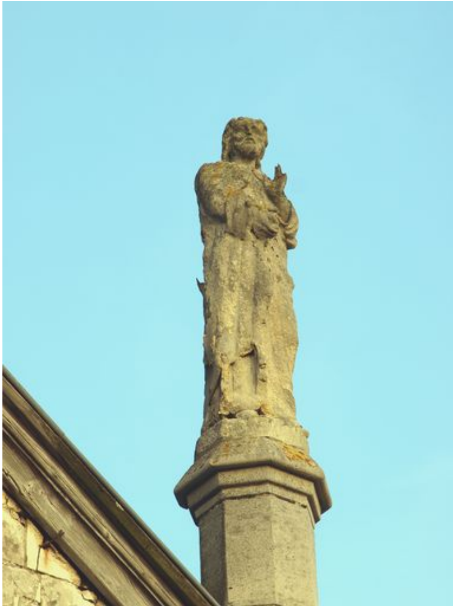
Saint Paul : vue d'ensemble de trois-quart