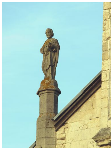
Saint Pierre : vue d'ensemble de trois-quarts IVR31_20106202640NUCA