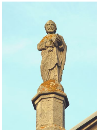
Saint Pierre : vue d'ensemble de face IVR31_20106202639NUCA