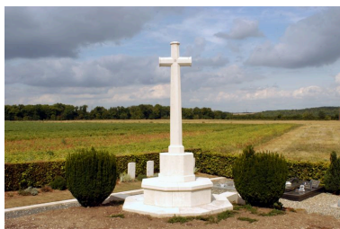
Croix du Sacrifice. IVR22_20038000959NUCA