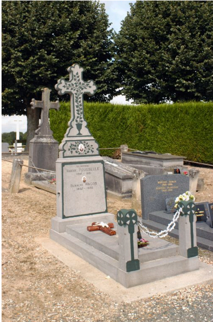
Tombeau (stèle funéraire) vers 1930.