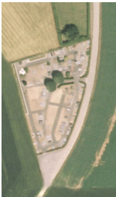
Vue aérienne.