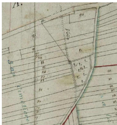
Extrait du cadastre napoléonien.