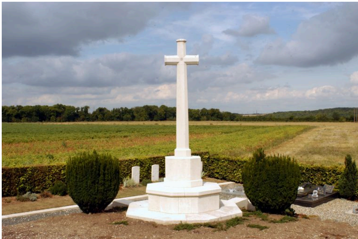
Croix du Sacrifice.