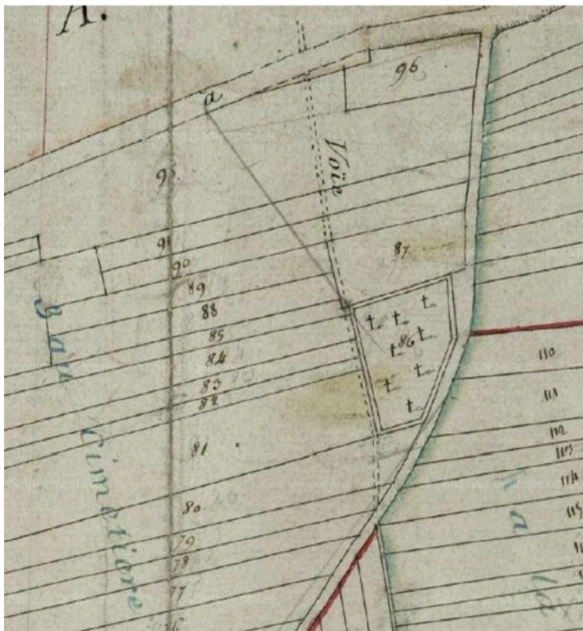
Extrait du cadastre napoléonien.