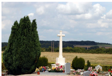
Vue vers le nord-ouest. IVR22_20038000958NUCA