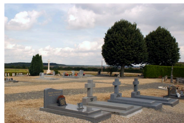
Vue générale. IVR22_20038000956NUCA