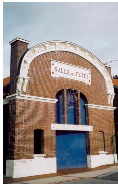
Vue générale. IVR22_20158005778NUCA