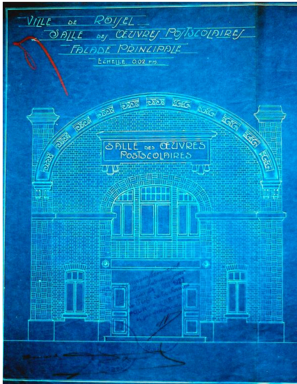
Salle des Oeuvres Post-scolaires : façade principale, Henri Bénard (architecte), [s.d.] (AD Somme ; 99 O 3249).