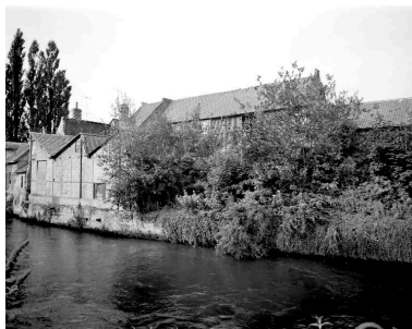
Vue générale, flanc est.