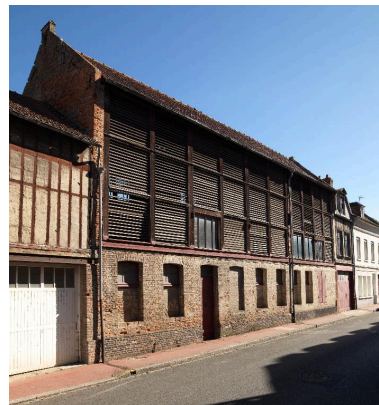
Façades donnant sur la chaussée d'Hoquet.