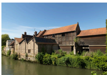
Vue générale depuis la rive droite de la Somme. IVR32_20188000346NUC2A