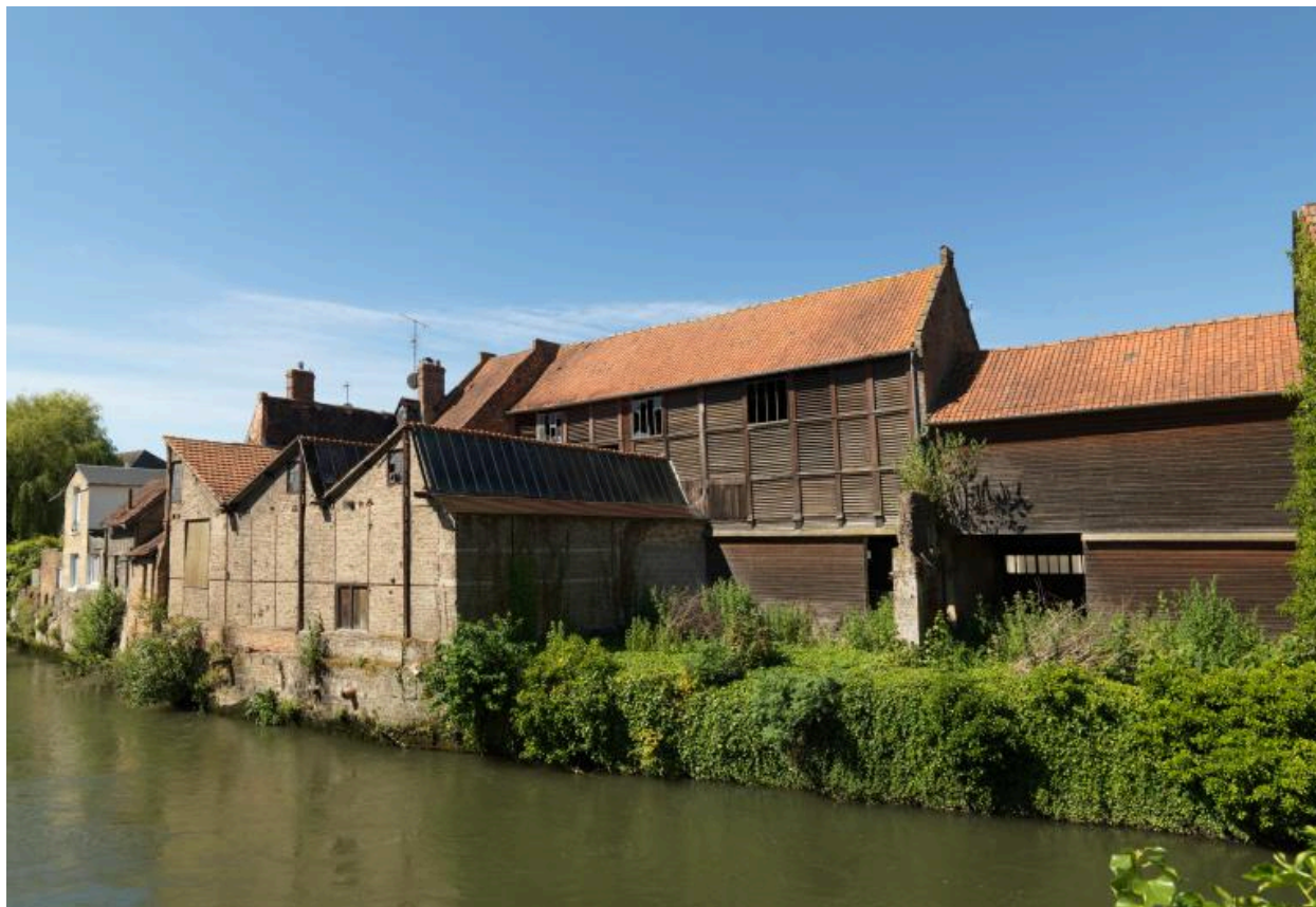
Vue générale depuis la rive droite de la Somme.