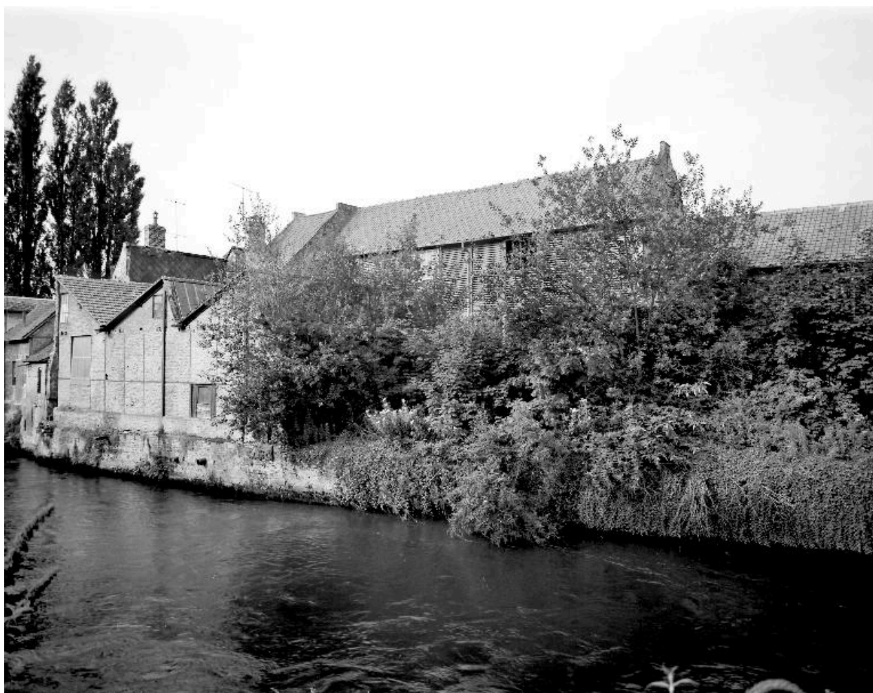
Vue générale, flanc est.