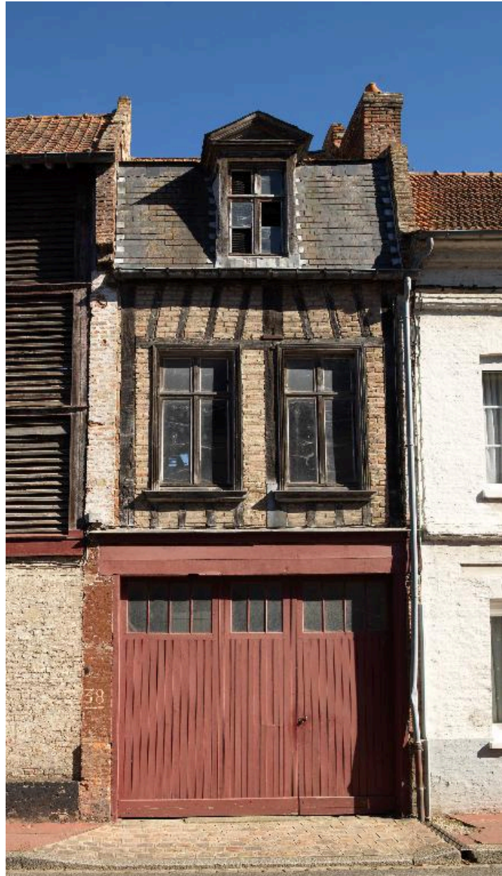
Façade du bâtiment abritant des magasins au sud.