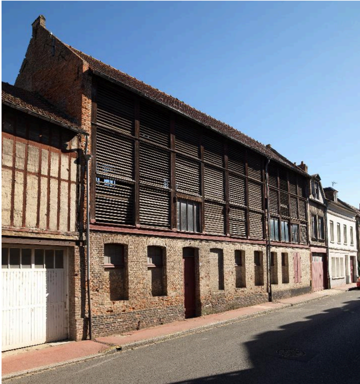
Façades donnant sur la chaussée d'Hoquet.