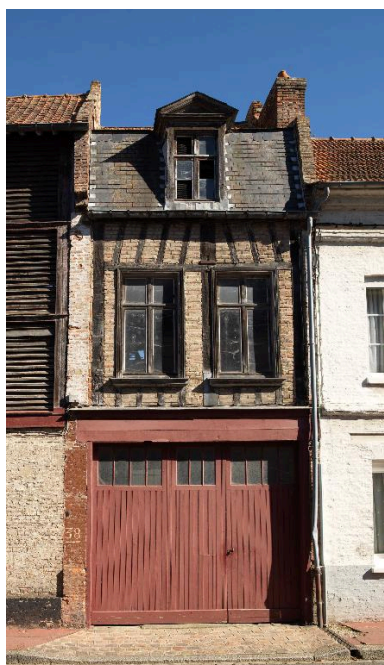
Façade du bâtiment abritant des magasins au sud. IVR22_20168000561NUC2A