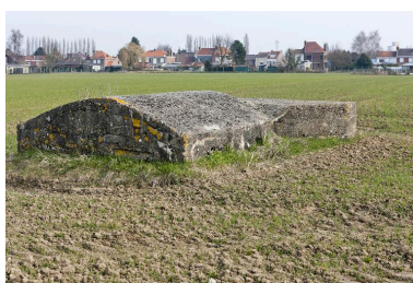
Vue vers le nord-est. Casemate a