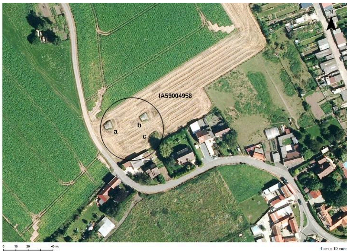
Situation des 3 casemates sur une photographie aérienne de 2014.