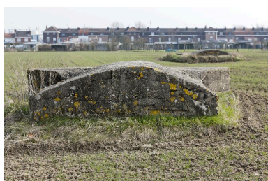
Vue vers le nord-est. D'avant en arrière : casemates a et b