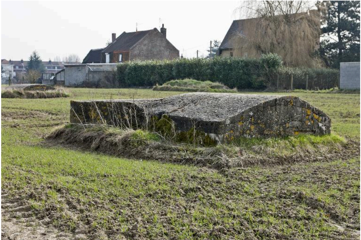
Vue des 3 casemates, vers l'est. Casemate a au premier plan, b à gauche, c à droite