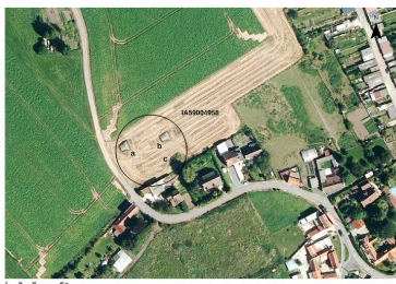
Situation des 3 casemates sur une photographie aérienne de 2014.