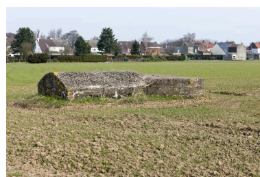
Vue vers le nord de la casemate a IVR31_20145905575NUCA