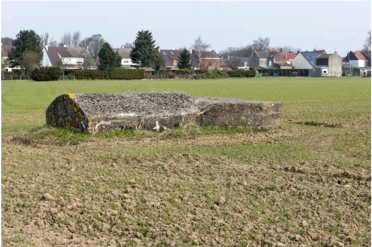
Vue vers le nord de la casemate a