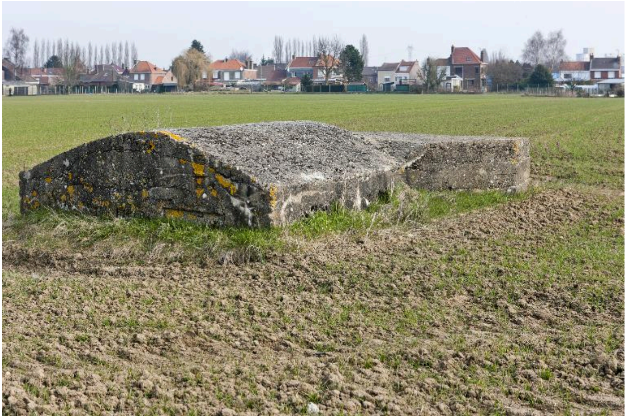
Vue vers le nord-est. Casemate a