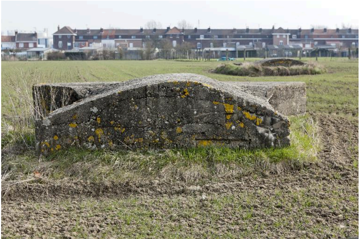
Vue vers le nord-est. D'avant en arrière : casemates a et b