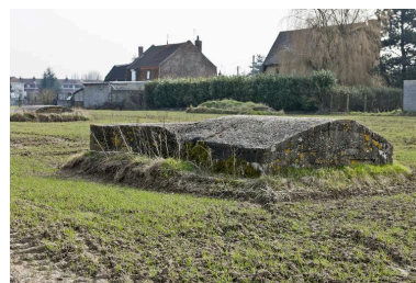
Vue des 3 casemates, vers l'est. Casemate a au premier plan, b à gauche, c à droite IVR31_20145905572NUCA