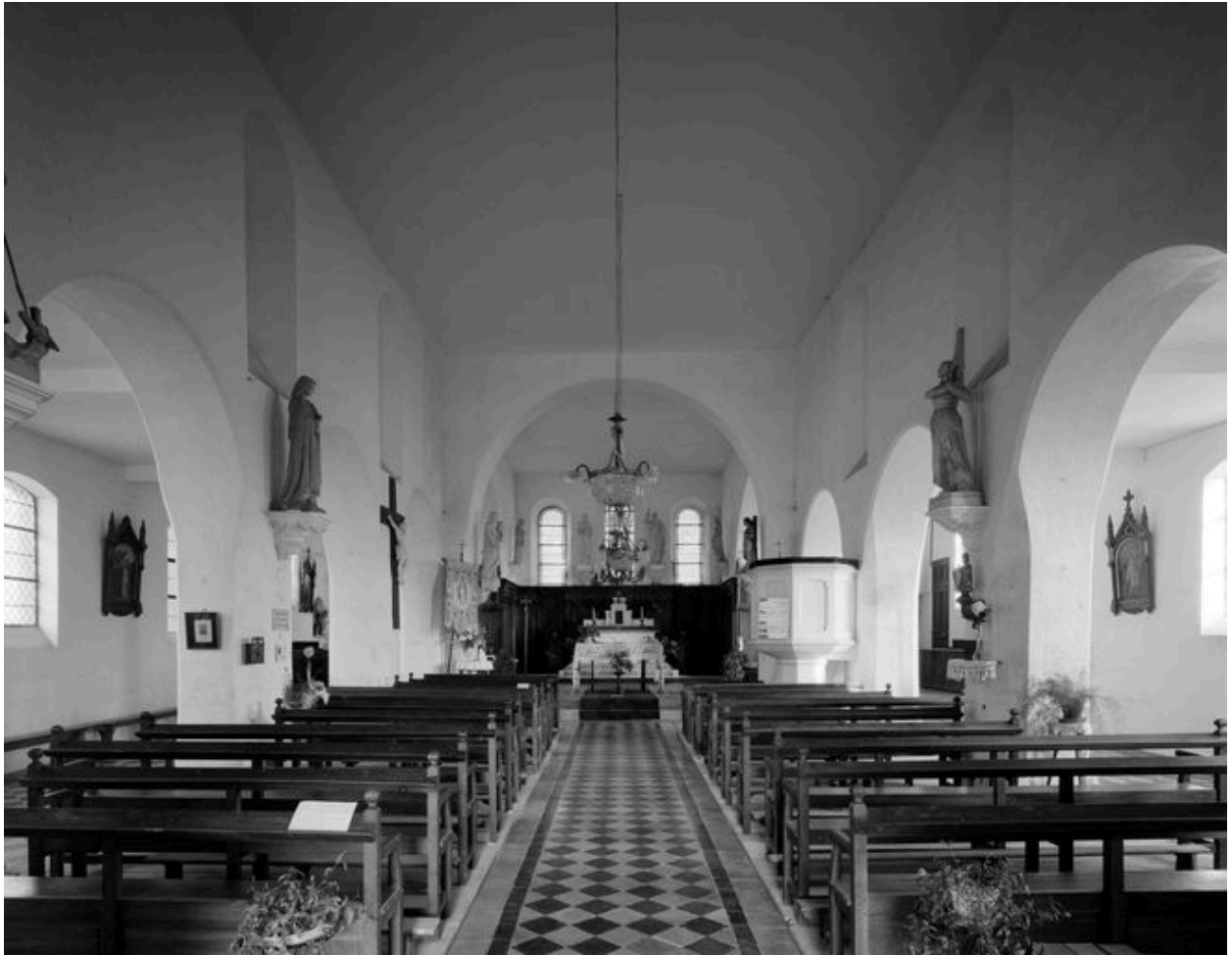
Vue intérieure vers le choeur.