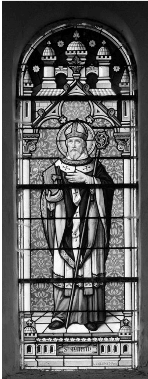
Verrière (baie 0) : saint Martin, par Collinet, vers 1925.