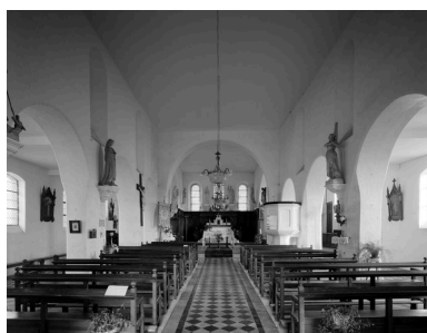
Vue intérieure vers le choeur. IVR22_19846001211V