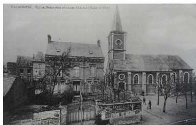
Église, presbytère et ancien château d'Escarbotin, début du 20e siècle (coll. part.).

Phot. Frédéric-Nicolas Kocourek (reproduction) IVR22_20158006398NUCA