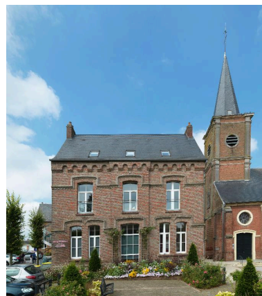
Vue générale. IVR22_20148000487NUC2AQ

IVR22_20148000495NUC2AQ