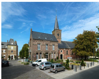
Vue d'ensemble du presbytère, de l'église et du château d'Escarbotin depuis la rue Henri-Barbusse.

Phot. Frédéric-Nicolas Kocourek (reproduction) IVR22_20158006398NUCA