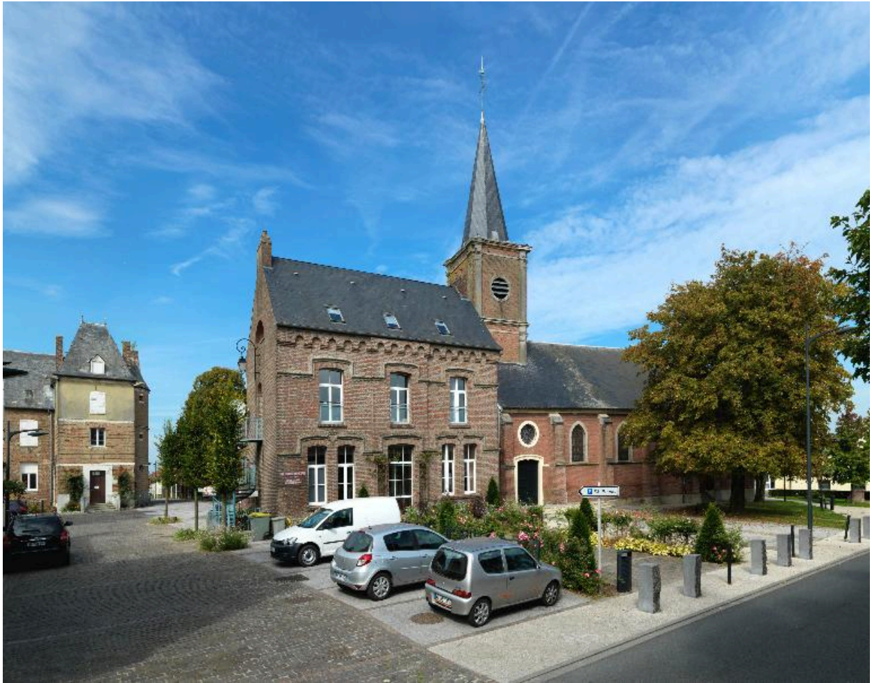
Vue d'ensemble du presbytère, de l'église et du château d'Escarbotin depuis la rue Henri-Barbusse.