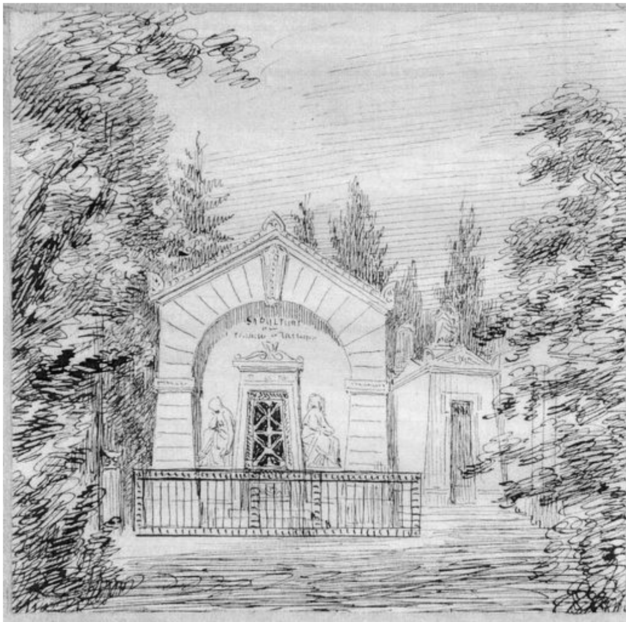
Le tombeau Tattegrain-Delabarthe au cimetière de la Madeleine, dessin des frères Duthoit, vers 1850 (Musée de Picardie, Amiens ; MP Duthoit).