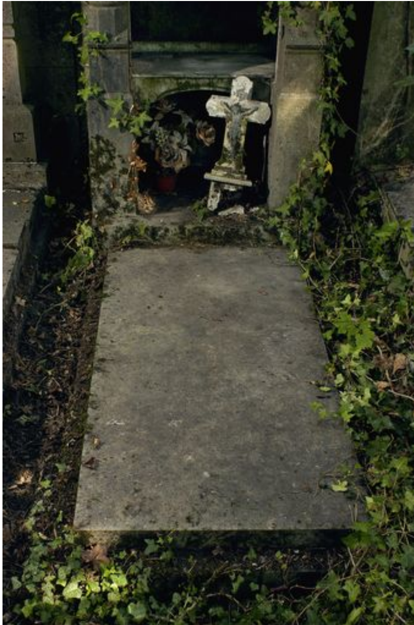
Vue de la tombale.