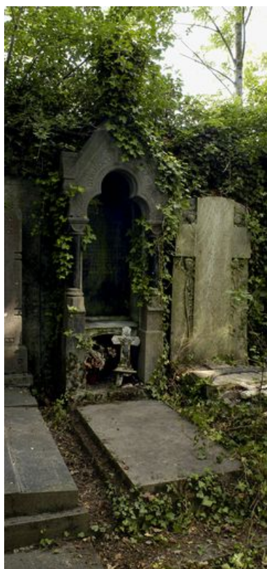
Vue générale. IVR22_20058001237NUCA