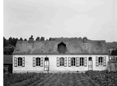
Elévation postérieure. IVR22_19846001112V