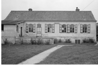
Elévation antérieure. IVR22_19846001060X