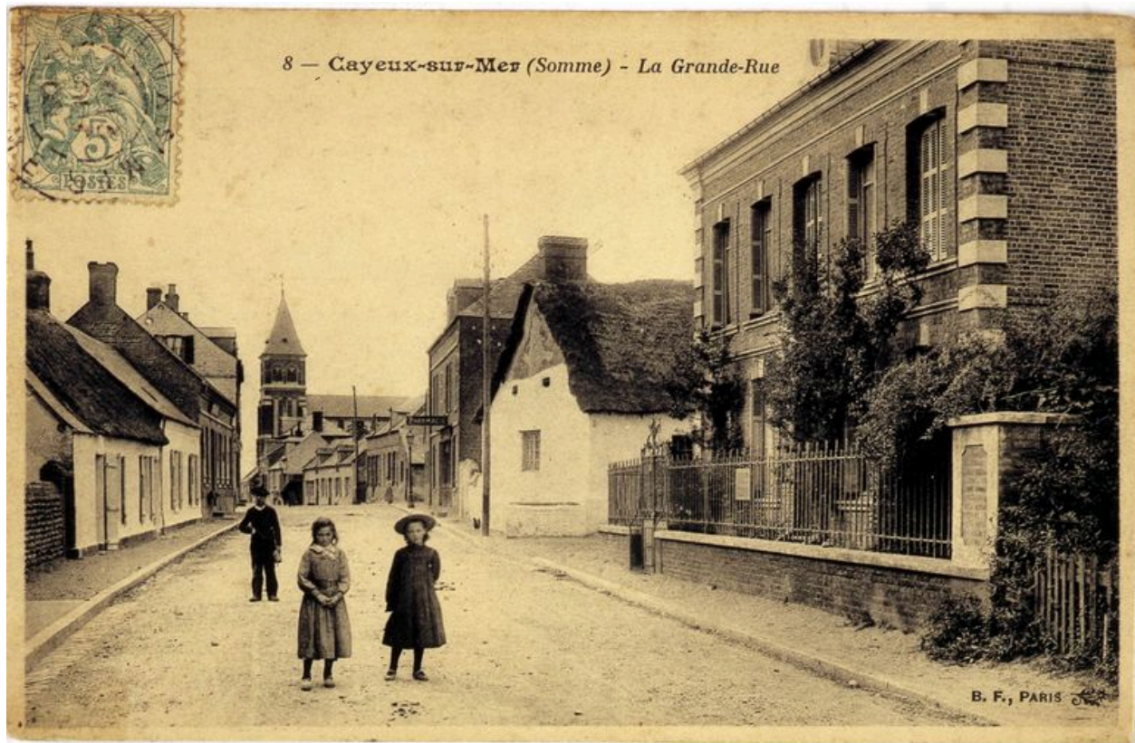
Une vue du quartier du Bout-d'Aval, à droite, carte postale, 1er quart 20e siècle (coll. part.).