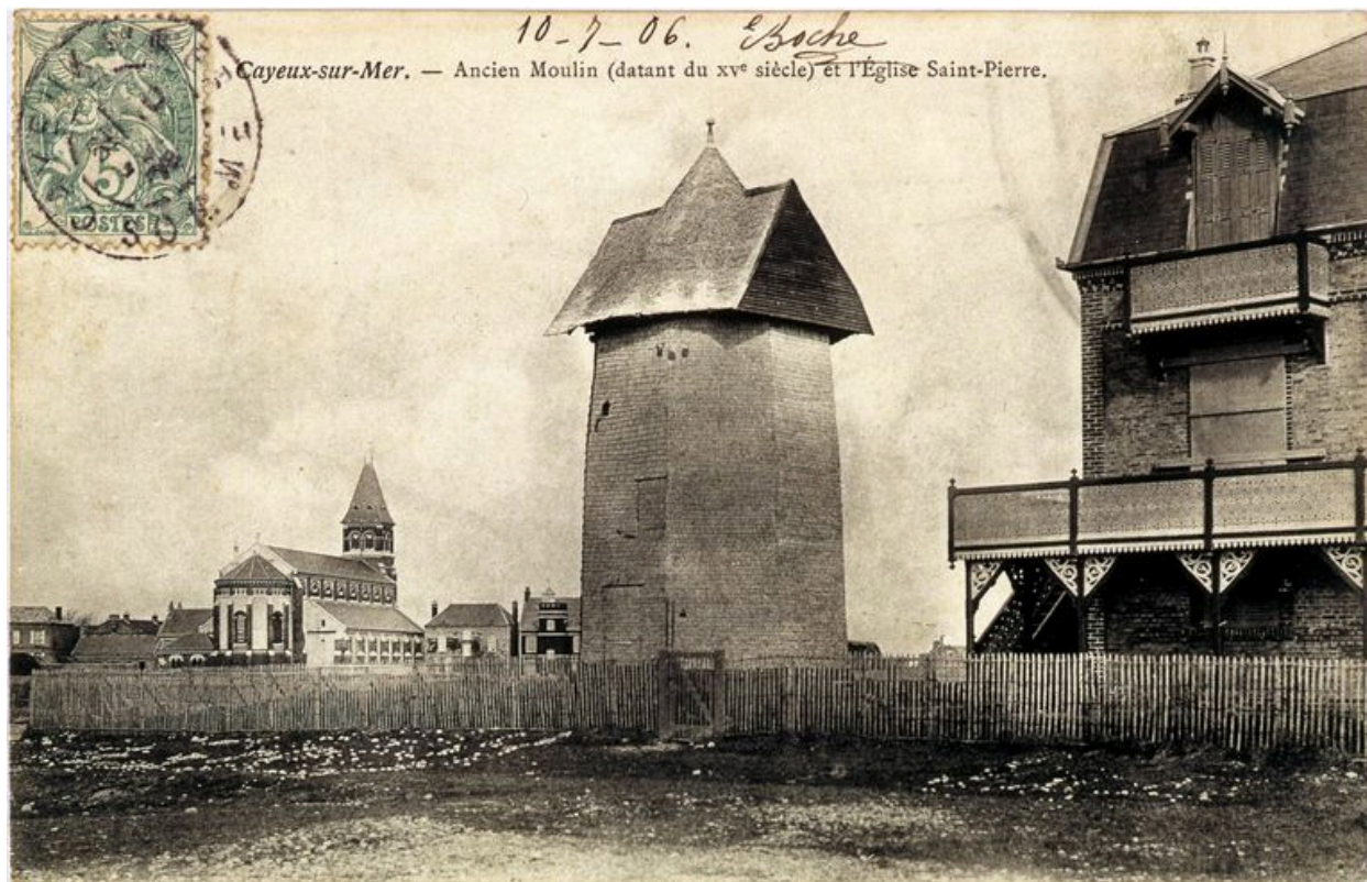
Un ancien moulin (détruit), près d'une villa, carte postale, 1er quart 20e siècle.