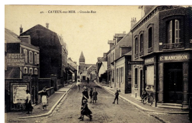
Le quartier du Bout-d'Aval, à droite, carte postale, 1er quart 20e siècle (coll. part.).

Phot. Monnehay-Vulliet Marie-Laure IVR22_20058000420XAB