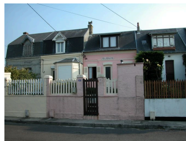
Maisons, rue Florent-Triquet (n°17 à 23).

Phot. Elisabeth Justome IVR22_20058003120NUCA