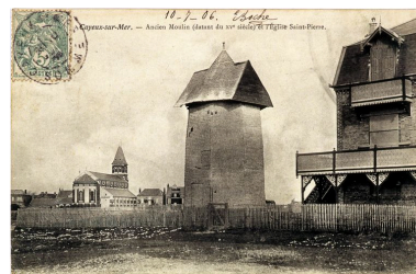
Un ancien moulin (détruit), près d'une villa, carte postale, 1er quart 20e siècle (coll. part.).

Phot. Monnehay-Vulliet Marie-Laure IVR22_20058000410XAB