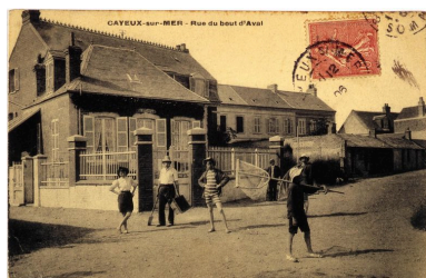
Maison dite les Lierres, carte postale, 1er quart 20e siècle (coll. part.).

Phot. Monnehay-Vulliet Marie-Laure IVR22_20058000414XAB