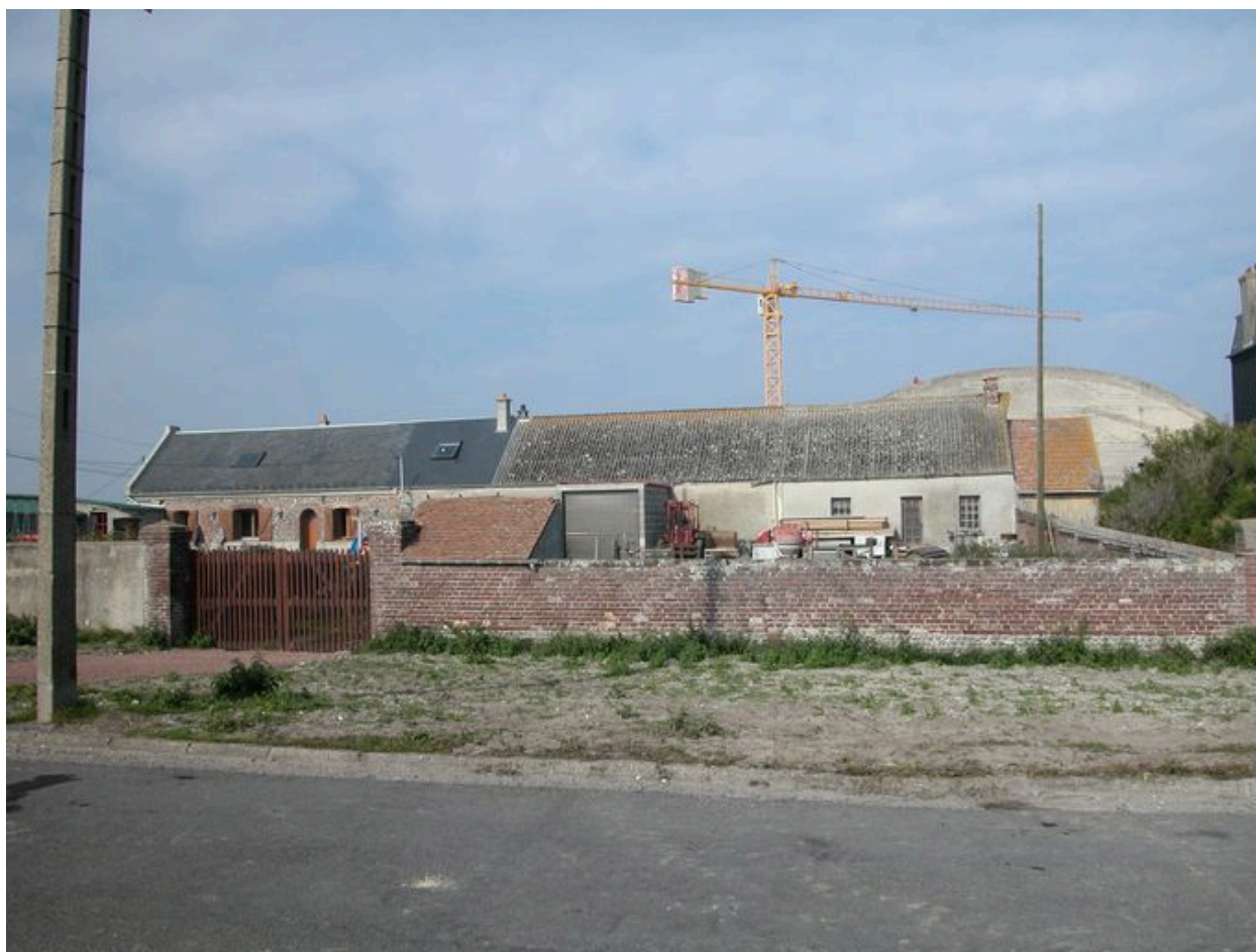
Bâti ancien proche de la plage, 52 rue Florent-Triquet (1988 AY 238).