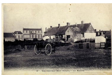
Une ferme ancienne, carte postale, 1er quart 20e siècle (coll. part.).

Phot. Monnehay-Vulliet Marie-Laure IVR22_20058000402XAB