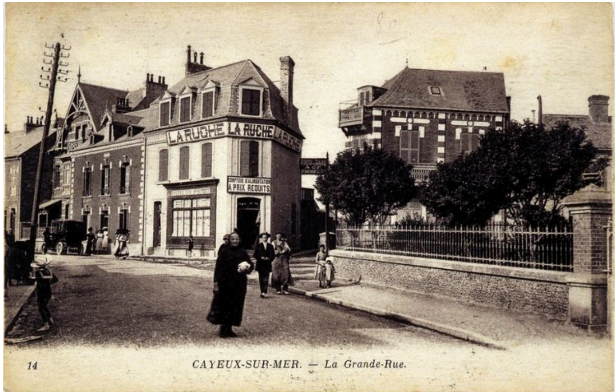
L'entrée du quartier du Bout-d'Aval, à droite, carte postale, 1er quart 20e siècle.