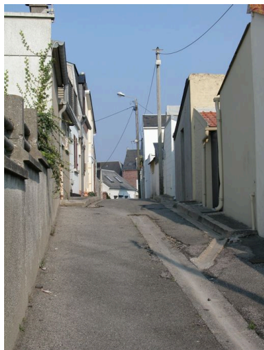
La rue du Bout-d'Aval.