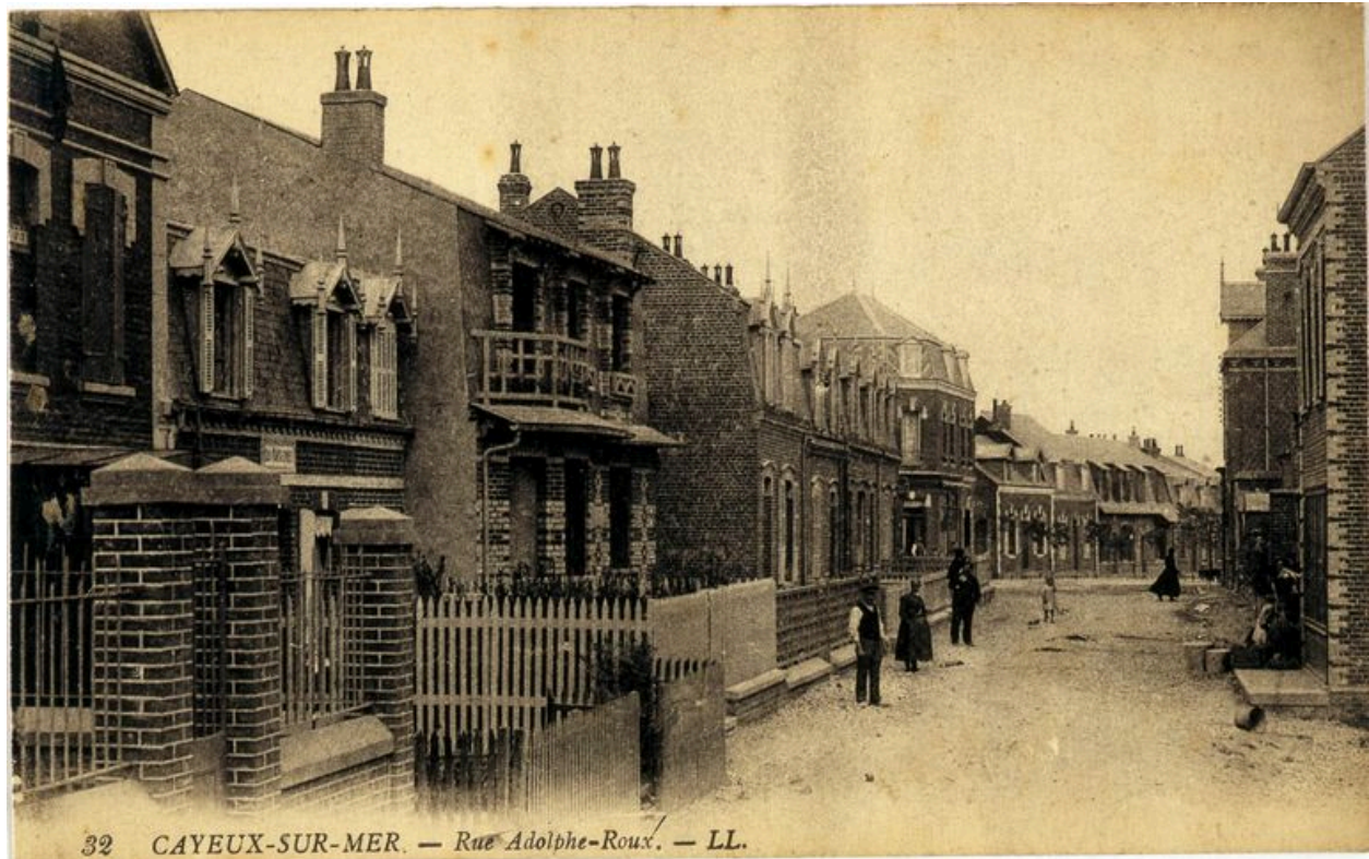
L'actuelle rue Adolphe Roux, carte postale, 1er quart 20e siècle (coll. part.).