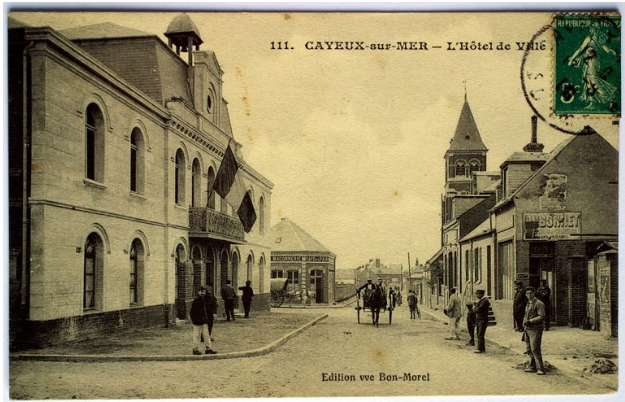
La rue du Maréchal-Foch au niveau de la mairie, carte postale, 1er quart 20e siècle (coll. part.).