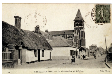
Le quartier du Bout-d'Aval, à gauche, carte postale, 1er quart 20e siècle (coll. part.).

Phot. Monnehay-Vulliet Marie-Laure IVR22_20058000403XAB