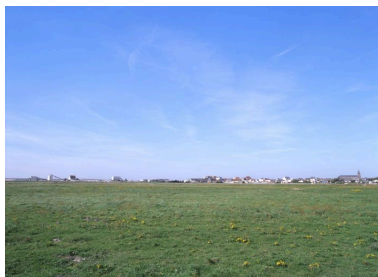
Vue d'ensemble vers le nord-ouest, depuis la rue d'Enfer. IVR22_20048000333XA