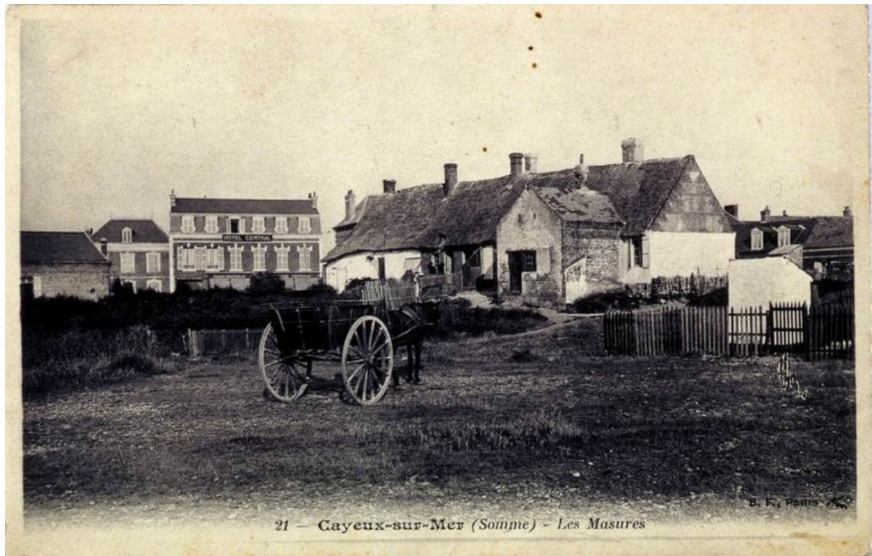
Une ferme ancienne, carte postale, 1er quart 20e siècle.