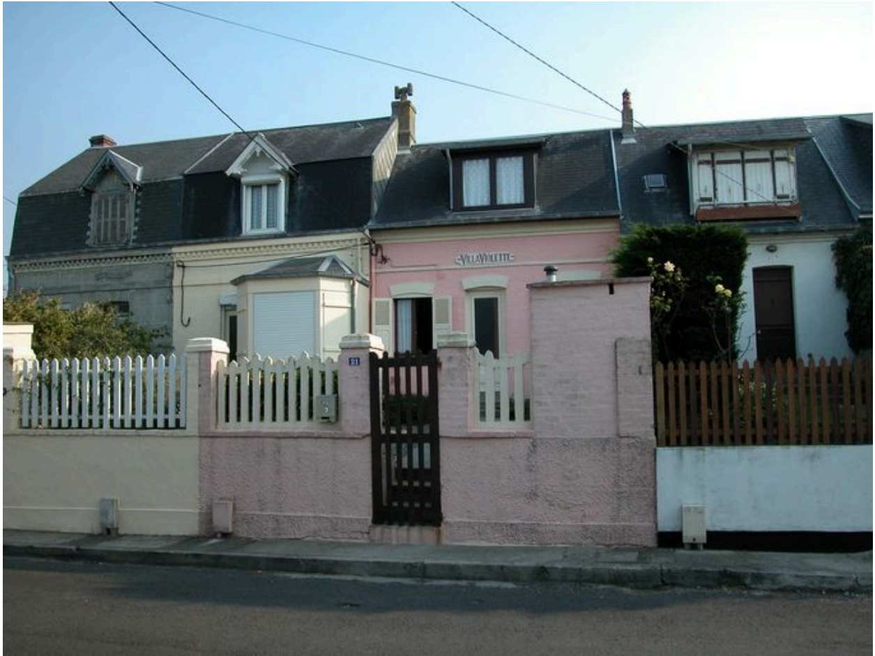
Maisons, rue Florent-Triquet (n°17 à 23).