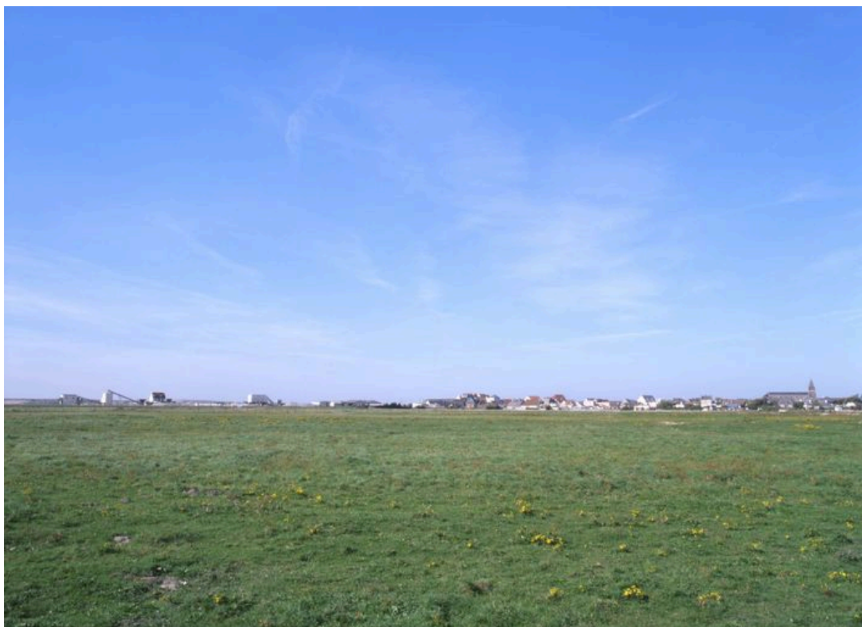
Vue d'ensemble vers le nord-ouest, depuis la rue d'Enfer.