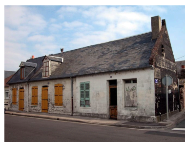
Maisons anciennes destinées à la location (rue du Maréchal-Foch), le n°120 portant une plaque émaillée 'eau de source...' et le n°122 portant l'appellation 'Ker Joseph'.

IVR22_20058000411XAB