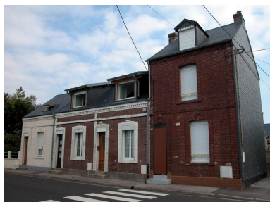
Ensemble de maisons (108 à 114 rue du Maréchal-Foch) portant une plaque émaillée 'eau de source...'.

IVR22_20058003130NUCA