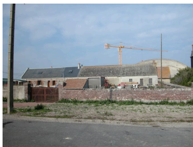
Bâti ancien proche de la plage, 52 rue Florent-Triquet (1988 AY 238).

IVR22_20058003129NUCA