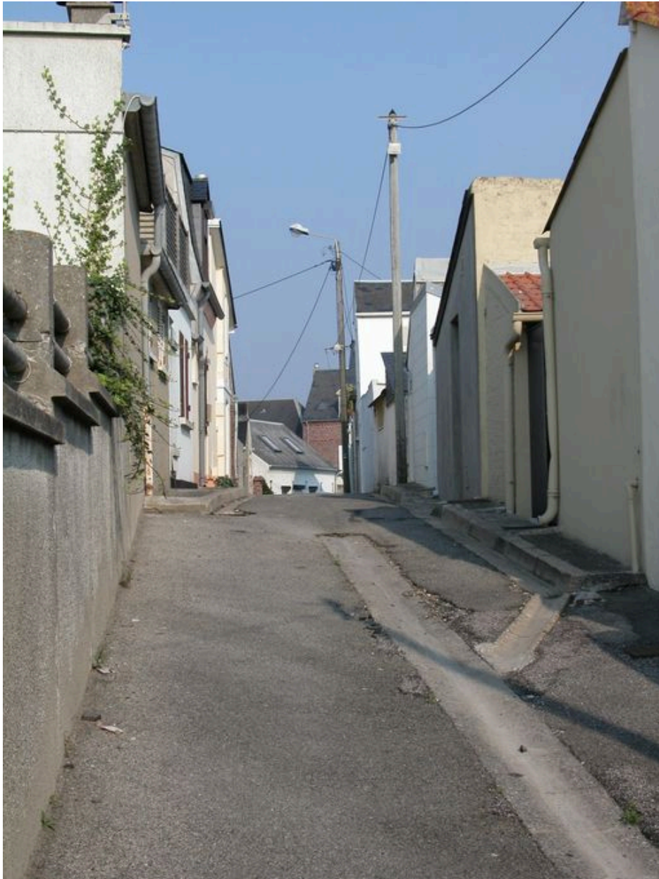
La rue du Bout-d'Aval.