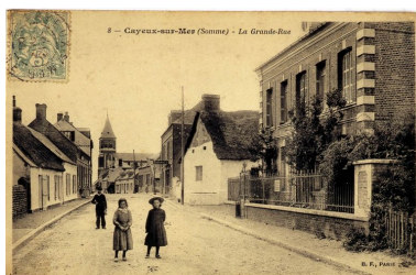
Une vue du quartier du Bout-d'Aval, à droite, carte postale, 1er quart 20e siècle (coll. part.).

Phot. Monnehay-Vulliet Marie-Laure IVR22_20058000407XAB