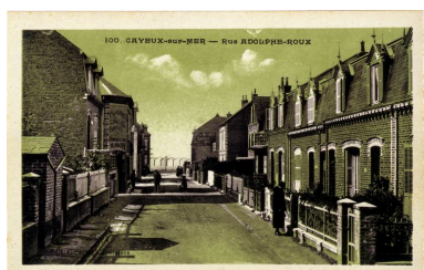
La rue Adolphe-Roux, vue vers la mer, carte postale, 1er quart 20e siècle (coll. part.).

Phot. Monnehay-Vulliet Marie-Laure IVR22_20058000418XAB