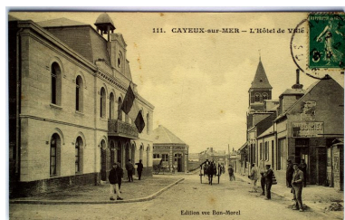
La rue du Maréchal-Foch au niveau de la mairie, carte postale, 1er quart 20e siècle (coll. part.). IVR22_20038000555NUCAB