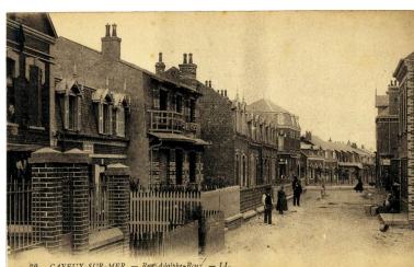
L'actuelle rue Adolphe Roux, carte postale, 1er quart 20e siècle (coll. part.).

Phot. Monnehay-Vulliet Marie-Laure IVR22_20058000418XAB