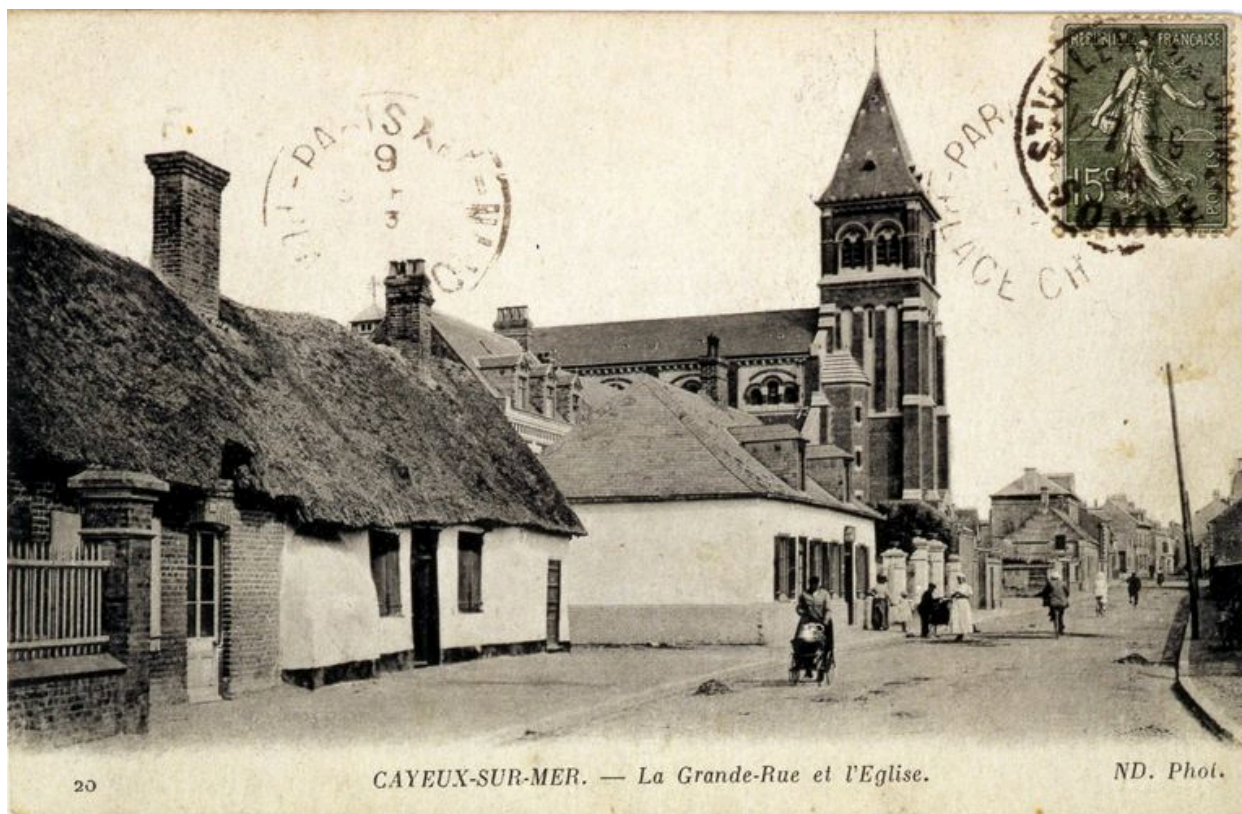
Le quartier du Bout-d'Aval, à gauche, carte postale, 1er quart 20e siècle.