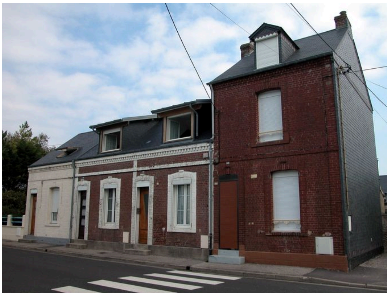
Ensemble de maisons (108 à 114 rue du Maréchal-Foch) portant une plaque émaillée 'eau de source...!'.