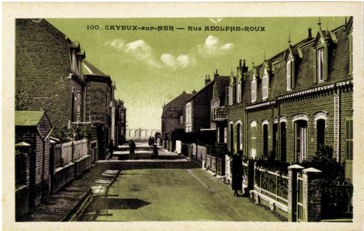
La rue Adolphe-Roux, vue vers la mer, carte postale, 1er quart 20e siècle (coll. part.).