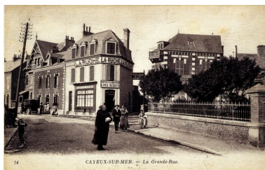
L'entrée du quartier du Bout-d'Aval, à droite, carte postale, 1er quart 20e siècle (coll. part.). IVR22_20058000421XAB