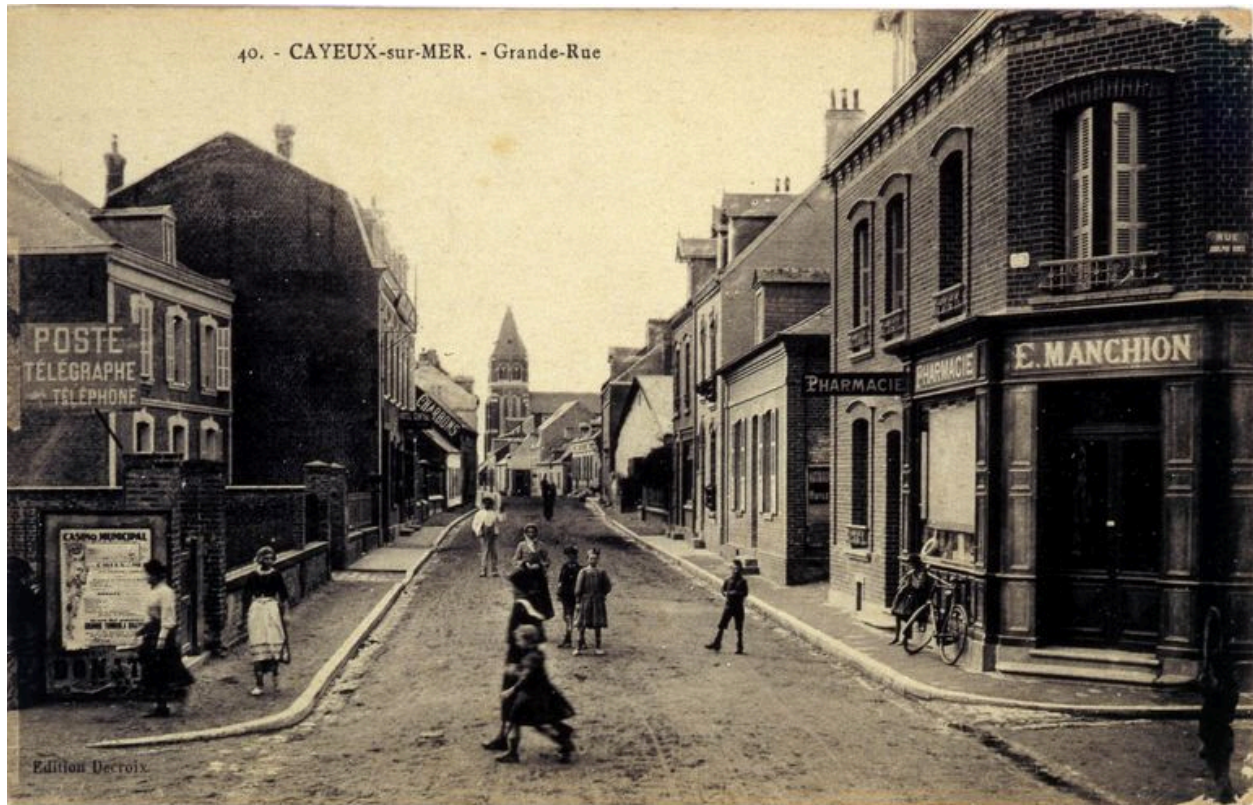
Le quartier du Bout-d'Aval, à droite, carte postale, 1er quart 20e siècle (coll. part.).