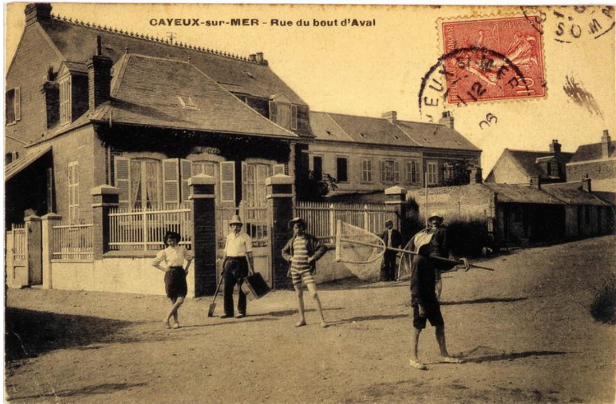
Maison dite les Lierres, carte postale, 1er quart 20e siècle (coll. part.).