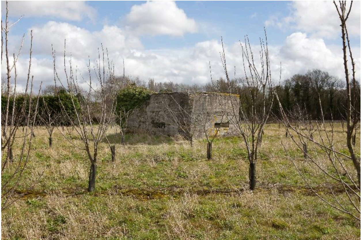
Vue vers le sud-est