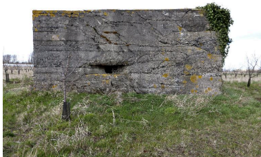
Vue vers le nord IVR31_20145904266NUCA