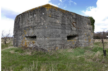
Vue vers le nord-est