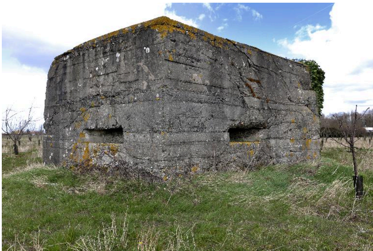
Vue vers le nord-est