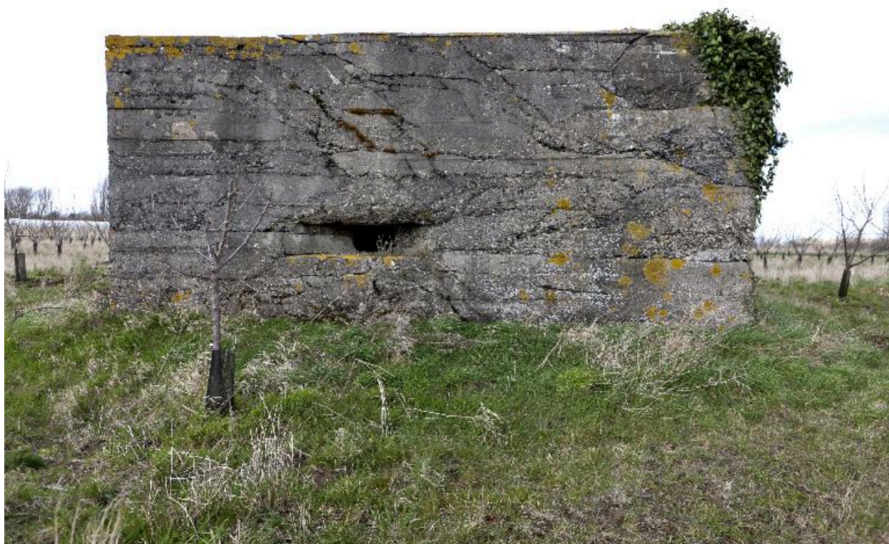
Vue vers le nord