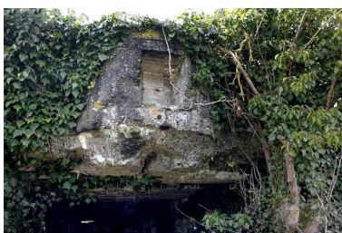
plateforme d'artillerie