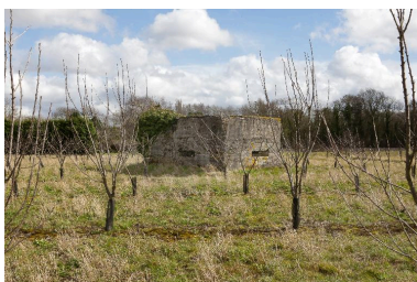
Vue vers le sud-est IVR31_20145904278NUCA