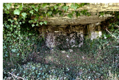
Vue intérieure