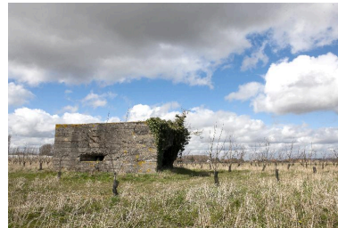
Vue vers le nord-ouest IVR31_20145904276NUCA