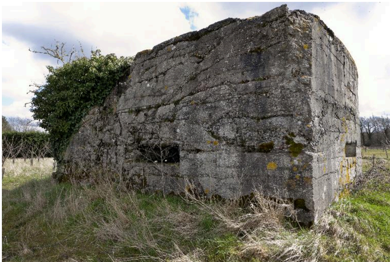
Vue vers le sud-est