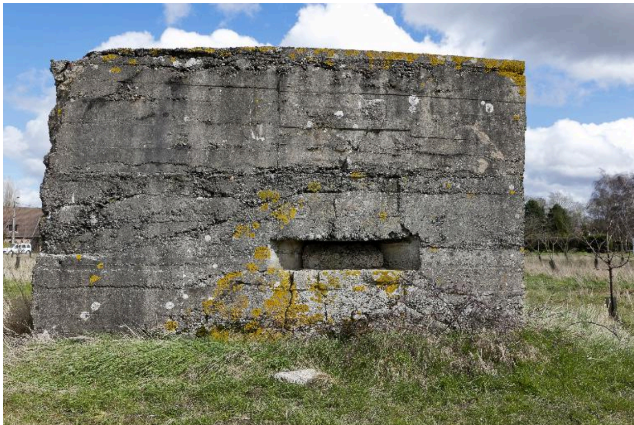
Vue vers l'est