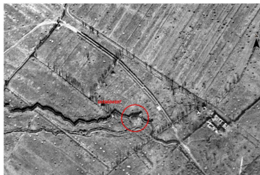
Situation de l'édifice (cercle rouge) sur une photographie aérienne britannique du 10/02/1918. IVR32_20175900086NUCA