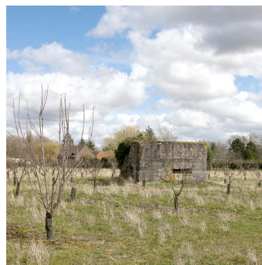
Vue vers le sud-ouest IVR31_20145904277NUCA