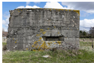
Vue vers l'est