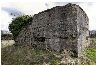
Vue vers le sud-est IVR31_20145904270NUCA