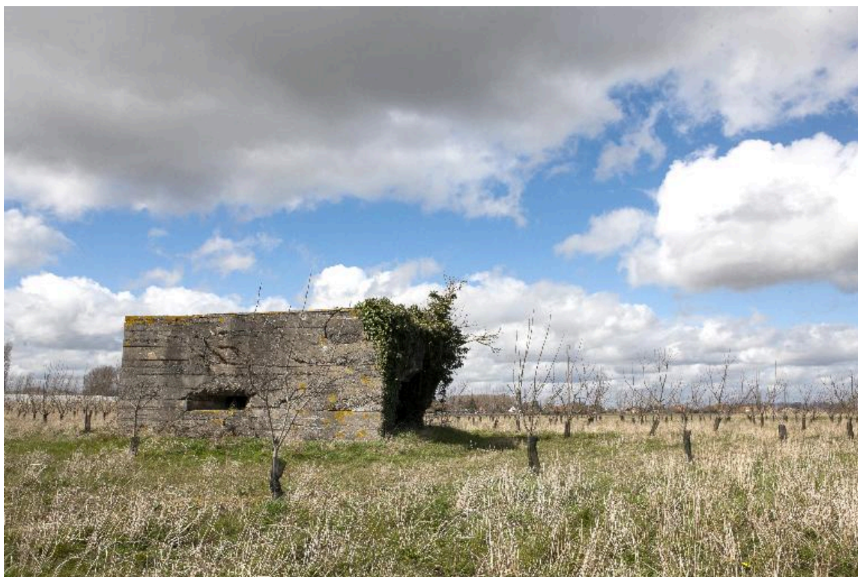
Vue vers le nord-ouest