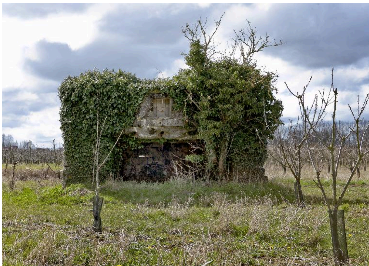
Elévation antérieure, vers l'ouest