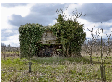
Elévation antérieure, vers l'ouest