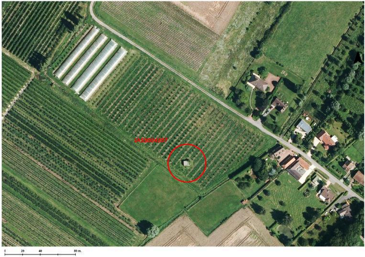
Situation de l'édifice (cercle rouge) sur une photographie aérienne de 2014.