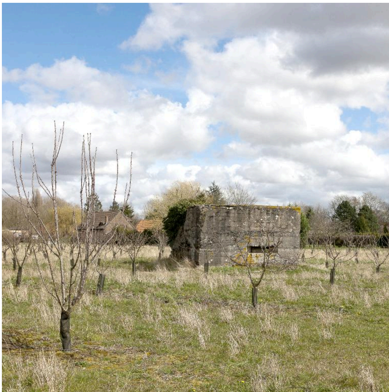
Vue vers le sud-ouest