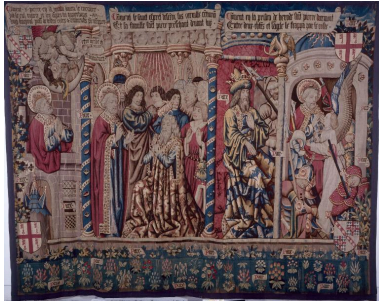
Vue d'ensemble. IVR22_19916000098VA