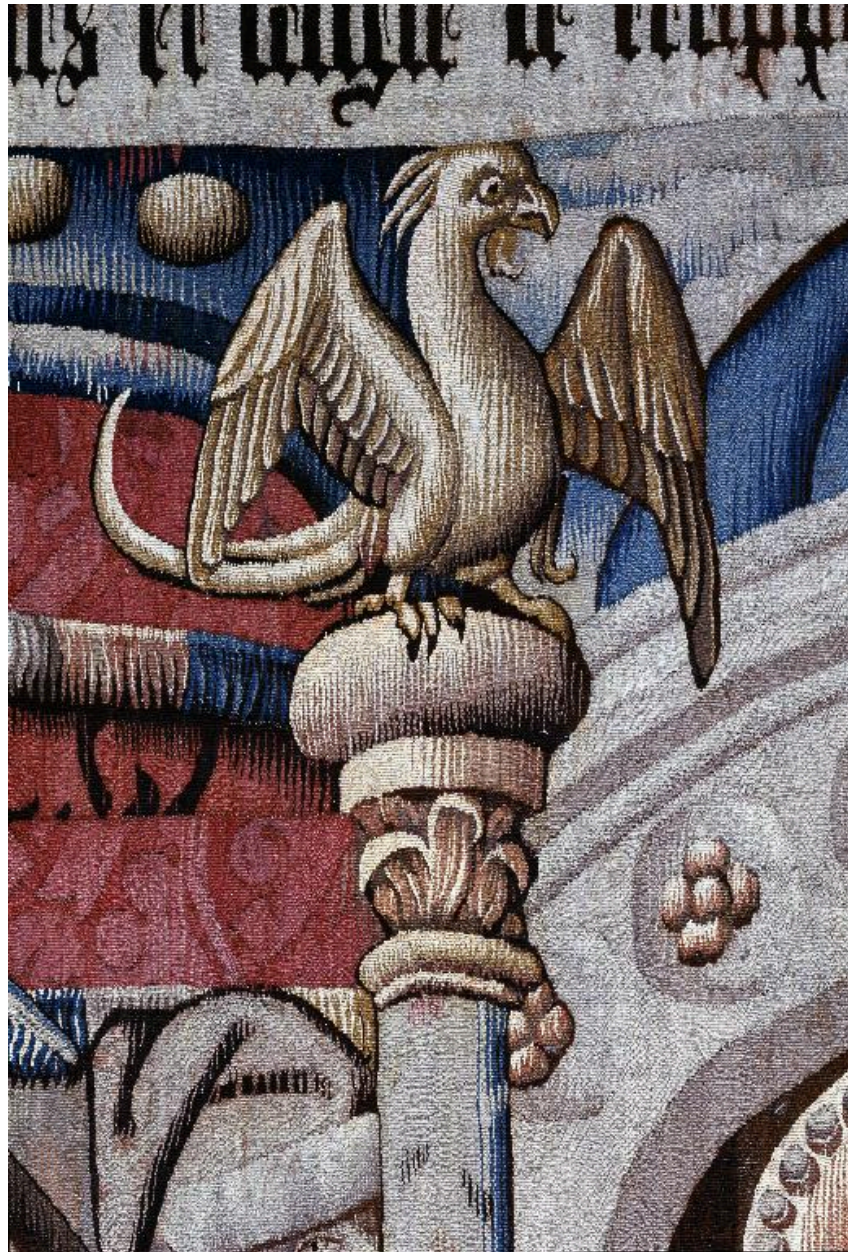
Vue de détail, scène de l'emprisonnement de saint Pierre : animal fabuleux.