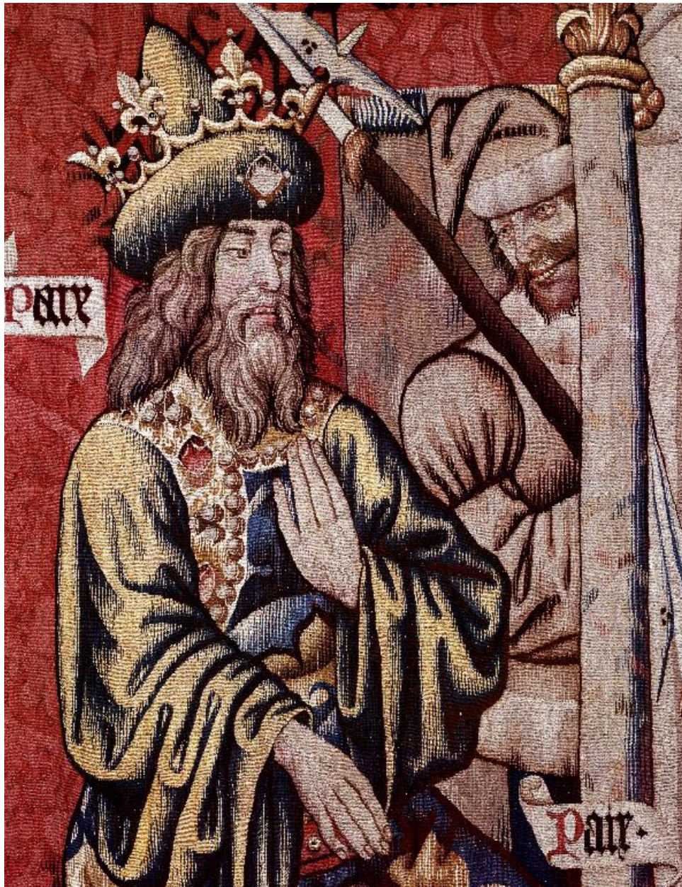
Vue de détail, scène de l'emprisonnement de saint Pierre : Hérode.