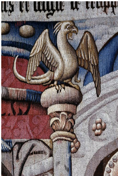
Vue de détail, scène de l'emprisonnement de saint Pierre : animal fabuleux. IVR22_19916000079XA