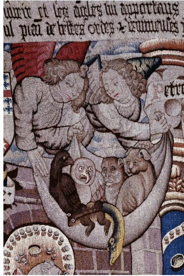
Vue de détail : les animaux impurs.