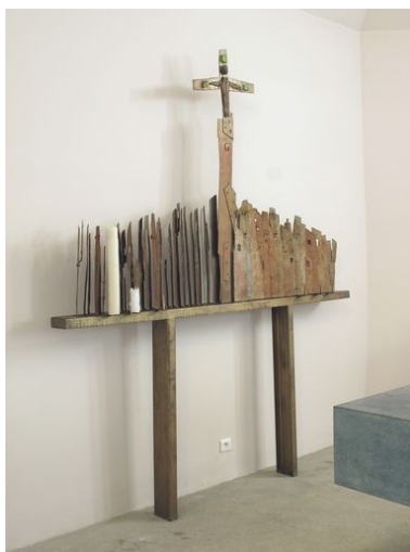
Vue latérale IVR31_20106203149NUCA