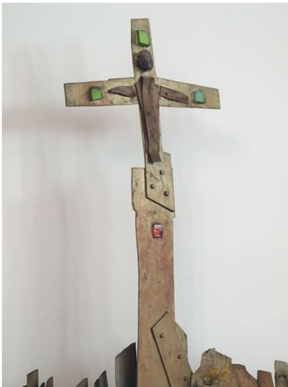
Vue de détail, Christ en croix