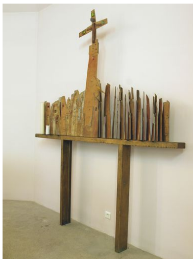
Vue latérale IVR31_20106203150NUCA