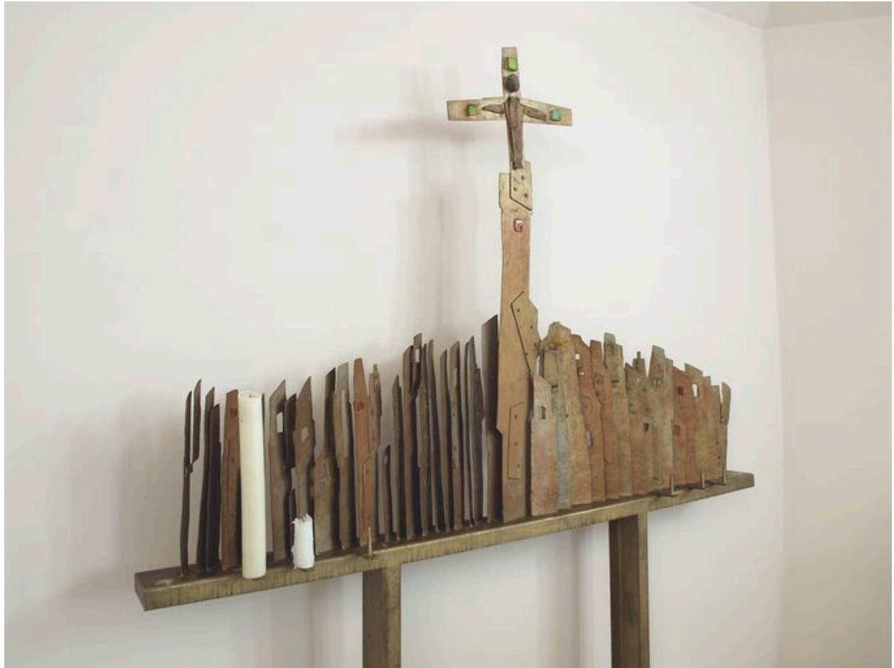
Vue partielle, partie supérieure