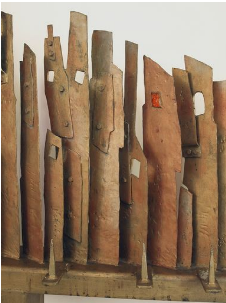
Vue de détail, porte-cierges