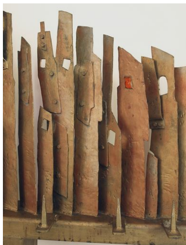
Vue de détail, porte-cierges IVR31_20106203153NUCA