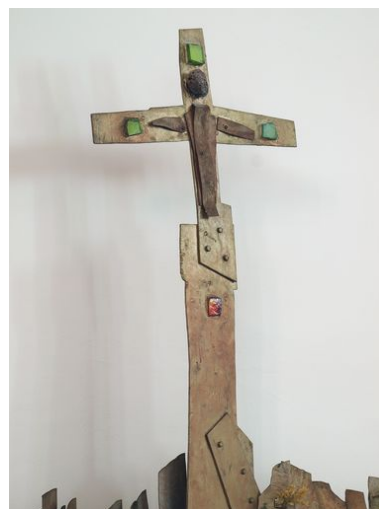
Vue de détail, Christ en croix