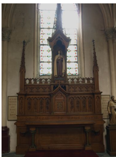
Vue générale IVR31_20106202762NUCA