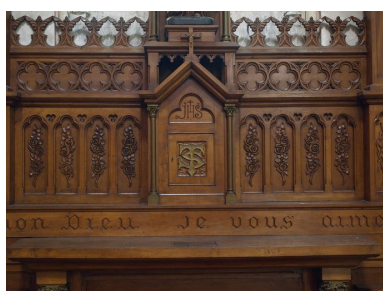
Retable et tabernacle