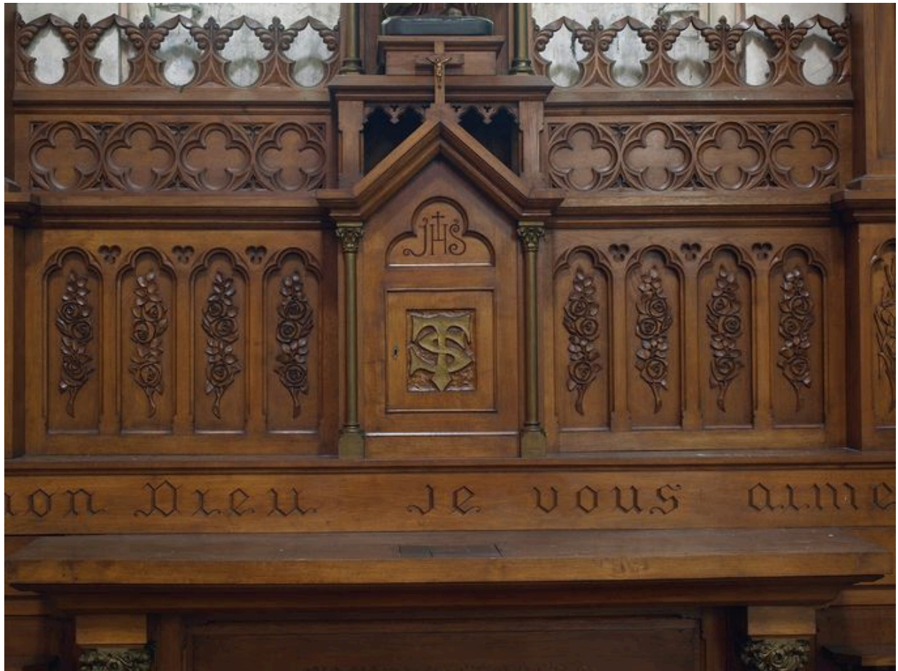
Retable et tabernacle