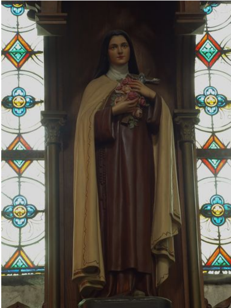
Moulage de sainte Thérèse