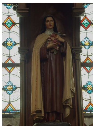
Moulage de sainte Thérèse