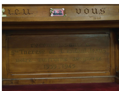
Inscription sous l'autel IVR31_20106202764NUCA