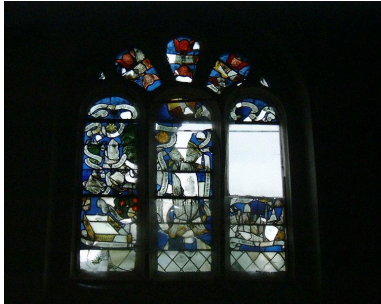
Vue générale. IVR22_20006001361NUC1A