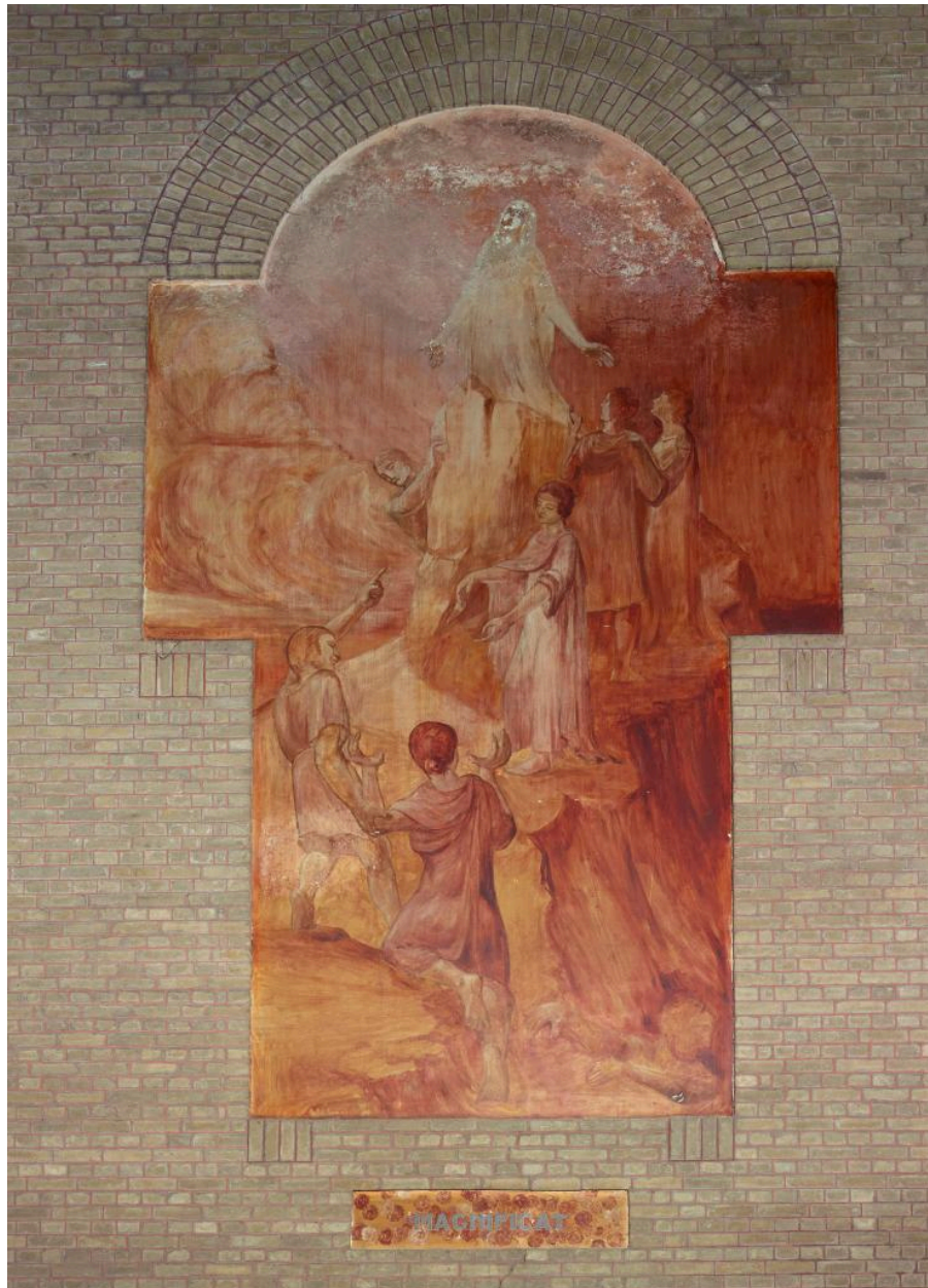
Vue de la peinture ouest : Magnificat.