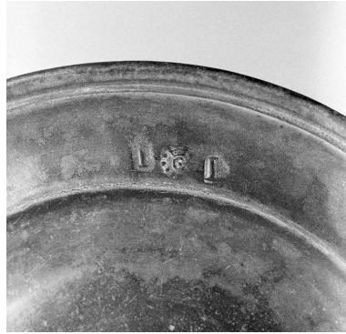
Détail du poinçon.