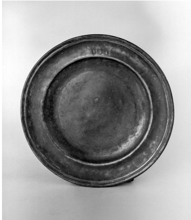
Vue d'ensemble. IVR22_19956000546X