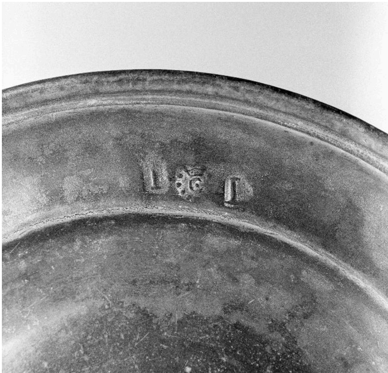
Détail du poinçon.