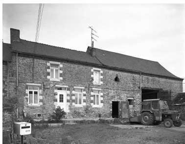
Vue générale. IVR31_20055904312V