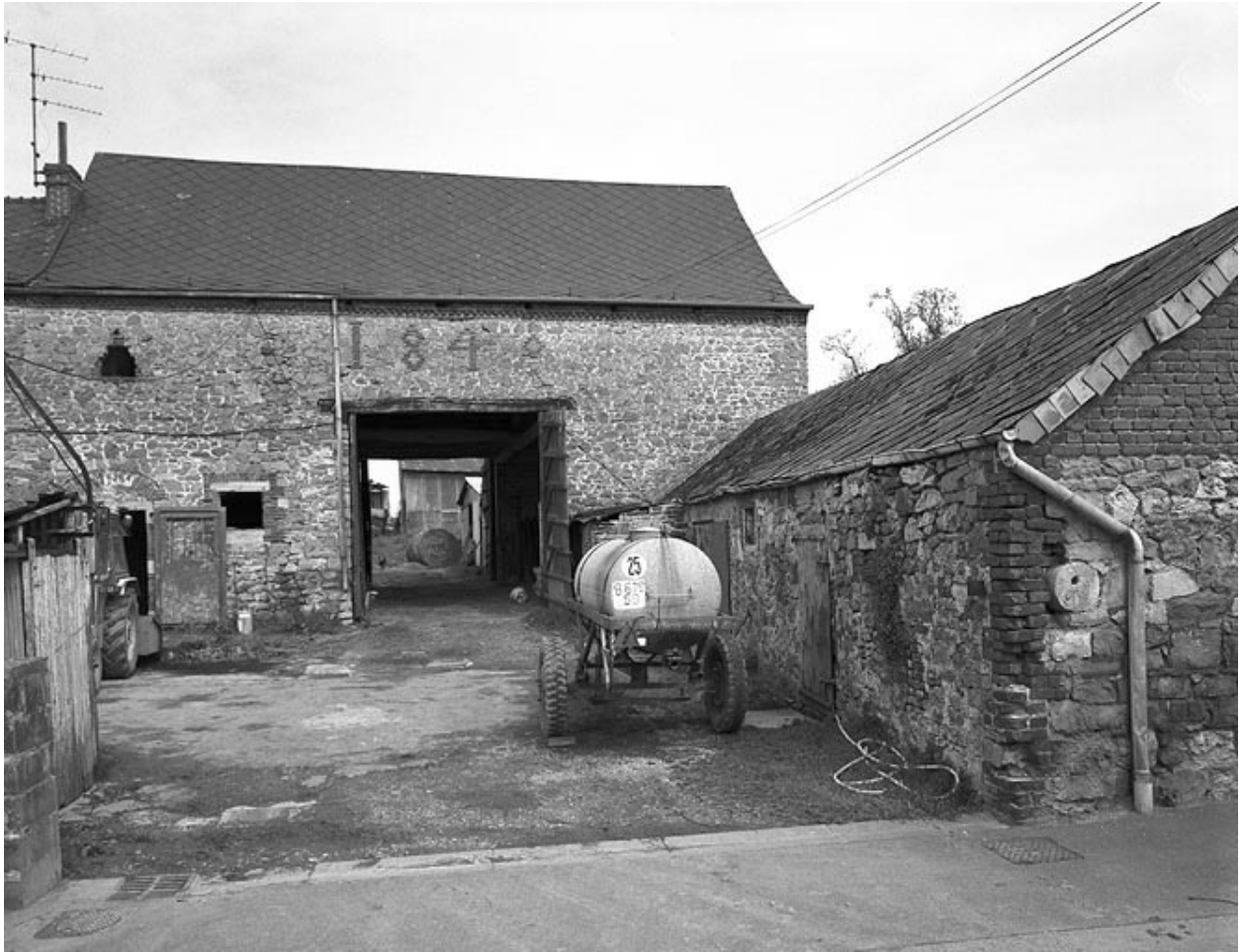
Vue de la grange et de la porcherie.