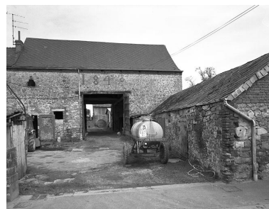
Vue de la grange et de la porcherie.