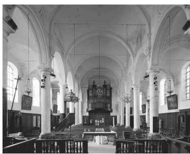
Vue générale intérieure vers l'entrée.