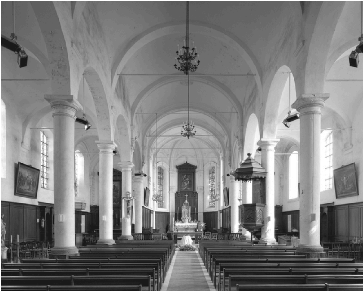
Vue générale intérieure vers le chœur.