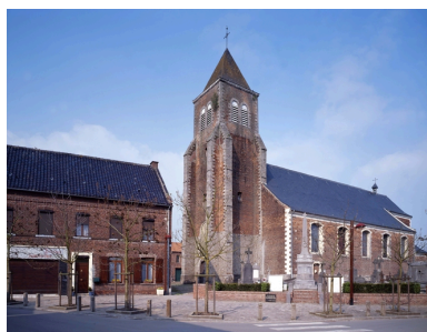
Vue générale depuis la rue de l'Eglise. IVR31_20095902063VA