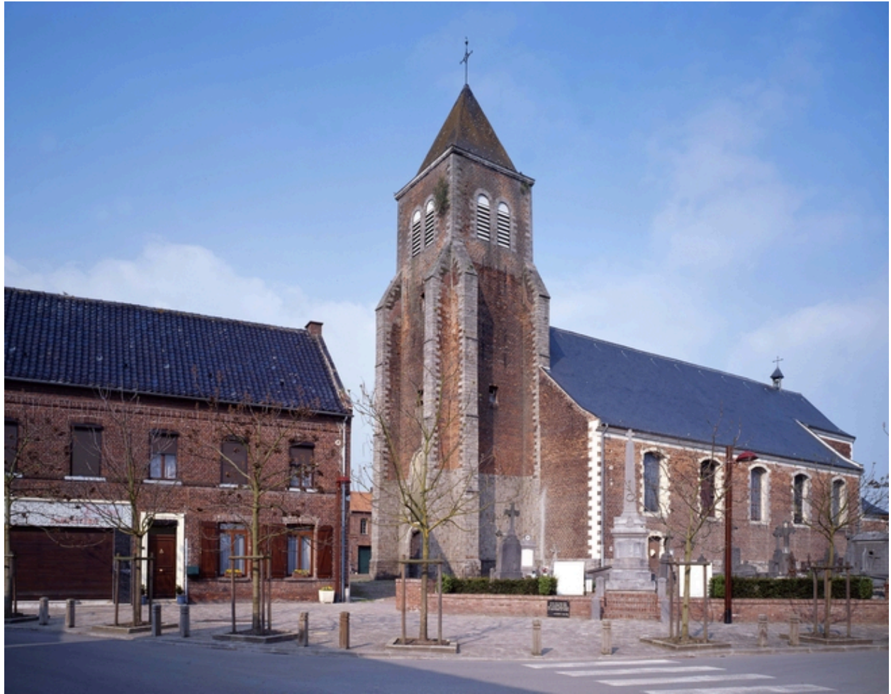
Vue générale depuis la rue de l'Eglise.