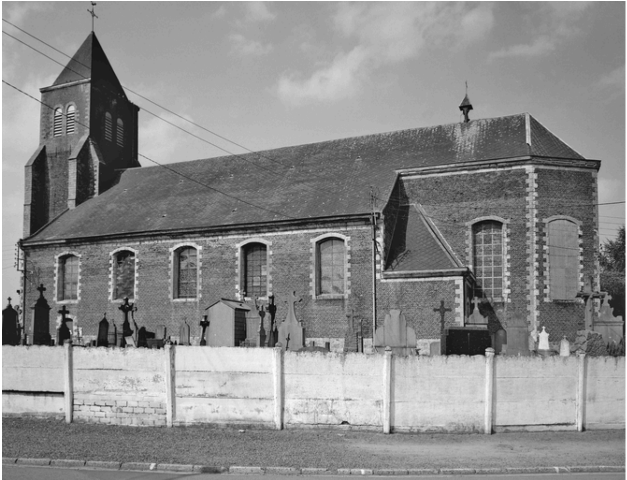
Vue générale de trois quarts, le cimetière au premier plan.