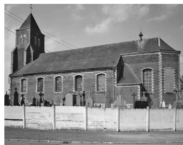
Vue générale de trois quarts, le cimetière au premier plan.