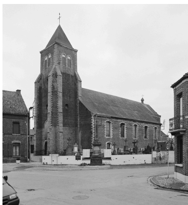
Vue générale de trois quarts, depuis la rue de la Place. IVR31_20045900073X