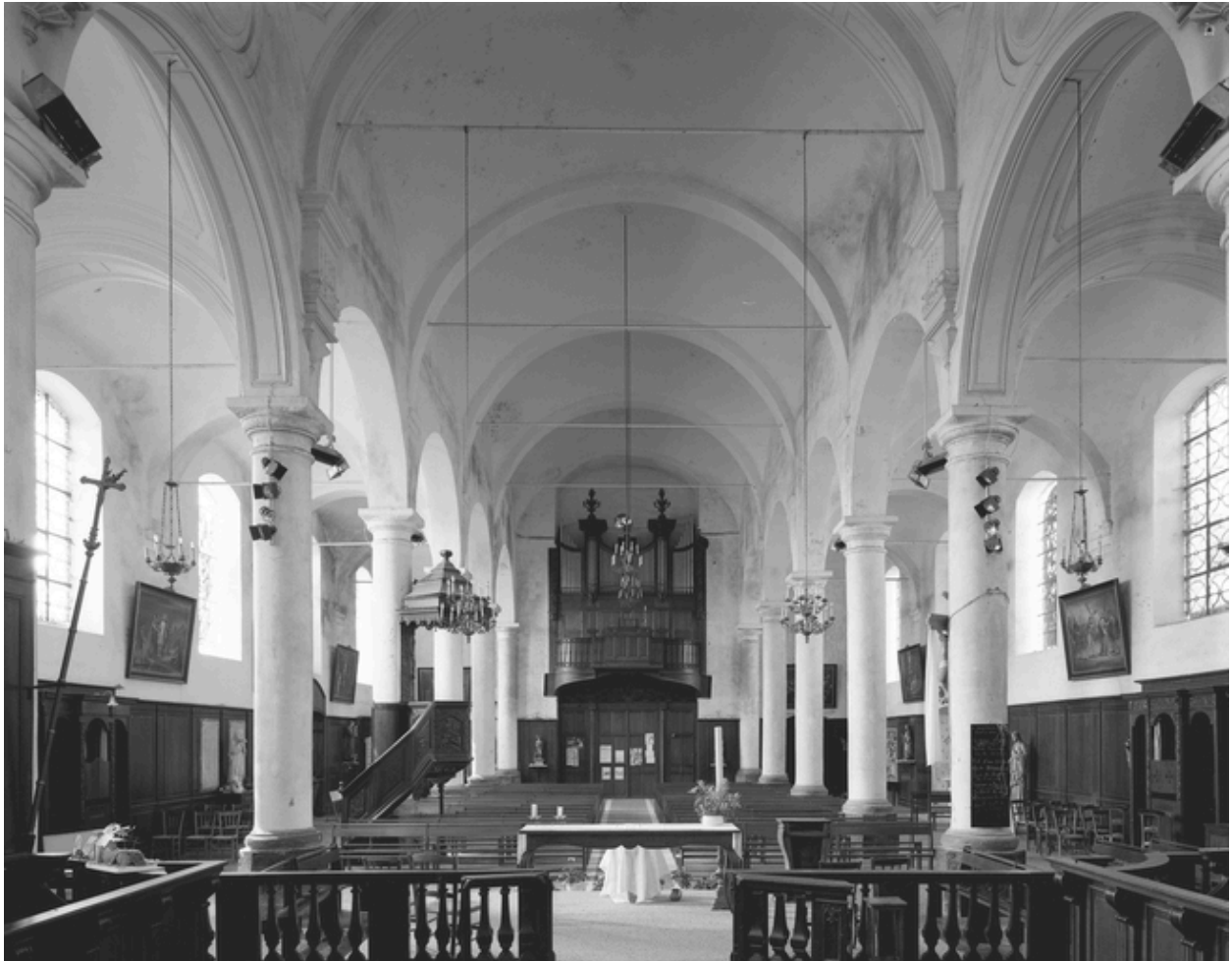
Vue générale intérieure vers l'entrée.