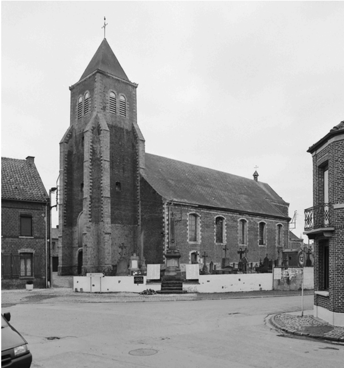
Vue générale de trois quarts, depuis la rue de la Place.