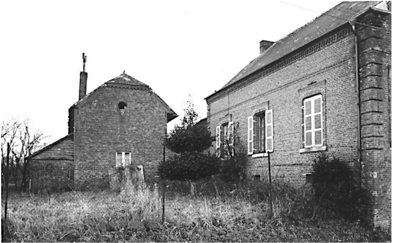
Elévation postérieure du logis.