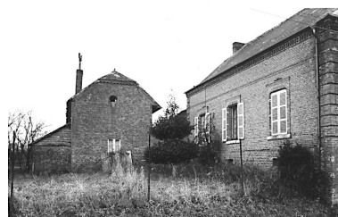
Élévation postérieure du logis. IVR22_19970202369Z