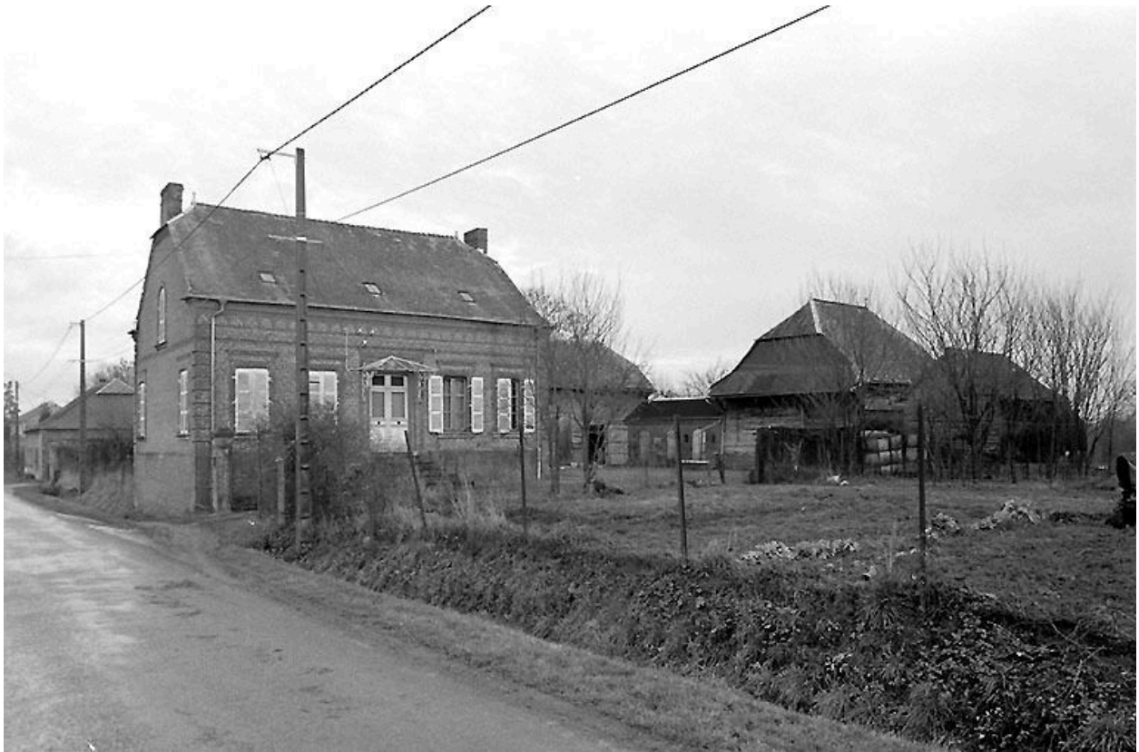
Vue générale de la ferme.