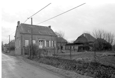
Vue générale de la ferme. IVR22_19970202387Z