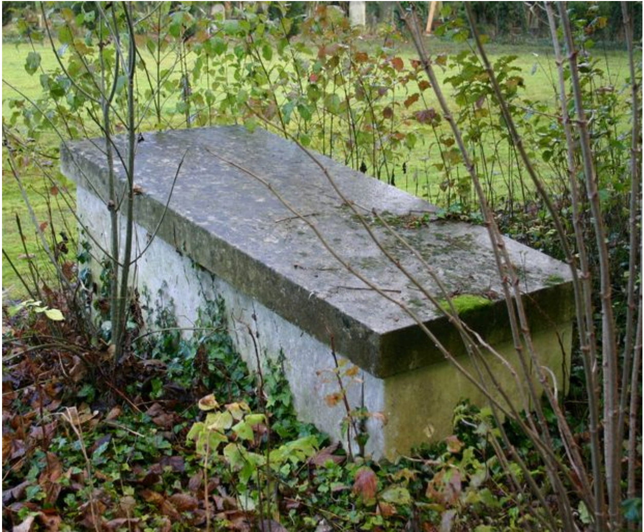
Tombeau en forme de sarcophage, côté gauche.