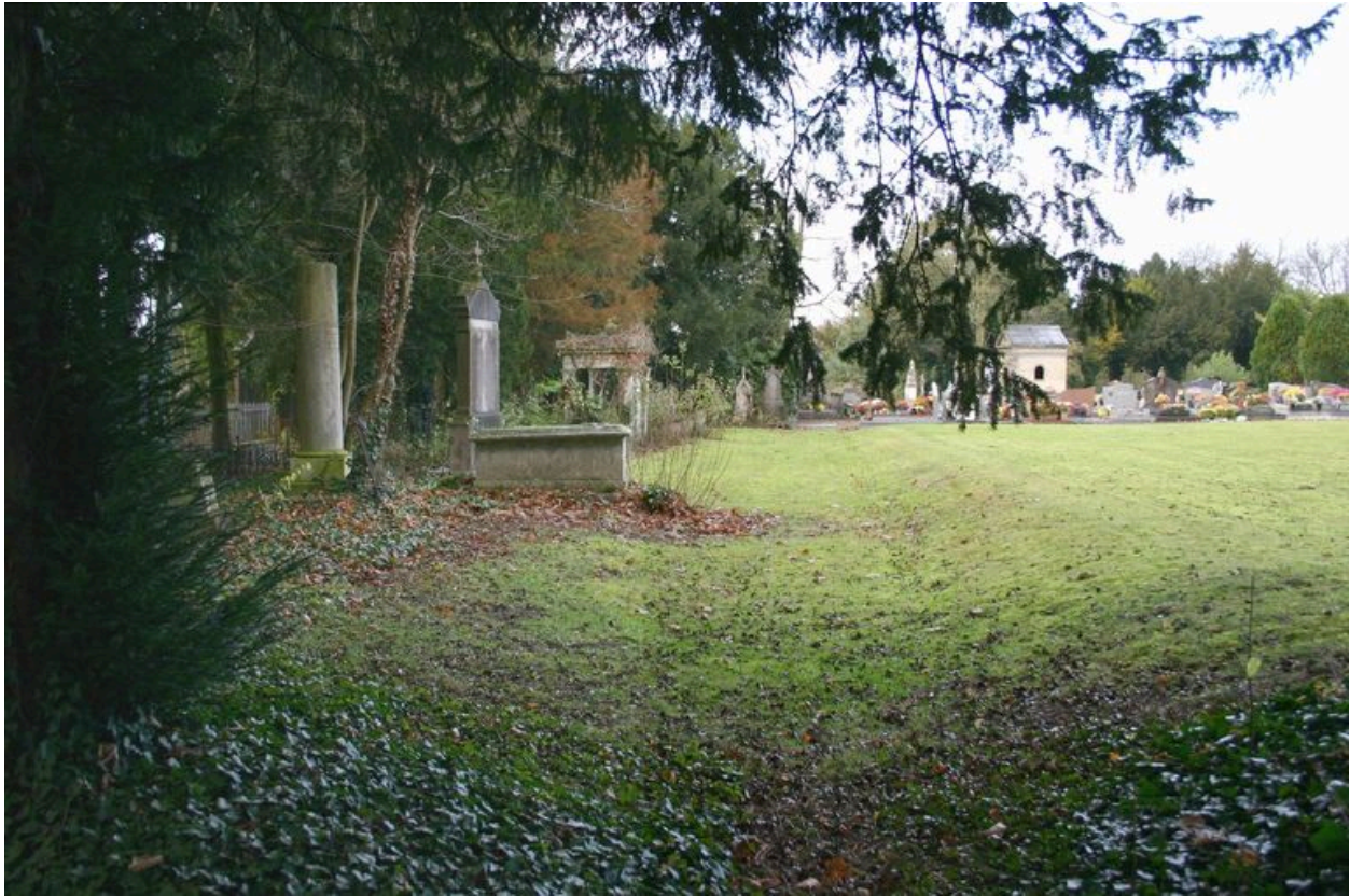
Vue générale, depuis le côté droit.