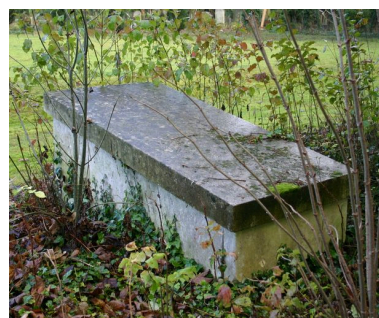
Tombeau en forme de sarcophage, côté gauche.