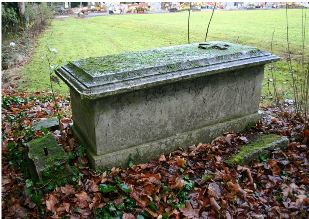
Vue rapprochée du tombeau en forme de sarcophage, côté droit.