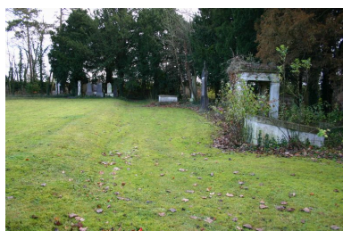
Vue générale, depuis le côté gauche. IVR22_20088000790NUCA