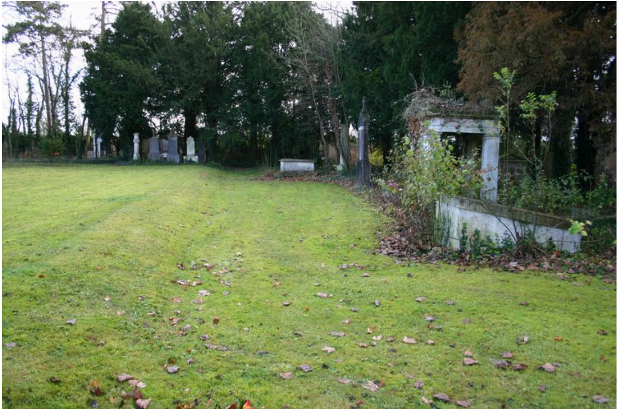
Vue générale, depuis le côté gauche.