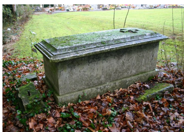
Vue rapprochée du tombeau en forme de sarcophage, côté droit. IVR22_20088000794NUCA