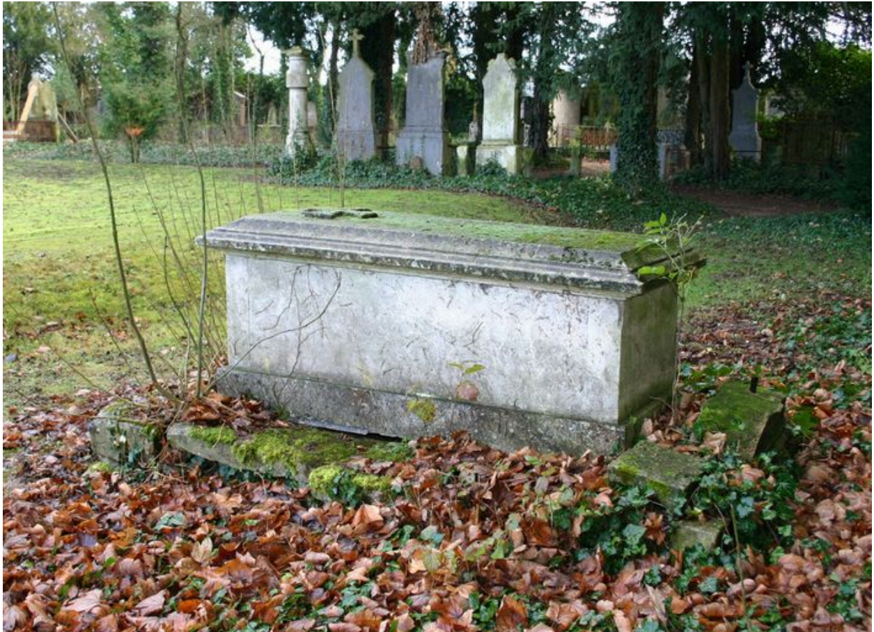
Tombeau en forme de sarcophage, côté droit.