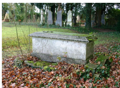
Tombeau en forme de sarcophage, côté droit.