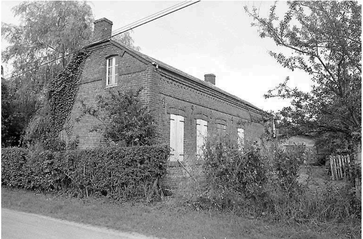
Vue du logis.