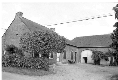
Vue générale. IVR22_19980202389Z