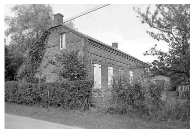
Vue du logis. IVR22_19980202388Z