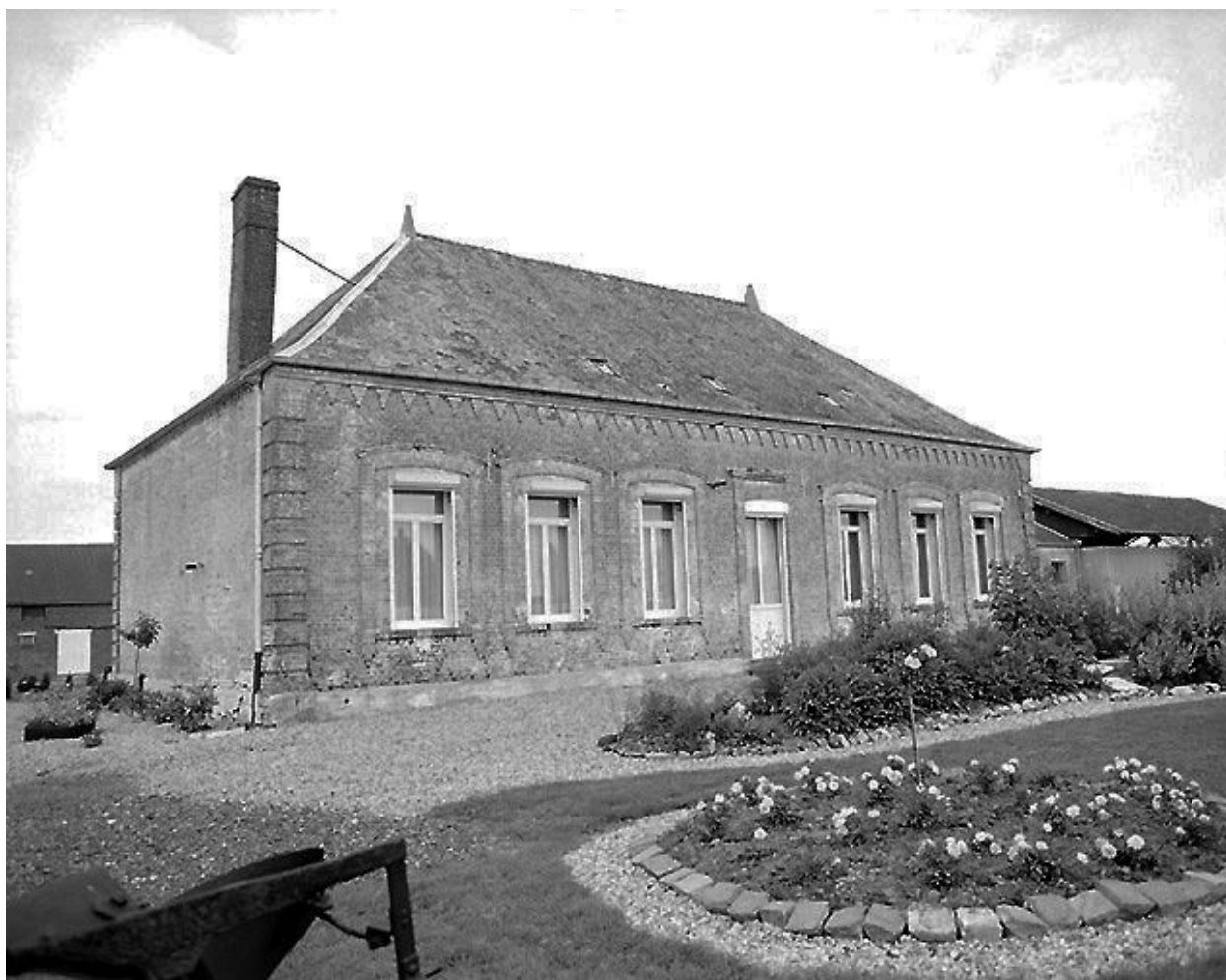
Vue générale de l'élévation postérieure du logis.