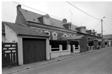
Logements d'ouvriers (rue Curie), vue générale, en 1991.