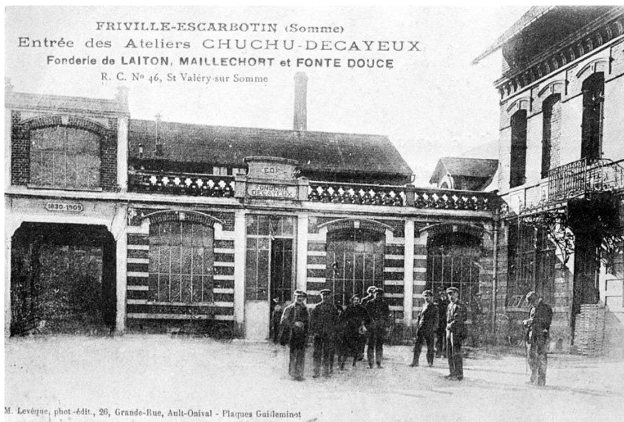
Entrée des ateliers avec groupe d'ouvriers, début du 20e siècle.