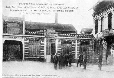
Entrée des ateliers avec groupe d'ouvriers, début du 20 e siècle (coll. part.). IVR22_19908000239ZB