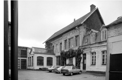
Conciergerie, atelier de fabrication, en 1991. IVR22_19918000134Z