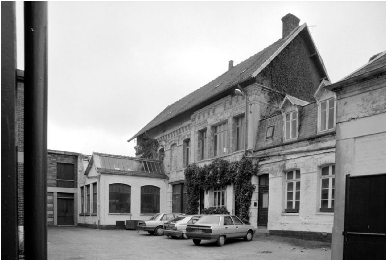
Conciergerie, atelier de fabrication, en 1991.