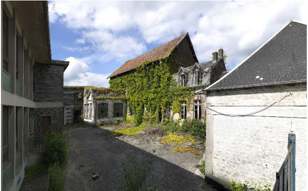
Vue des anciens groupes d'ateliers et du logement patronal depuis la rue Curie.