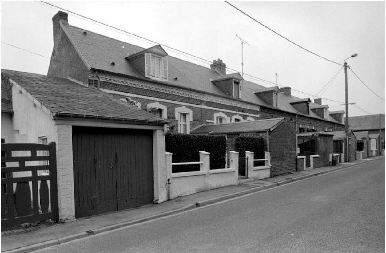
Logements d'ouvriers (rue Curie), vue générale, en 1991.