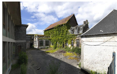
Vue des anciens groupes d'ateliers et du logement patronal depuis la rue Curie. IVR22_20158000575NUC2AQ