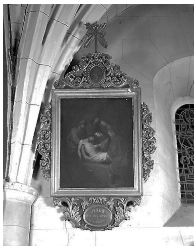
Vue d'une station.