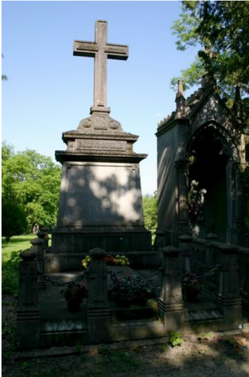
Stèle à croix monumentale, vers 1899, par Lesot (entrepreneur).