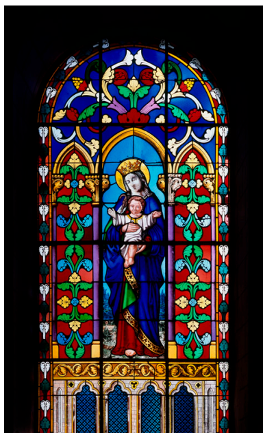
Baie 1 : Vierge à l'Enfant. IVR22_19988001133XA