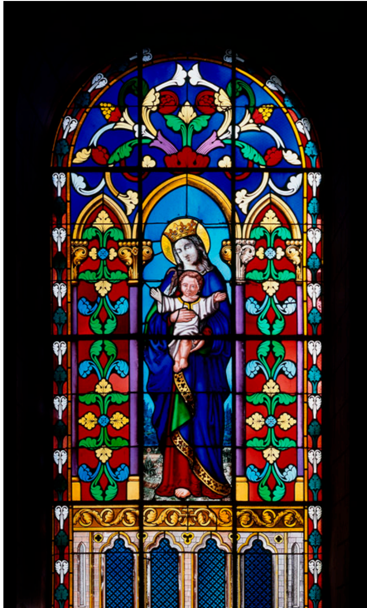
Baie 1 : Vierge à l'Enfant.