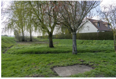
Ancienne mare, sortie est de la rue de Boursines, vue depuis le nord.