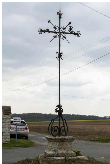
Croix au sud de la rue du Byon, vue depuis l'ouest.