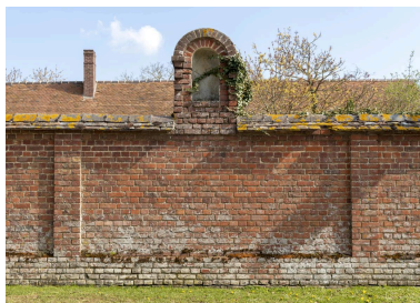
Mur en brique avec niche qui abritait une statue de saint Antoine avant 1970, partie est de la rue de Boursines, vue depuis le sud.

IVR32_20216000276NUCA