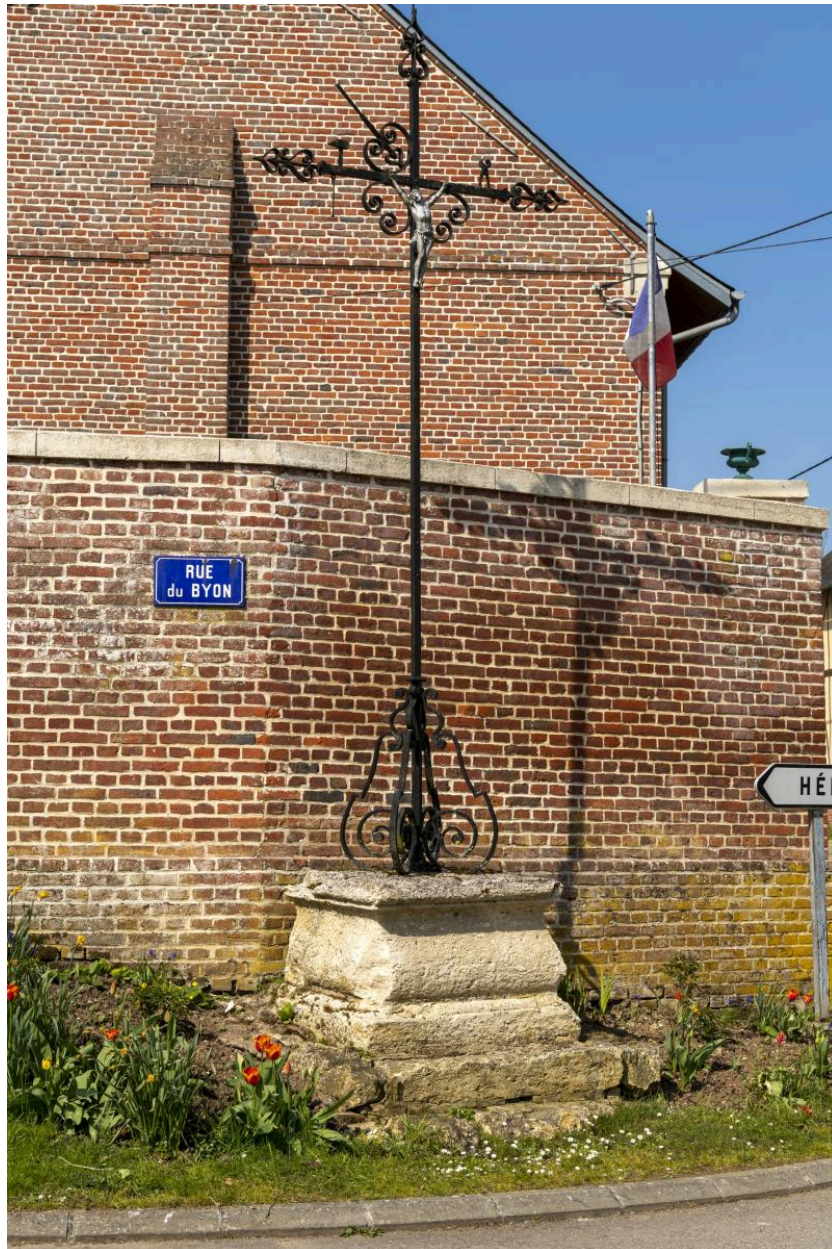
Croix dite calvaire Leclere-Jolly à l'intersection des rues de Boursines et du Byon, vue depuis l'est.