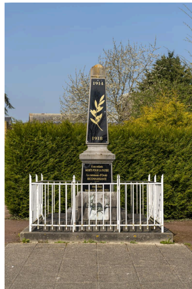
Monument aux morts de la Première Guerre mondiale, vue depuis l'est.

IVR32_20216000265NUCA