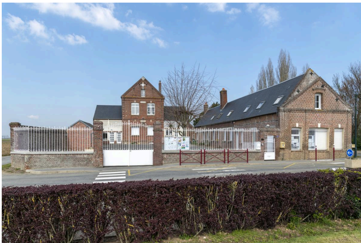
Mairie-école d'Oroër, vue depuis l'est.