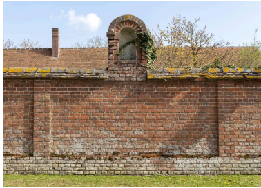
Mur en brique avec niche qui abritait une statue de saint Antoine avant 1970, partie est de la rue de Boursines, vue depuis le sud. IVR32_20216000268NUCA