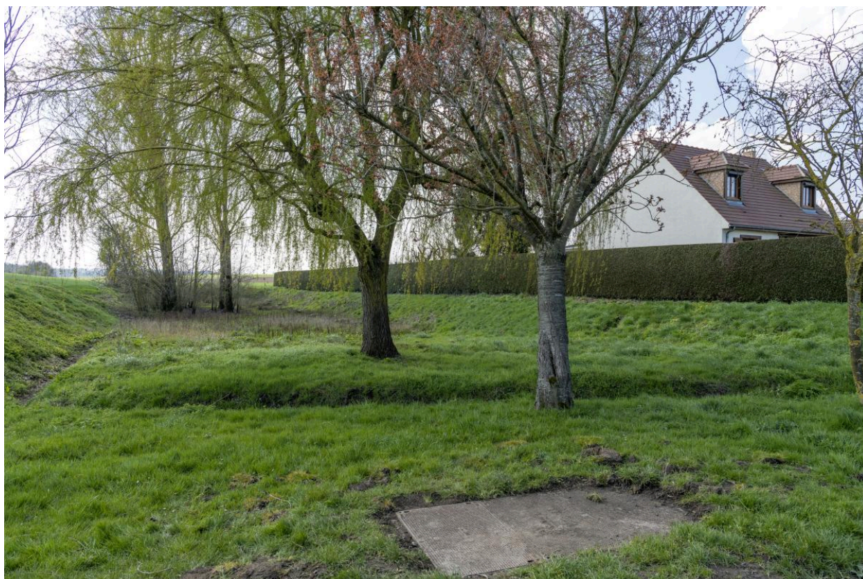
Ancienne mare, sortie est de la rue de Boursines, vue depuis le nord.