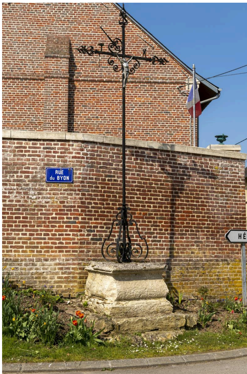
Croix dite calvaire Leclere-Jolly à l'intersection des rues de Boursines et du Byon, vue depuis l'est.