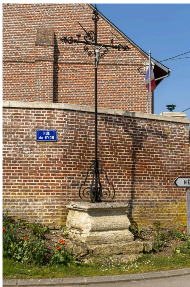
Croix dite calvaire Leclere-Jolly à l'intersection des rues de Boursines et du Byon, vue depuis l'est.