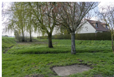
Ancienne mare, sortie est de la rue de Boursines, vue depuis le nord.

IVR32_20216000276NUCA