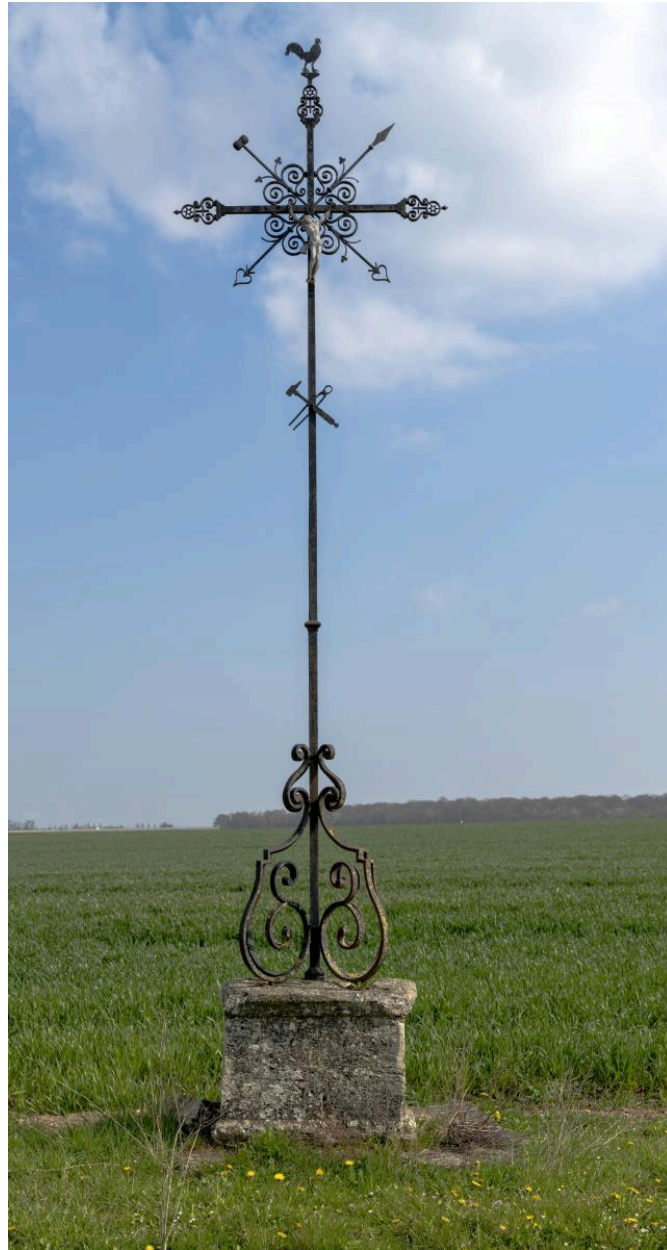
Croix sortie ouest de la rue de Boursines, dite calvaire Desesquelles vue depuis le sud.