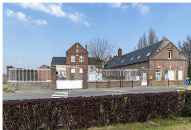
Mairie-école d'Oroër, vue depuis l'est.

IVR32_20226001210NUCA