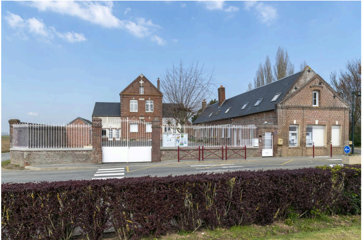
Mairie-école d'Oroër, vue depuis l'est.