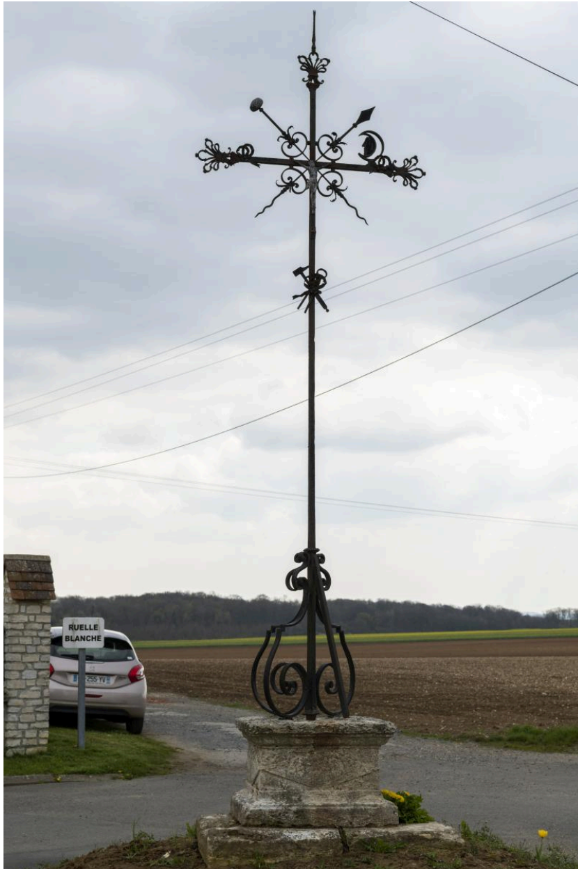
Croix au sud de la rue du Byon, vue depuis l'ouest.