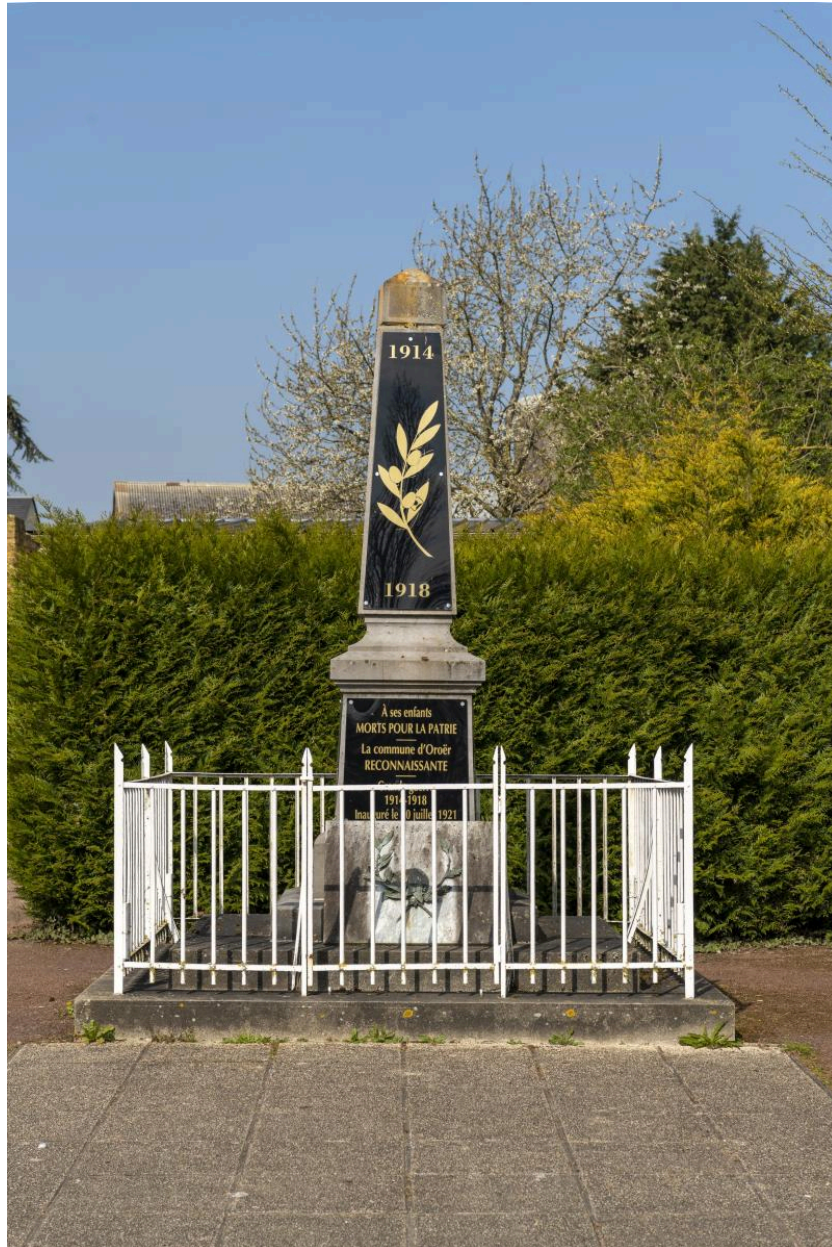
Monument aux morts de la Première Guerre mondiale, vue depuis l'est.