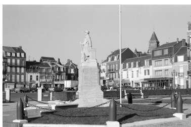
Vue de situation. IVR22_19968000142Z

IVR22_20118005008NUCA