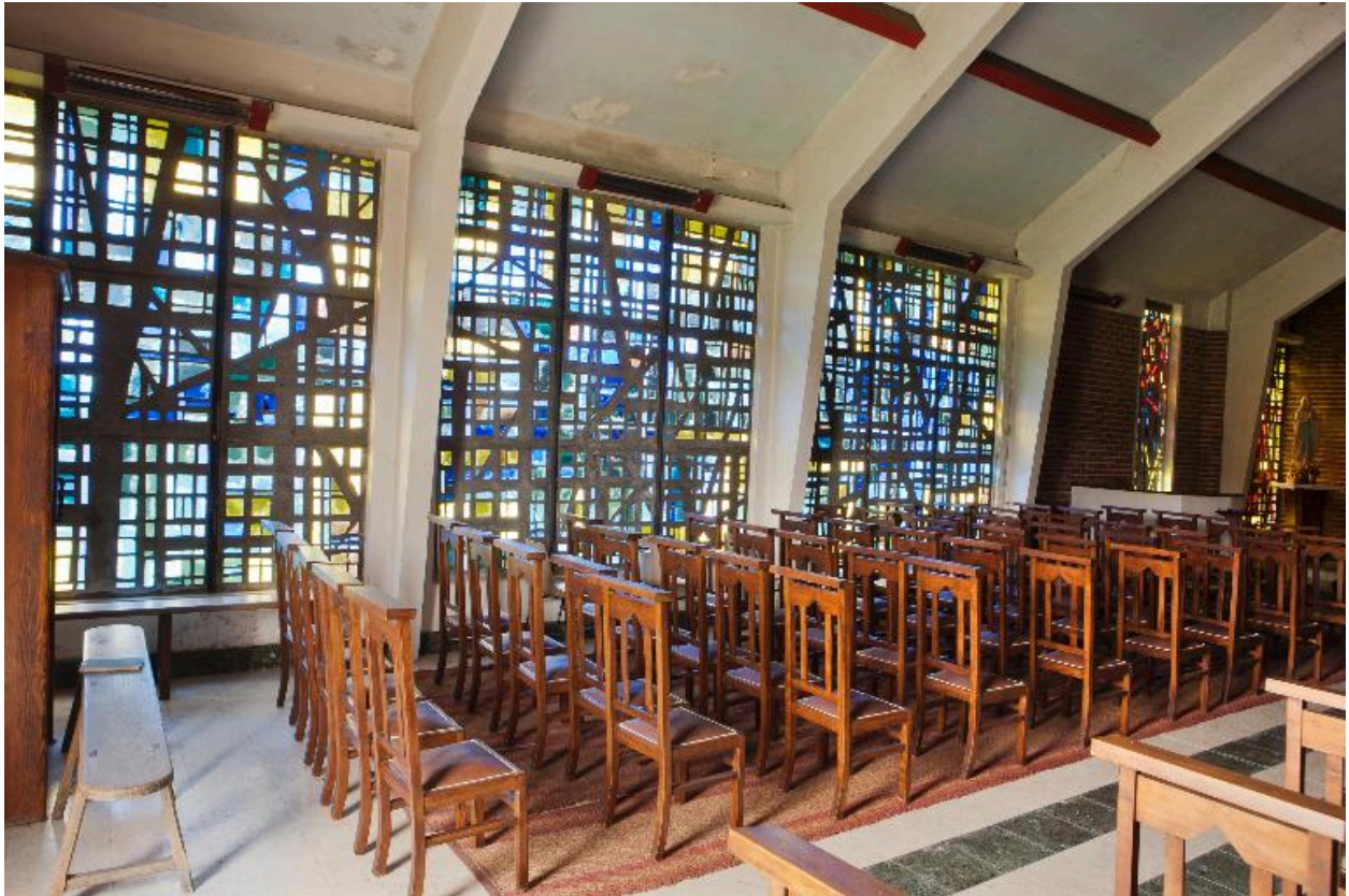
Vue générale des vitraux.