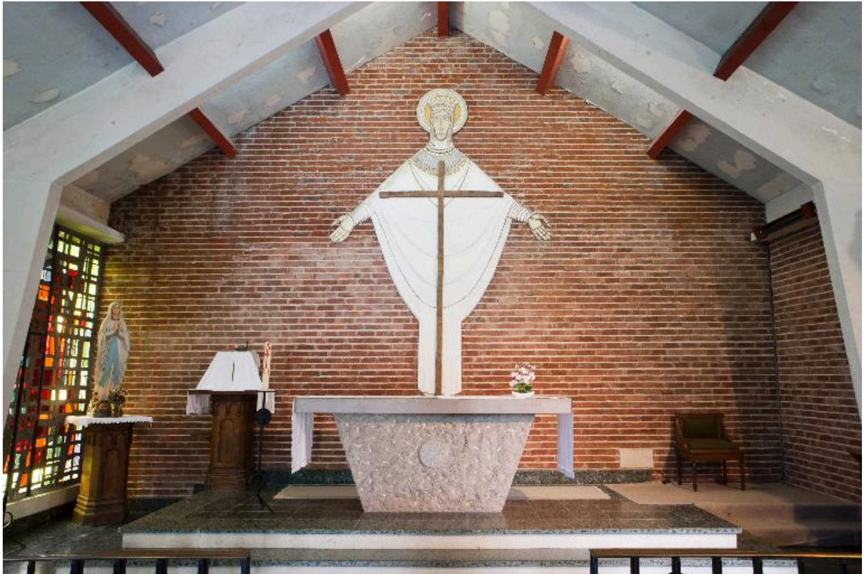
Vue générale du choeur et de l'autel.