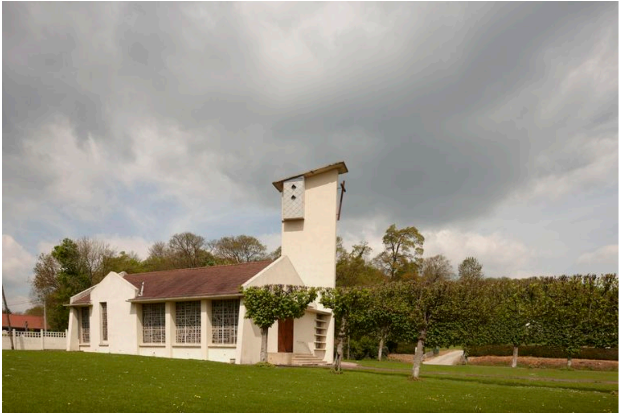
Vue générale latérale.