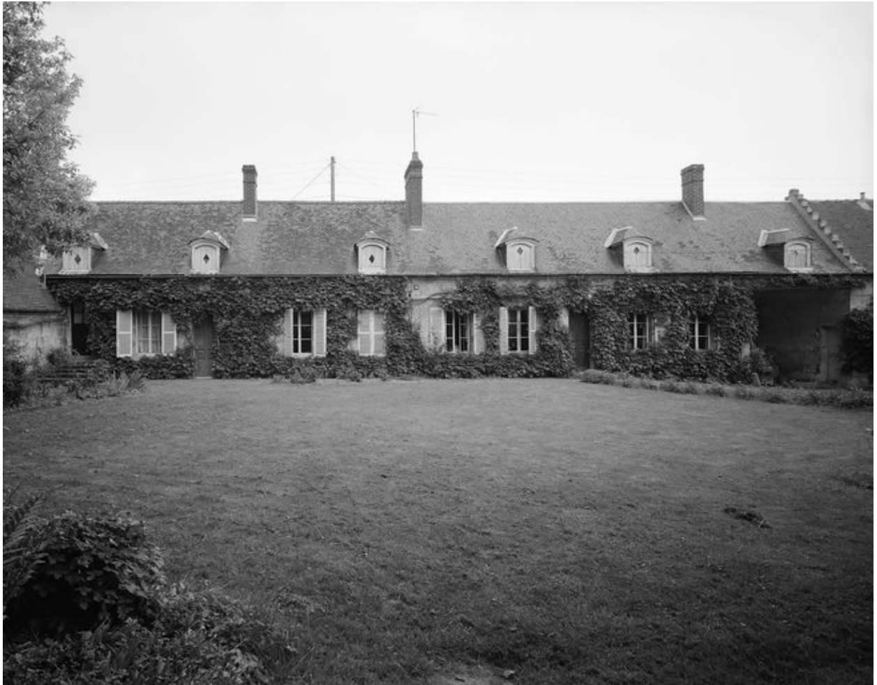
Elévation antérieure sur le jardin.