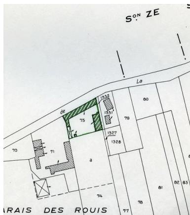
Plan de situation. Extrait du plan cadastral de 1962, section B1 75.