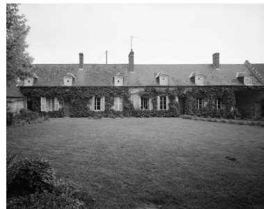
Elévation antérieure sur le jardin.