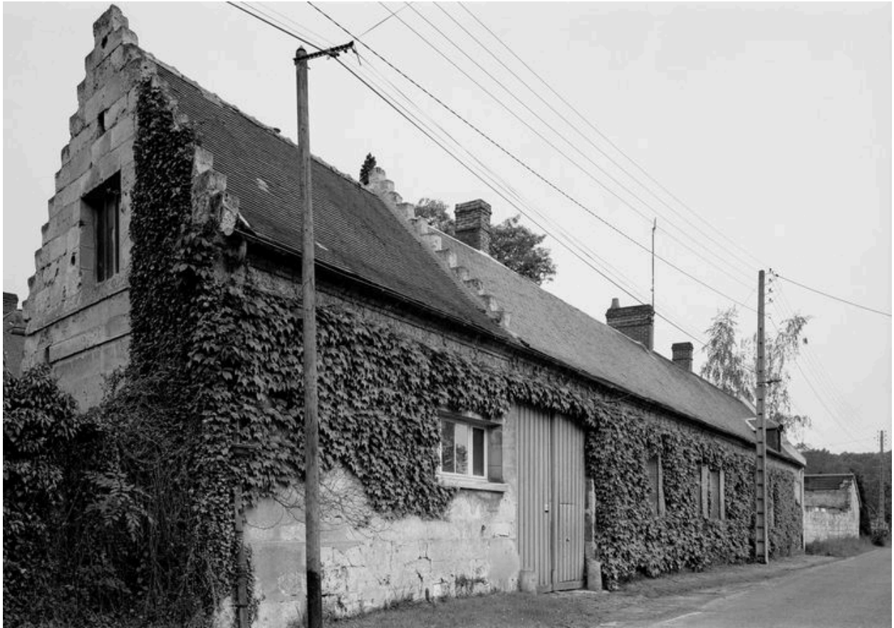
Vue générale depuis la rue.