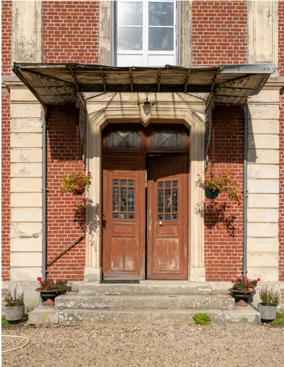
Entrée du logis côté sud.