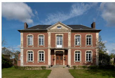
Vue générale du logis depuis le sud.