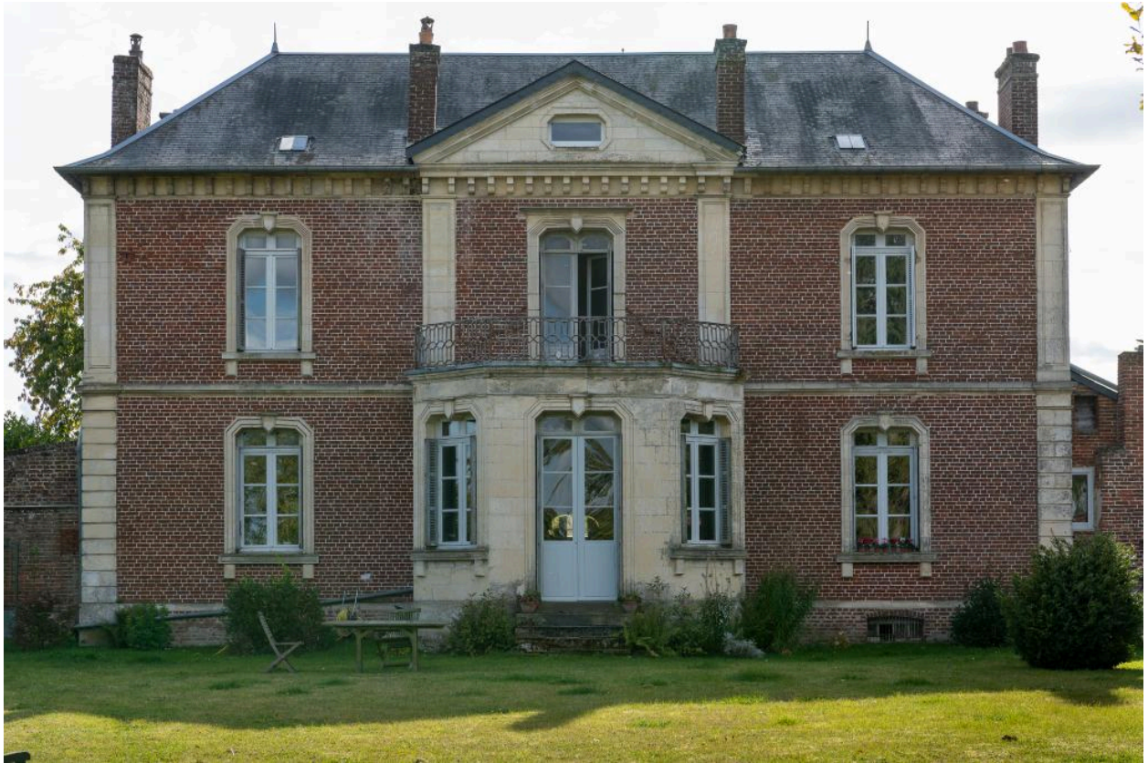
Vue générale du logis depuis le nord.