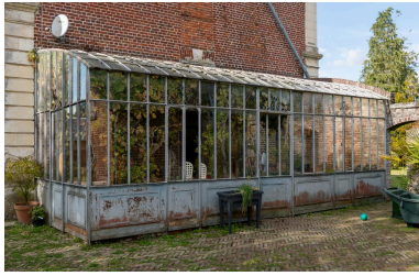
Serre contre le pignon est du logis.