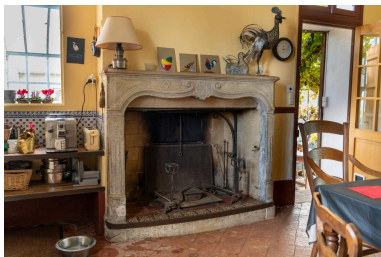
Cheminée de la cuisine.