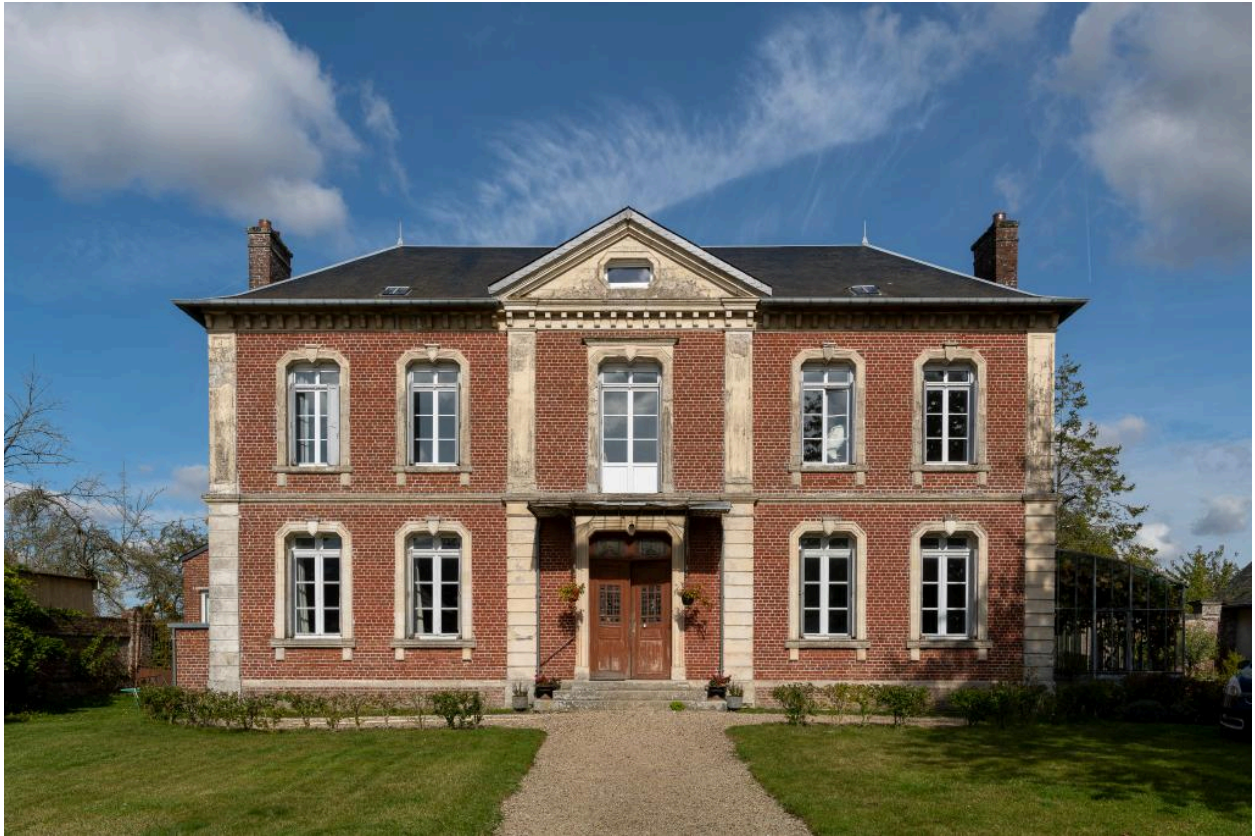
Vue générale du logis depuis le sud.