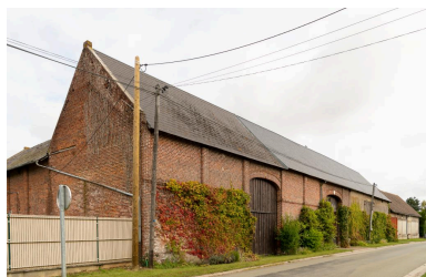
Vue des bâtiments agricoles alignés sur la rue depuis le sud-ouest.