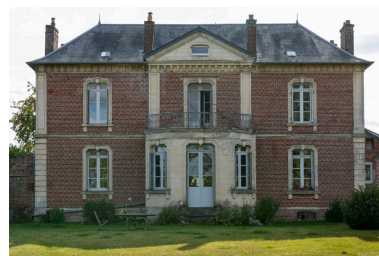
Vue générale du logis depuis le nord.