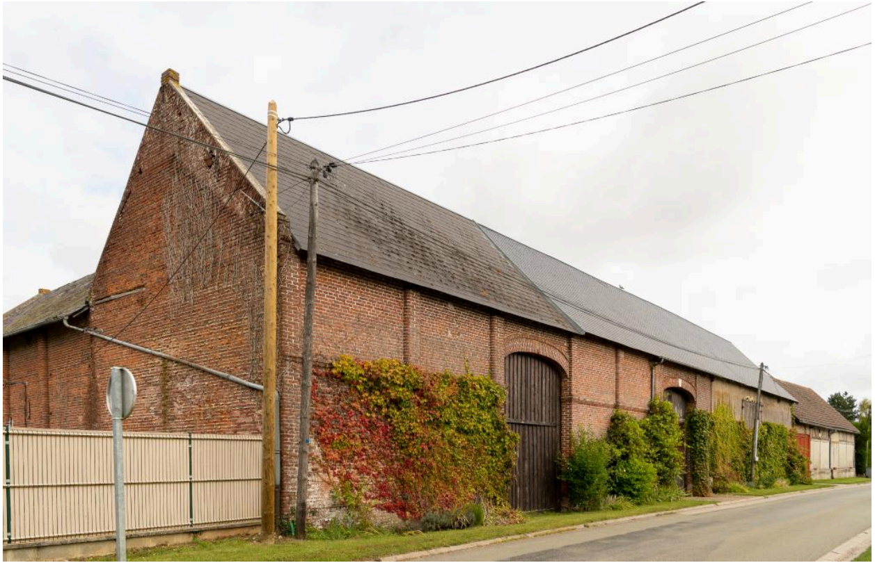
Vue des bâtiments agricoles alignés sur la rue depuis le sud-ouest.