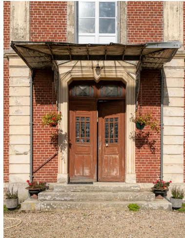
Entrée du logis côté sud.