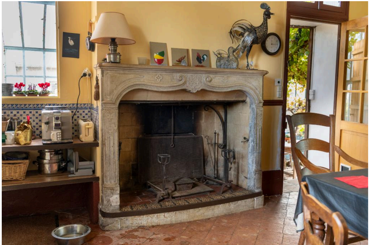
Cheminée de la cuisine.