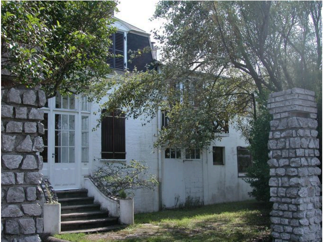
Détail de l'extension latérale.