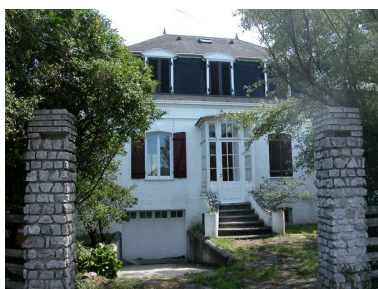
Vue d'ensemble.