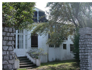
Détail de l'extension latérale. IVR22_20048001598NUCA