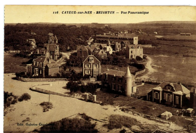
La maison, à gauche, carte postale, 1er quart 20e siècle (coll. part.). IVR22_20058000505XAB