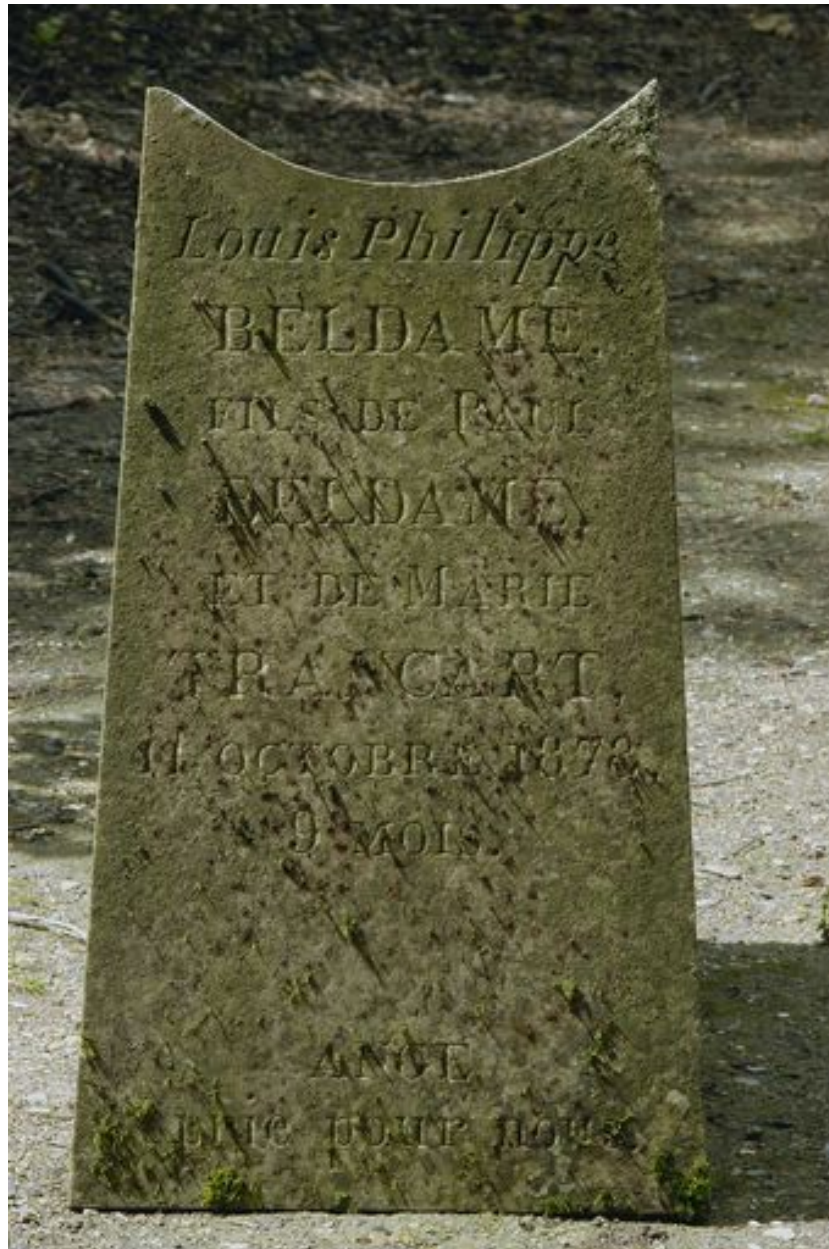
Table de la stèle de Louis Philippe Beldame.