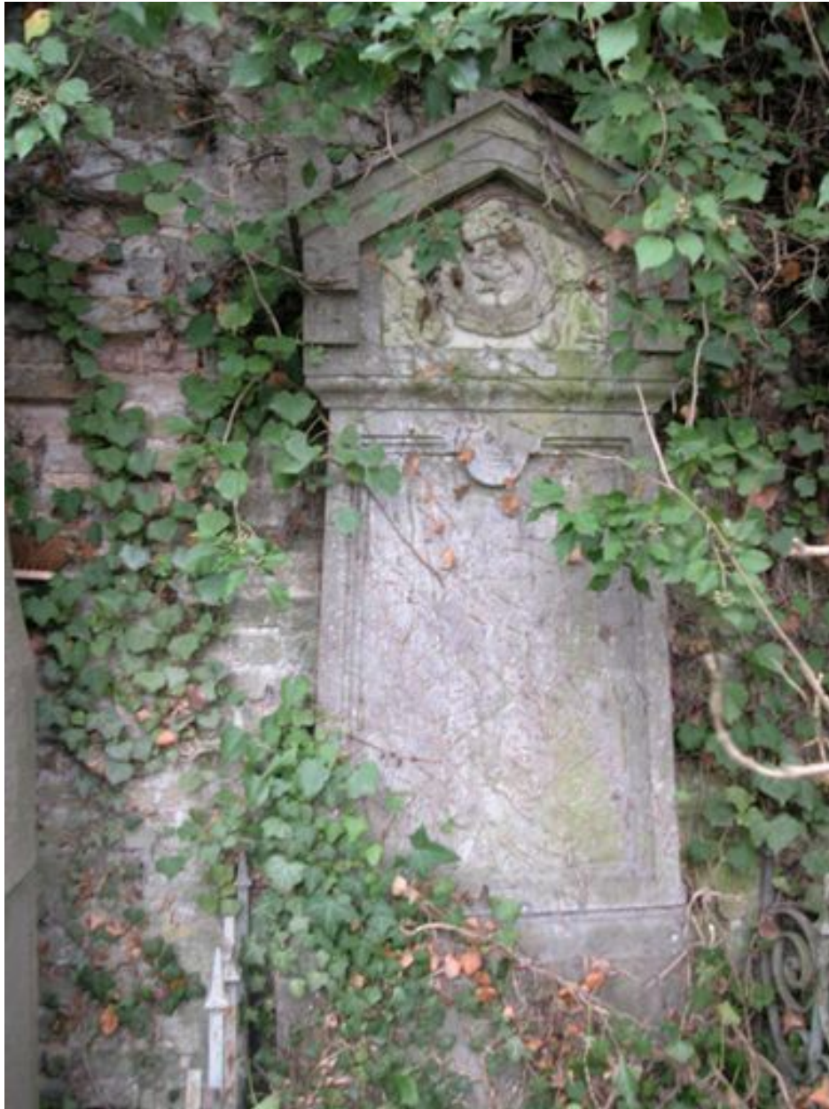
Vue de la stèle.