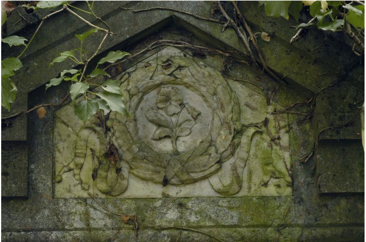
Vue du bas relief.