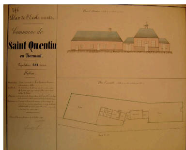
Plan et élévation de l'école mixte en 1878.