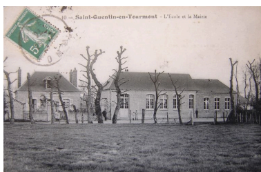
Vue de la mairie école au début du 20e siècle.