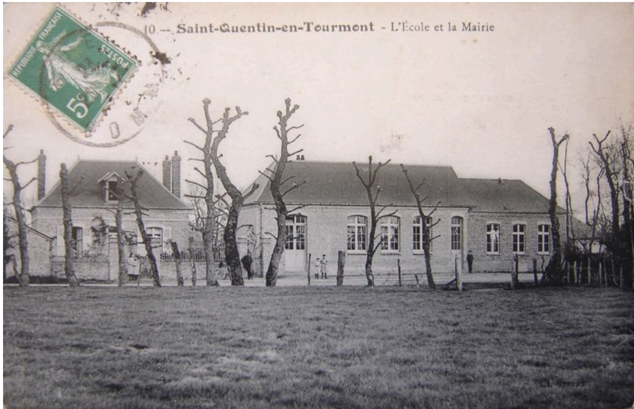
Vue de la mairie école au début du 20e siècle.