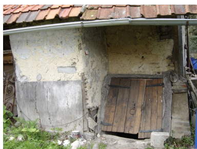
Détail de l'accès à la cave située au nord de la cour. IVR22_20058005701NUCA