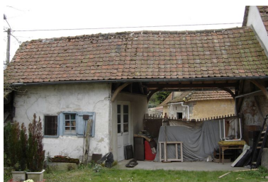
Vue du corps de passage depuis la cour. IVR22_20058005697NUCA