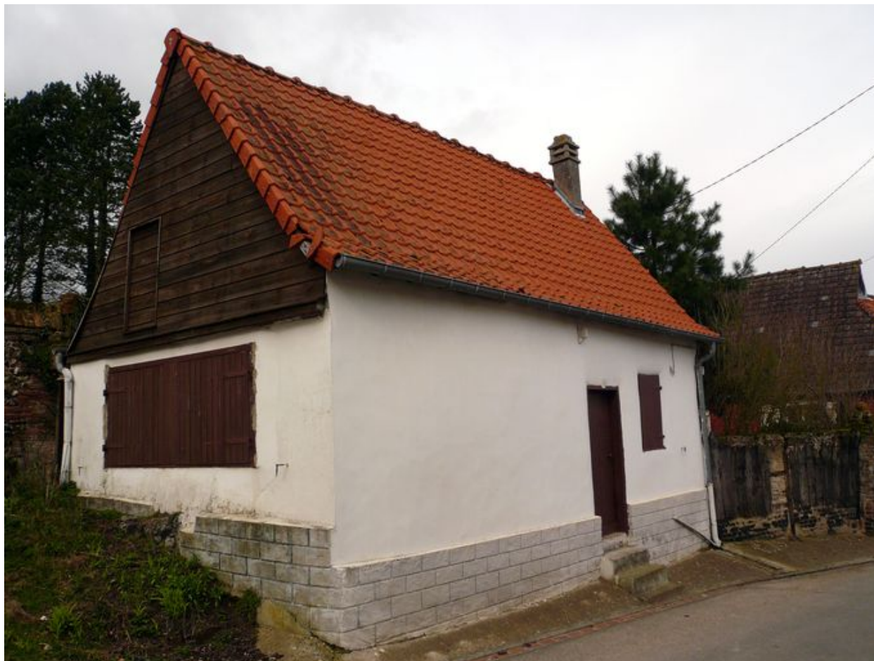
Vue de l'ancienne grange depuis la rue.