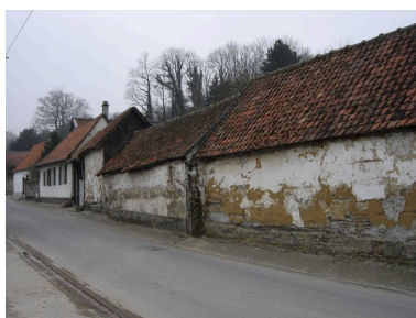
Vue des bâtiments agricoles sur rue. IVR22_20058005003NUCA