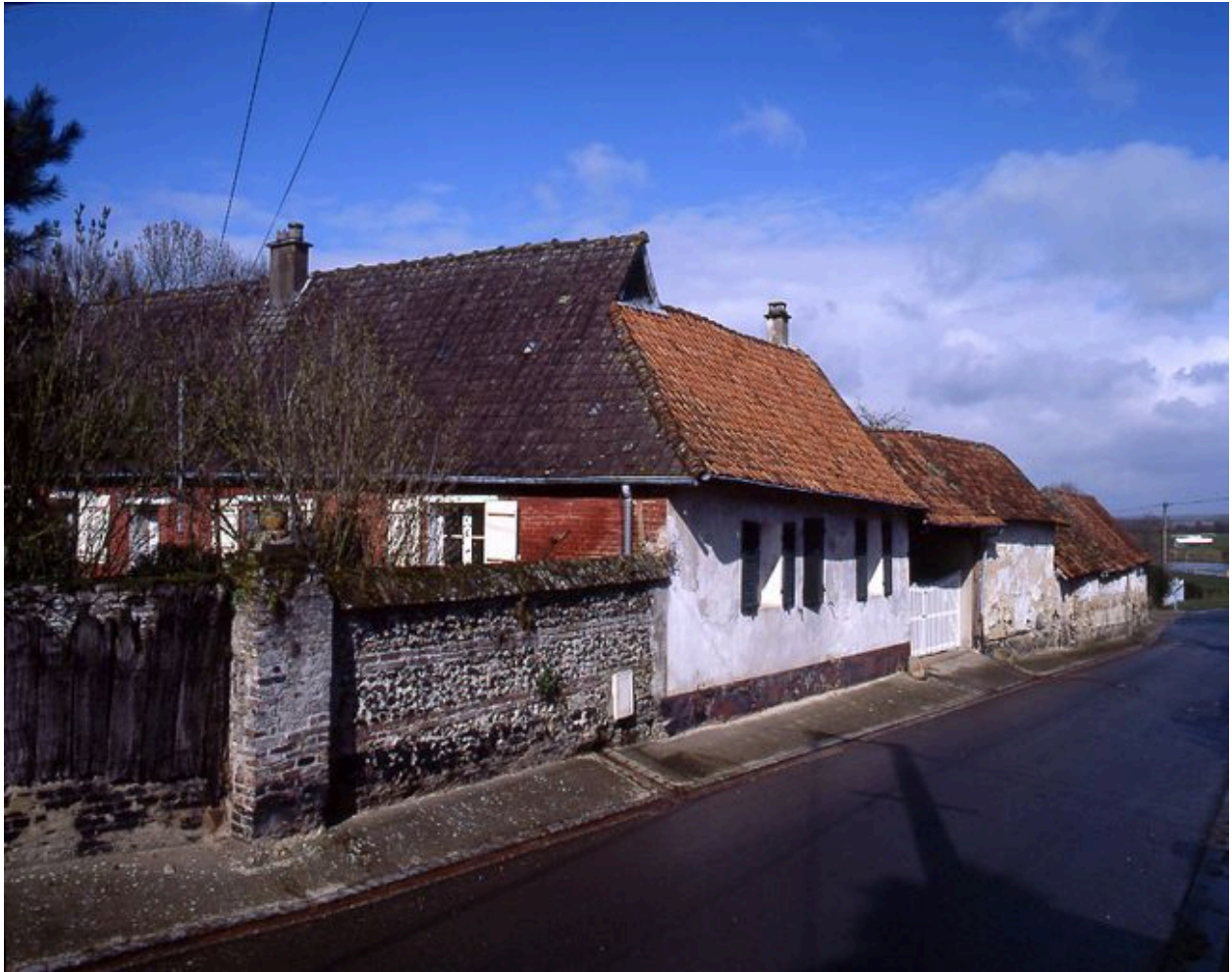
Vue générale depuis le sud.