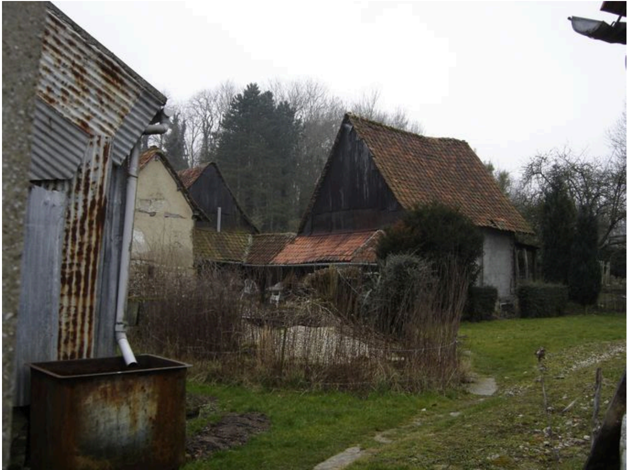
Vue d'ensemble des bâtiments situés au nord de la propriété.