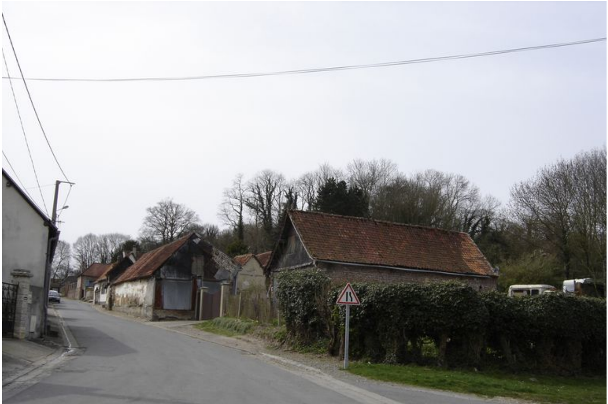
Vue générale depuis le nord.