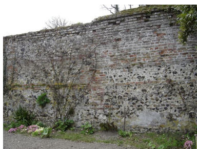
Détail du mur de clôture. IVR22_20058005708NUCA