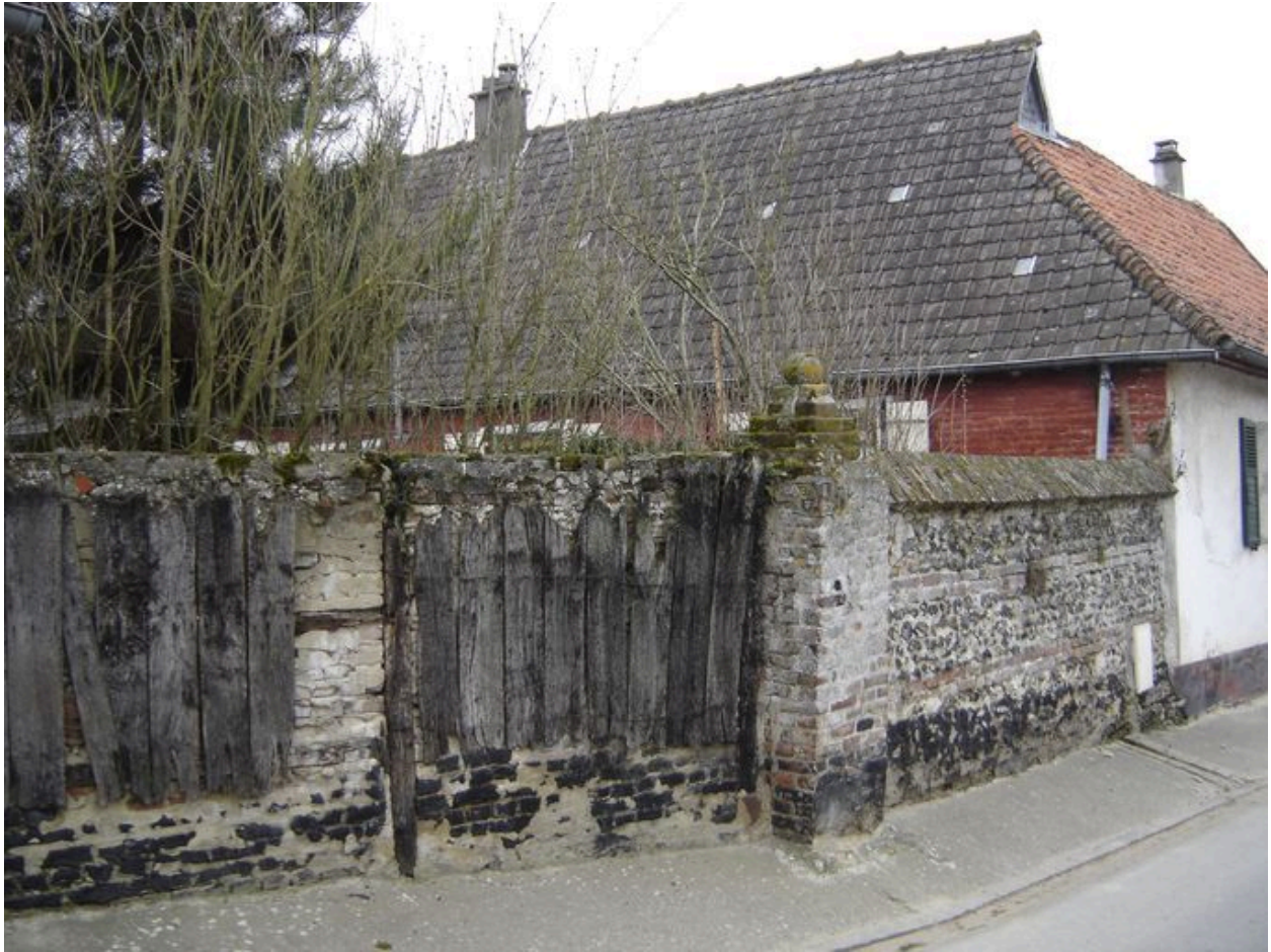
Vue détaillée de l'entrée d'origine.