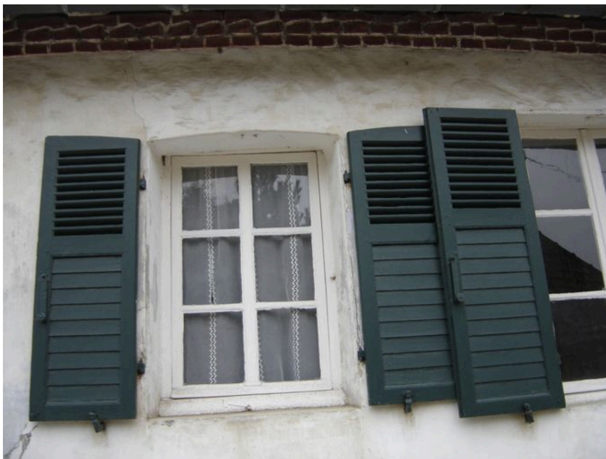
Détail de la fenêtre du logis qui semble dater du 18e siècle.