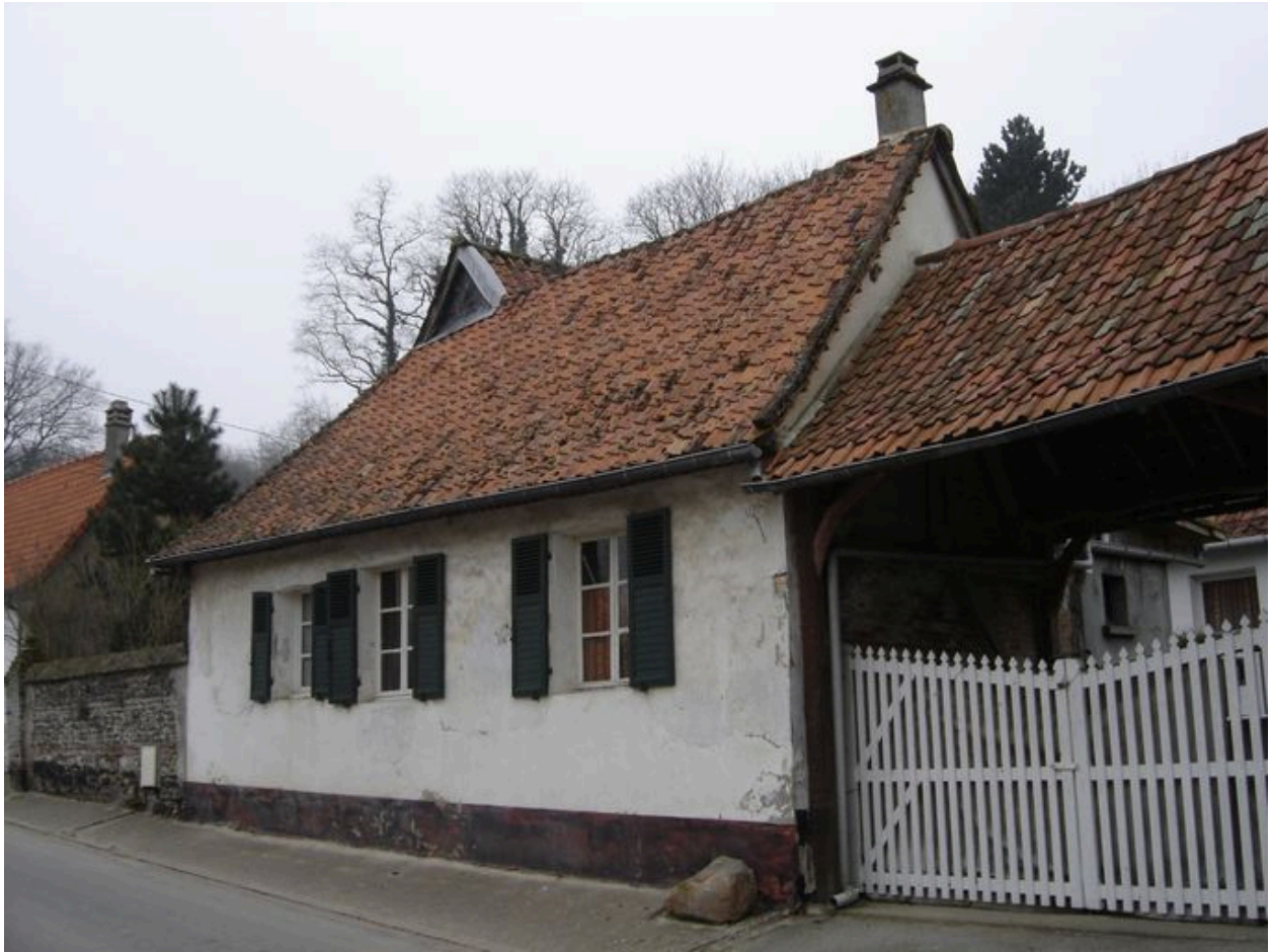
Vue du logis sur rue.