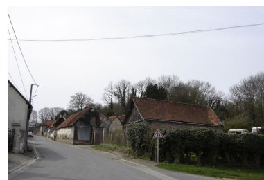
Vue générale depuis le nord.