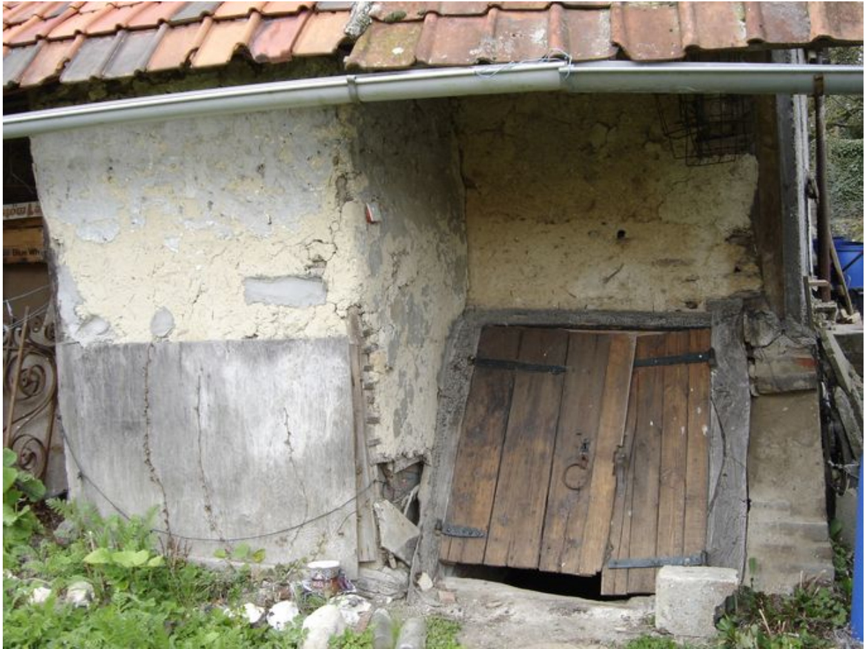
Détail de l'accès à la cave située au nord de la cour.