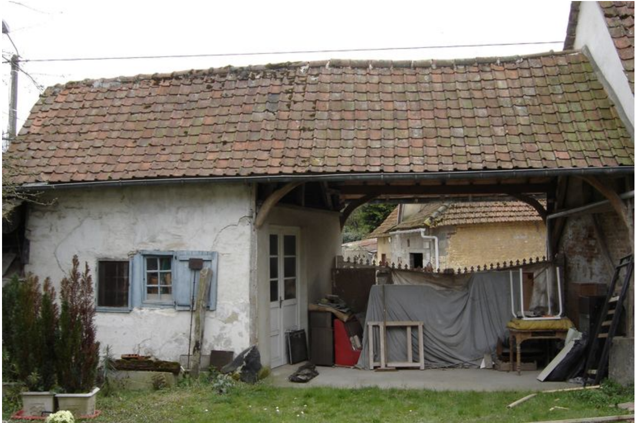
Vue du corps de passage depuis la cour.