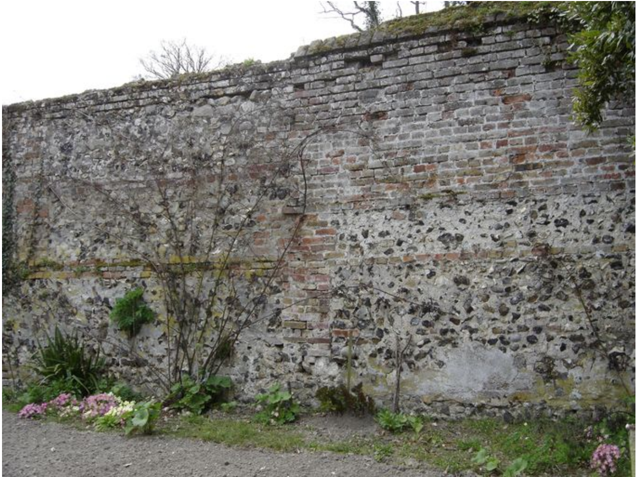
Détail du mur de clôture.