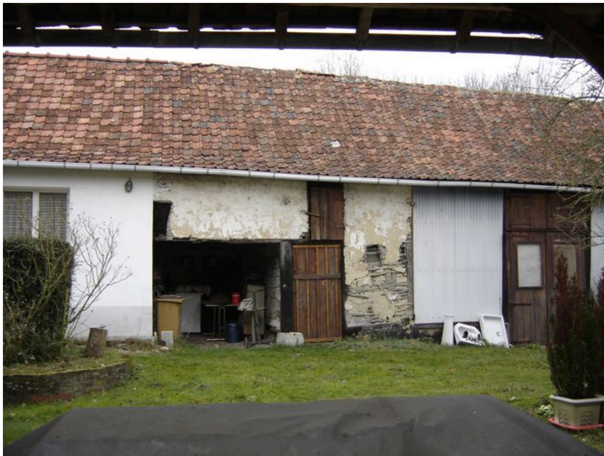
Vue du bâtiment agricole situé dans le prolongement du logis en fond de cour.