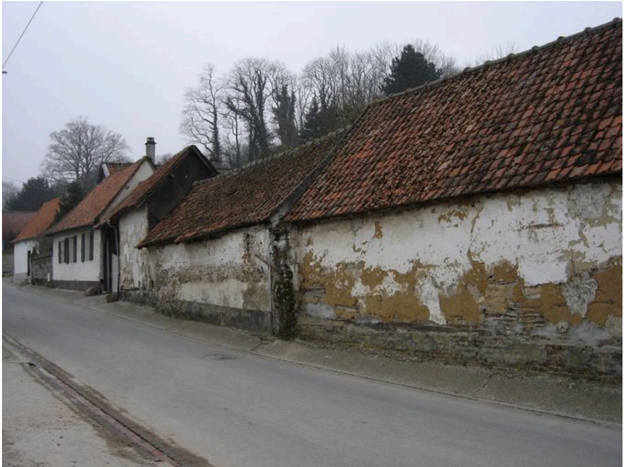
Vue des bâtiments agricoles sur rue.