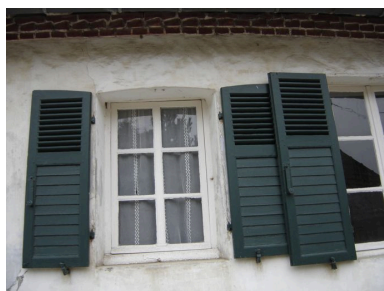
Détail de la fenêtre du logis qui semble dater du 18e siècle.