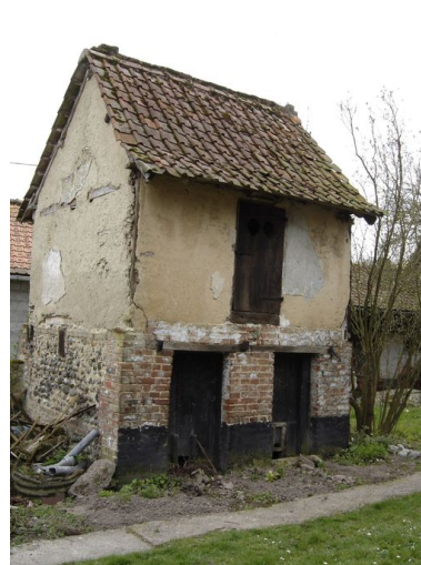
Vue du fenil situé au centre de la propriété.