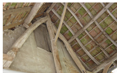
Détail de la charpente du passage couvert. La porte située dans le pignon permet d'atteindre le grenier situé au-dessus du logis sur rue.