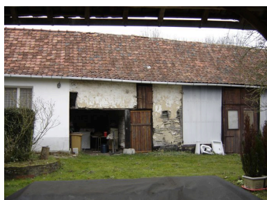
Vue du bâtiment agricole situé dans le prolongement du logis en fond de cour. IVR22_20058005007NUCA