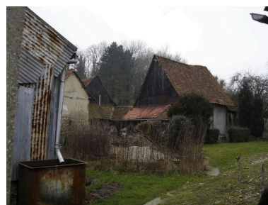
Vue d'ensemble des bâtiments situés au nord de la propriété.