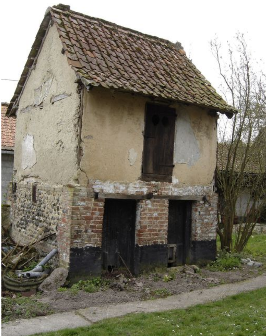
Vue du fenil situé au centre de la propriété.