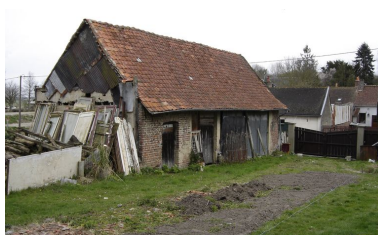
Bâtiment situé à l'est de la propriété. IVR22_20058005702NUCA