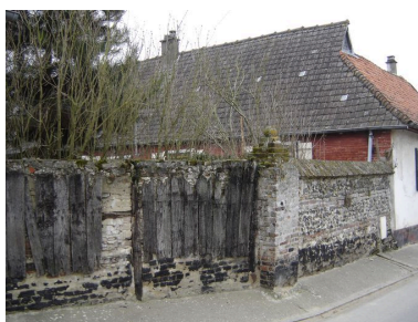
Vue détaillée de l'entrée d'origine.