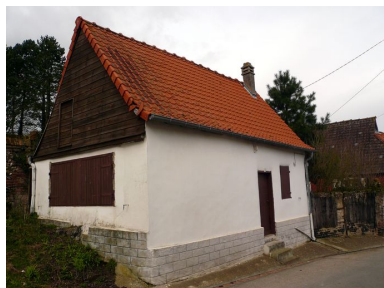
Vue de l'ancienne grange depuis la rue. IVR22_20078005386NUCA