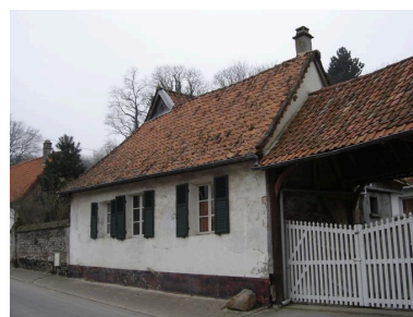
Vue du logis sur rue. IVR22_20058005004NUCA