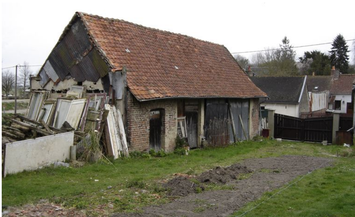
Bâtiment situé à l'est de la propriété.